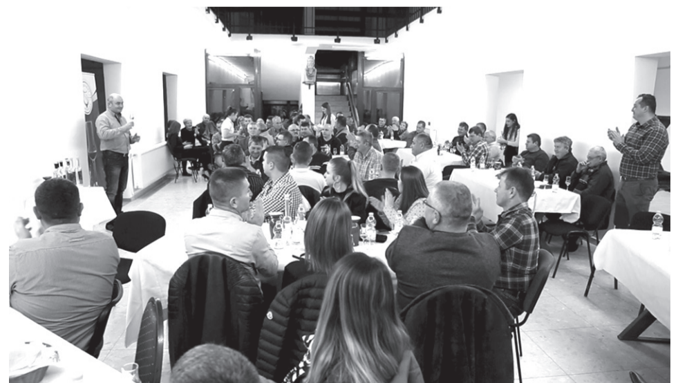
A jelenlévők közül sokan most vettek először részt hasonló pálinkakóstoló esten

Nemzetközi pálinkabíró, a sepsiszentgyörgyi Potio Nobilis Pálinkárium társtulajdonosa, 2019-ben az év pálinkafőző mestere, az Erdélyi Pálinka Lovagrend szakmai vezetője, vállalkozó évek óta világbajnok pálinkákat készít és értékesít. 2019-ben megnyerte Kelt-Közép-Európa legnagyobb pálinkafőző versenyét. A sepsiszentgyörgyi cég párlatait öt ország több mint kétezer mintája közül választották a legjobbnak. A Potio Nobilis hat Champions-díjjal és 12 aranyéremmel elnyerte az év legjobb kereskedelmi főzdeje címet a Quintessence pálinka- és párlatverseny tavalyi, tizedik kiadásán.