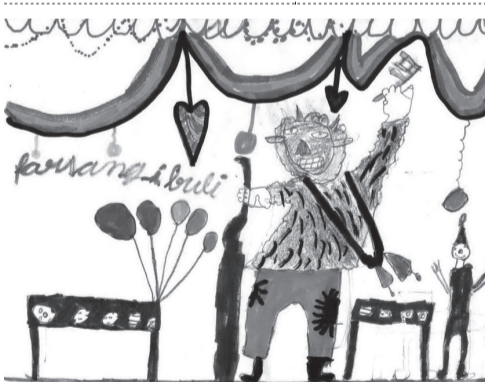
OROSZ ALEXANDRA (III. B osztály)