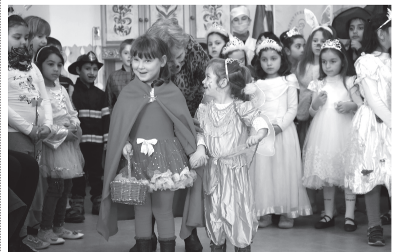
Nemcsak a gyerekek, hanem nevelőik is álarcot öltöttek

A felvonulás érdekességként nemcsak a gyerekek, hanem nevelőik is álarcot öltöttek, így ők is beálltak a bemutatkozók sorába.