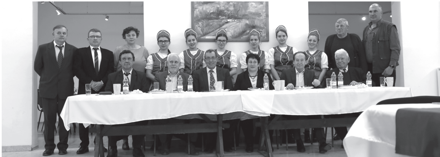
A rendezvény mozaikrészlete: a zsűriasztalnál helyet foglaló bírálók, illetve a háttérben a főszerzők és a népviseletbe öltözött felszolgáló önkéntesek

Az igényes szőlősgazdák minőségi nedűi jellemezték a XXVI. Érmelléki Borversenyt