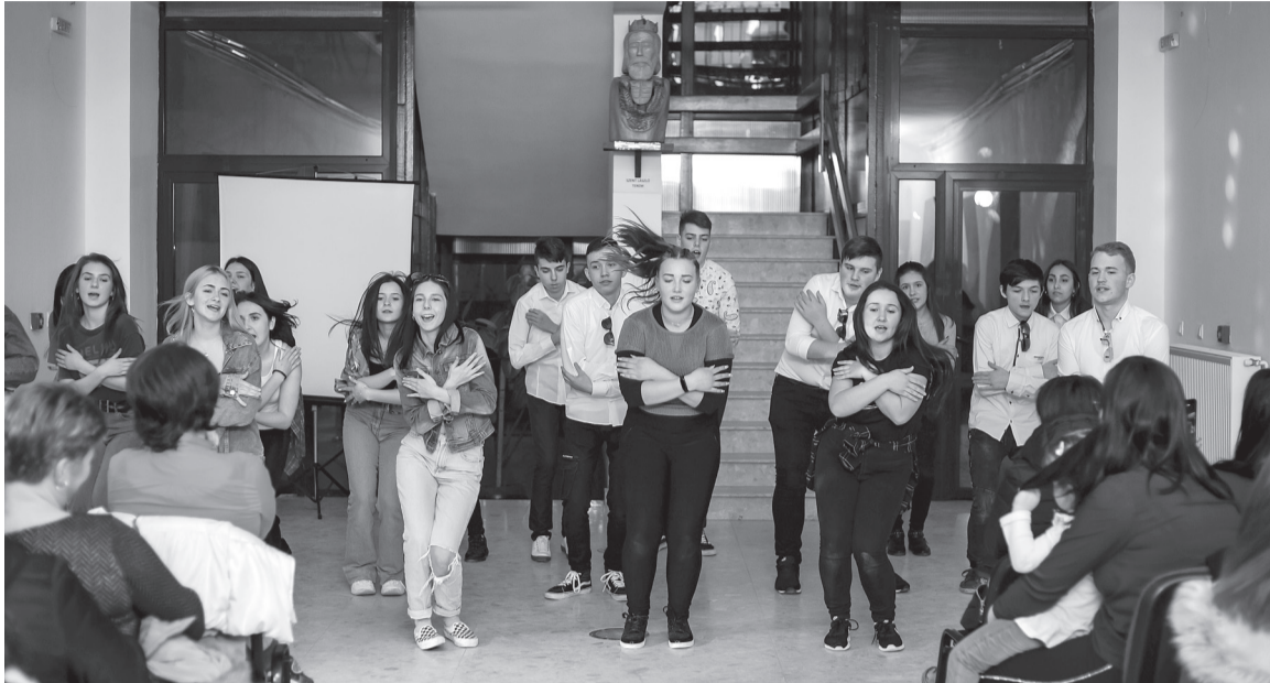
Az osztályok tánca a '90-es évekbe repítette vissza a diákokat és a nézőket

Idén a retróirányzat jegyében hirdették meg a Petőfi Sándor Elméleti Líceum farsangi mulatságát. A városi múzeum épületében február elején megrendezett bensőségesebb, de vidám hangulatú műsort hagyományosan a X. osztályos tanulók szervezték meg, akik a tanulás mellett ezzel is kiveszik a részüket az iskolai életből.