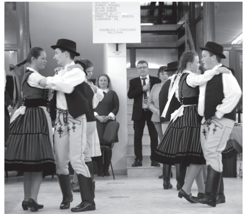
Felcsíki táncokkal örvendeztette meg a vendégeket a Zajgó Néptáncscsoport