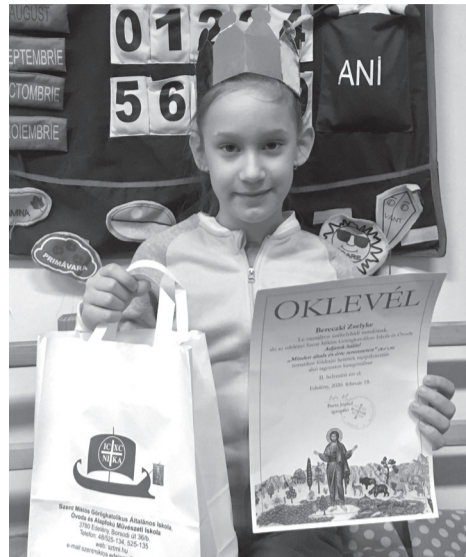
Az első Zselyke, a rajzverseny II. díjasa