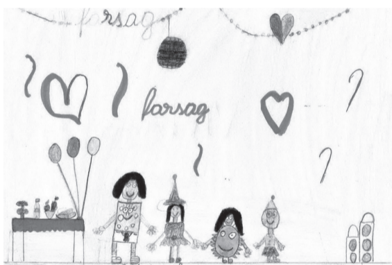
GALACZI VIVIEN (III. B osztály)