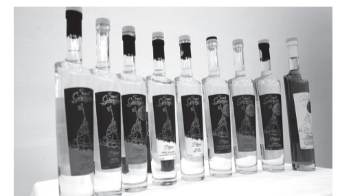
Minőségi gyümölcspárlatok felhozatala