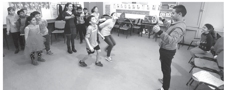
Az osztálytermek „játéktereppe” alakultak