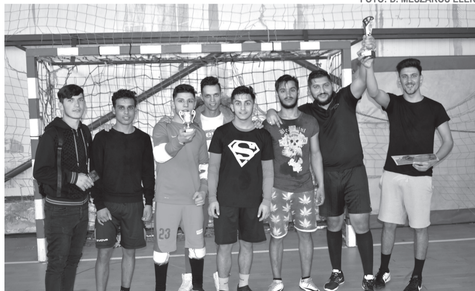
A jótékonyági labdarúgók meglepetésgyőztesei, a Roma FC csapata

gyobb esélyes találkozott, az érmihályfalvi Bad Boys és a helyi Kansas City. A rendes játékidőben nem találtak fogást egymáson a felek, a büntetőrúgások pedig a Kansasnak kedveztek. A bronzmeccs lett talán a nap egyik legsimább mérkőzése, a Bad Boys 4-2-re verte a végére teljesen elfáradó 7Dayst. A döntő pedig a nap legjobb és legfordulatosabb mérkőzését hozta. Egy igazi adok-kapok után, a látottak alapján nem biztos, hogy meglepetésre a Roma FC 3-2-re verte a Kansas Cityt, így ők emelhették magasba a bajnoki trófeát.