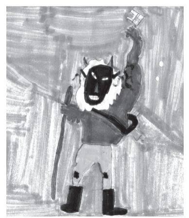
KOVACSINSZKI BRENDON (III. B o.)