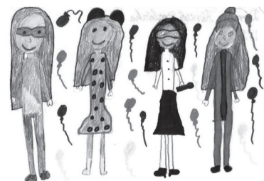
DOMBI KINCŐ BOGLÁRKA (IV. B o.)