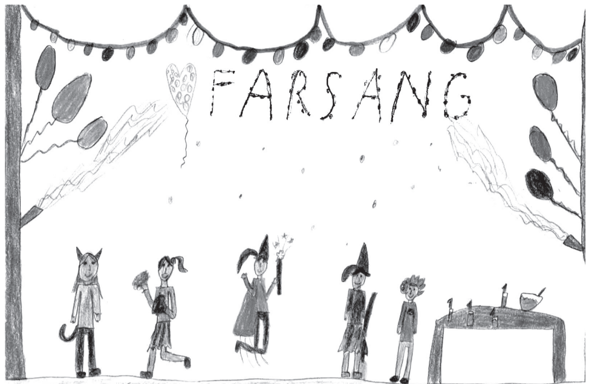
TATAI RÉKA (III. B osztály)