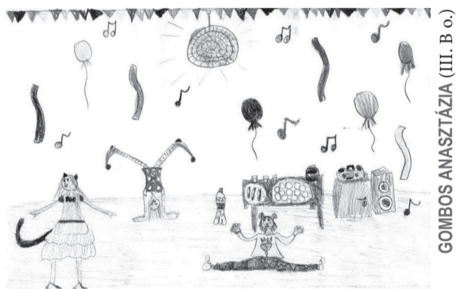
GOMBOS ANASZTÁZIA (III. B o.)