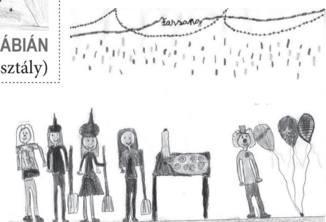
SISKA BERNADETT (III. B osztály)