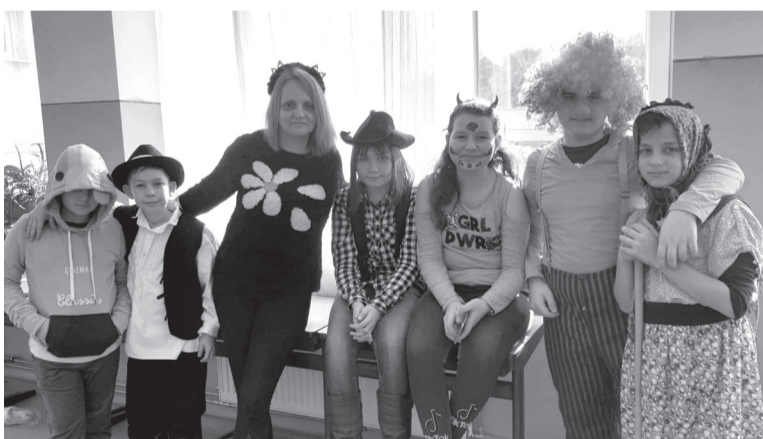
Minden versenyző ötletes jelmezével járult hozzá a nap sikeréhez

Méltán temették el a telet a farsangi kavalkádon változatos, színes figuráknak, hősöknek beöltözött diákok, valamint osztályfőnökeik a Nagykágyai 1. Számú Technológiai Líceum általános tagozatán február 17-én. A délutáni rendezvény közös pizzázással indult, majd bemutatták a jelmezeket, amiket egy-egy frappáns versike kísért, és táncmulatsággal zárult.