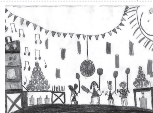
BEREKSZÁSZI ÁKOS (III. B osztály)