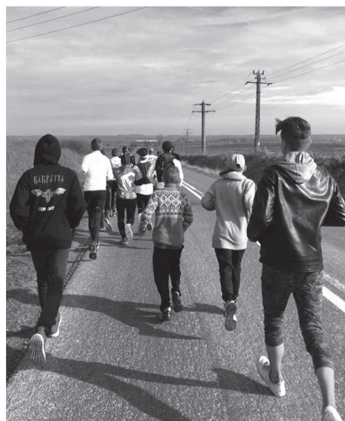
Sok gyermek futott együtt a Debrecenből érkező jótékonnykodókkal

Izgalmas érzés volt beleolvadni az ultrafutók csapatába és velük futni. Még 44 kilométer