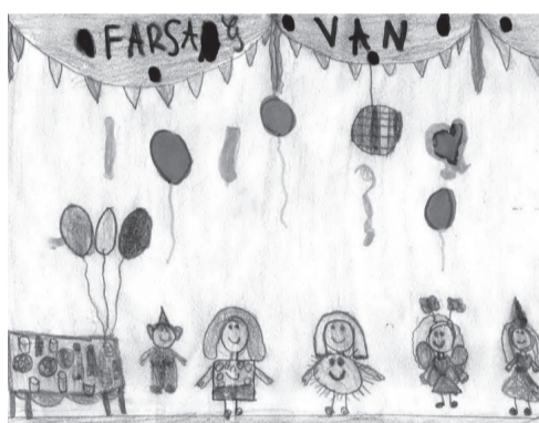
DEMIÁN JÁZMIN ABIGÉL (III. B osztály)