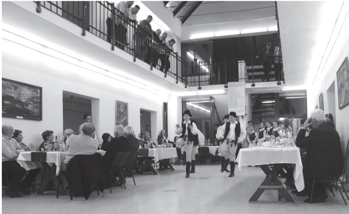
Este terített asztallal várták a versenyzőket és az érdeklődőket a díjkiosztó vacsorára

Az Ady Endre Művelődési Házban, a múzeumban már pénteken, a ver-