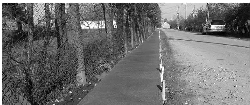
A latyakos idő beköszöntére elkészült a járda Csokalyon