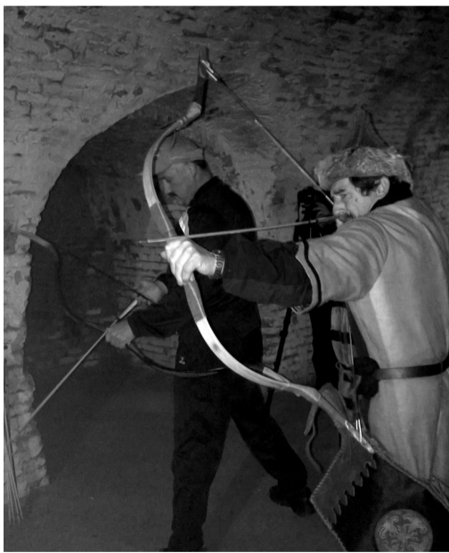
Edzés a Stubenberg-kastély pinceaalagútjában

– A tagok közül én vagyok a legidősebb, viccesen szoktam mondani, hogy ha a Jóisten is megsegít, jövő évben már hetvenkedek és ez a versenyeken is érdekes fordulatokat hoz néha. Ha helyesen határozák meg a korcsoportokat, én az úgynevezett senior master kategóriába szoktam kerülni, ami az 55 év fölötti korosztályt jelenti. Ebben a kategóriában már nem sokan versenyeznek, így általában dobogós helyet szerzek, de ha úgy adódik, azért a fiatalok közt sem vallok ám szégyent.