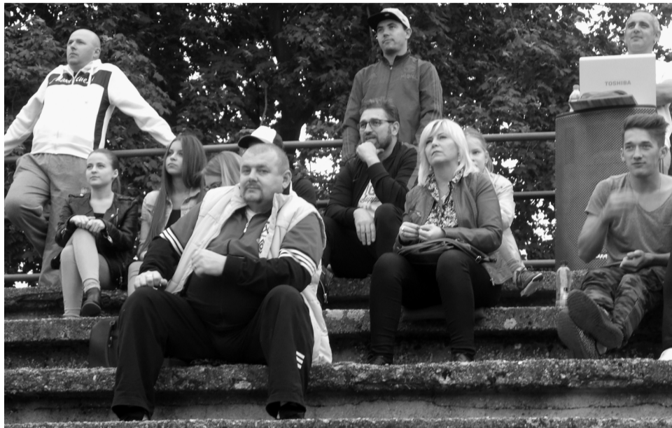
A hölgyek körében is népszerű a Töri

Elérkeztünk ahhoz a mérkőzéshez, amelyikkel minden csapat kicsit többet foglalkozik. Történt ugyanis a megyei labdarúgás életében egy és más. Köztudott, hogy az 1944-ben (első vidéki csapatként) a