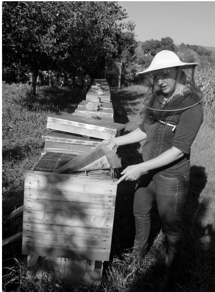
Az egerek ellen csapdával védik a méheket a gondos gazdák

Sokáig nem is gondoltak arra, hogy pályázati úton próbáljanak fejleszteni, de látva, hogy több ismerősük is jelentős támo-