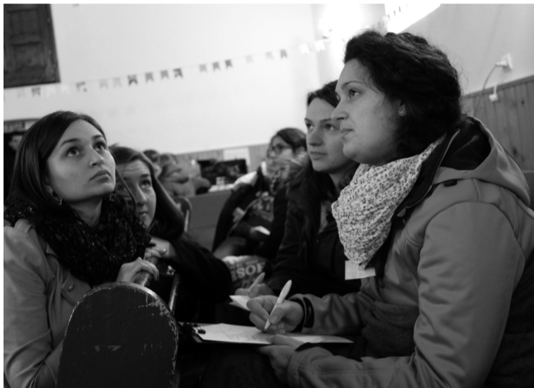
A helyes válaszokon gondolkodnak a magyarkéciak

Már kora reggel szorgoskodtak a gyülekezetnél segédkezők, kávéval, üdítővel, süteménnyel várták az érkezőket. A hosszú út után jól esett egy kicsit felfrissülni, falatozni, hiszen nemcsak a környékről, de távolabbi megyékből is érkeztek a vetélkedő kerületi döntőjére. A Királyhágómelléki Református Egyházkerület novemberben tizedszerre szervezte meg a fiatalok bibliaismereti megmérettetését. A döntőt megelőzően az egyházkerülethez tartozó kilenc egyházmegyében előselejtezőt tartottak. Az első helyezett csapatok vehettek részt a Nagykágyán megtartott döntőn. Mindegyik csoport négy tagból állt, a kilenc egyházmegye képviselőiben érkeztek mellett az előző évi győztesek, vagyis a magyarkéci is részt vehettek a vetélkedőn. A helyszín kiválasztása felajánlás alapján történik, ezúttal a nagykágyai egyházközség lépett, Bán Alpár lelkipásztoruk – aki az érmelléki egyházmegye ifjúsági