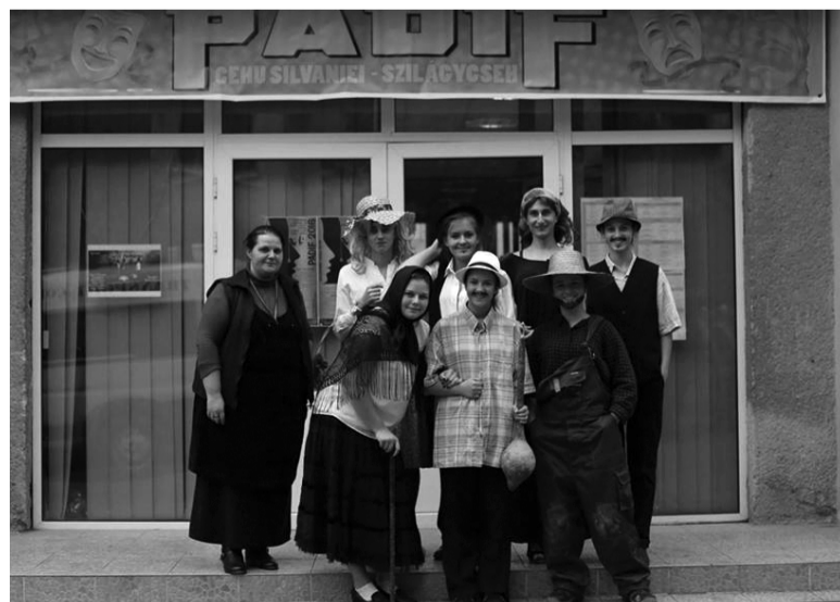
Diákszínjátsoink a Lopótök, avagy a Mari nem olyan szereplőként

rendezvények keretében. A 2016–2017-es tanévi változást hozott számukra. Nemcsak a felújított iskolára gondolunk ez esetben, hanem a színjátso csoport tevékenységére is.