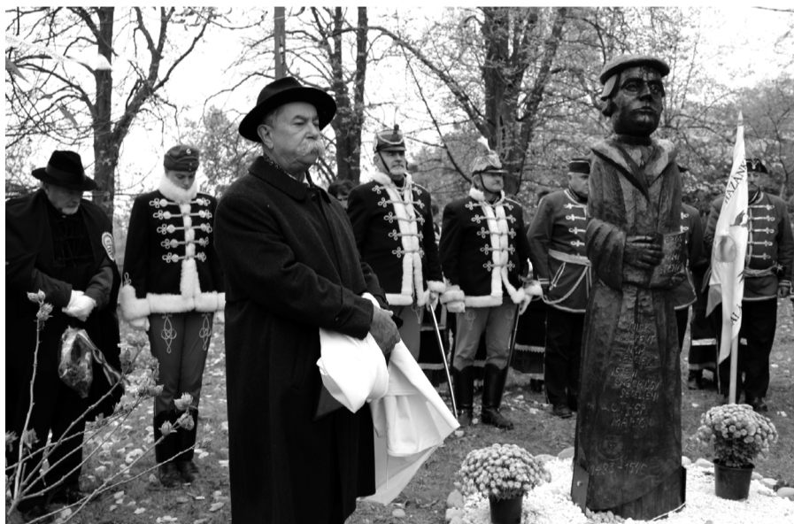
Az alkotás megálmódója buszárdiszőrséggel a Luther-szobor mellett