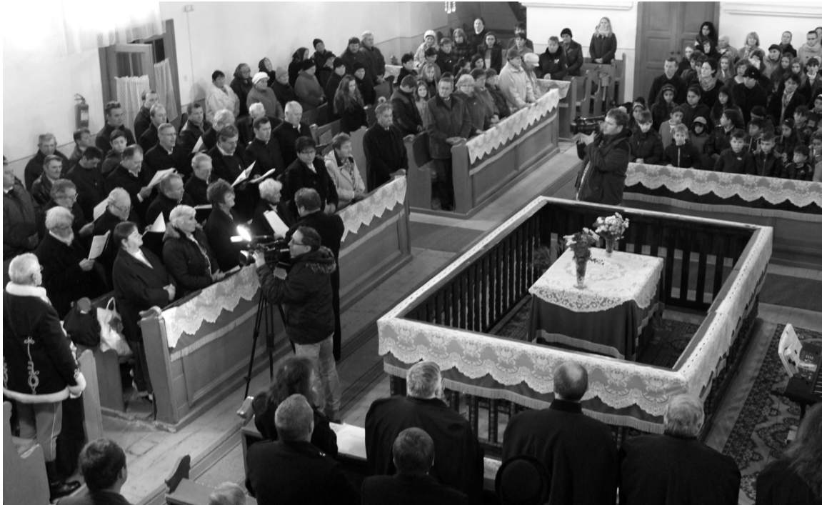
Megtelt ünneplökkel az istenbáza, kórusok éneke zengett