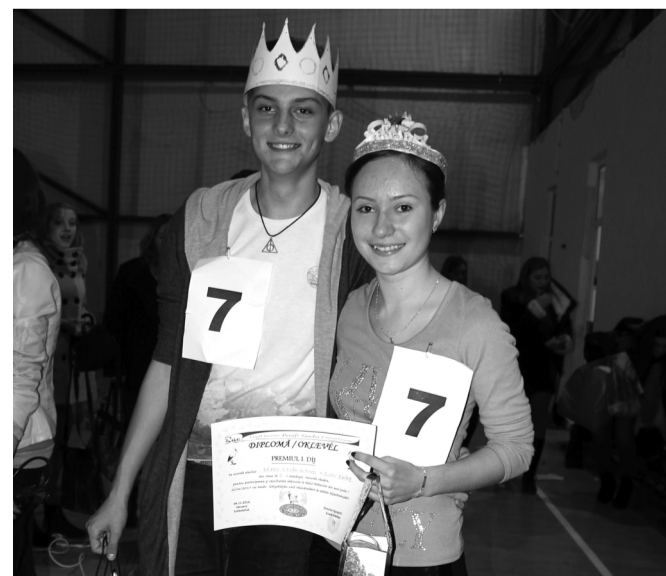
A nyertes gólyapár királyi díszben a kamera előtt