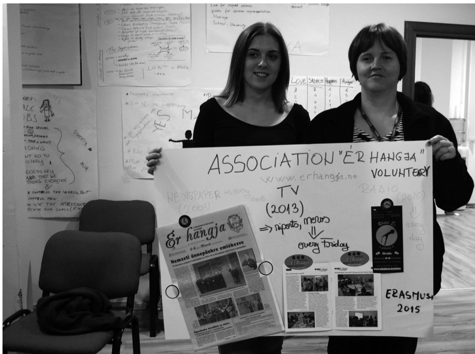
Az albániai képzésen lapunkat, a Rádió Ért és az Ér Tv-t is bemutatták