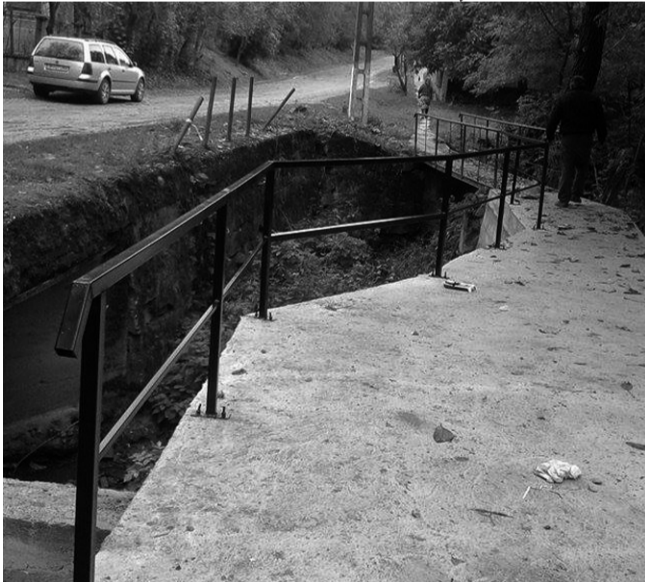
Akár egy tankot is elbírna a betonhid Érköbölkúton