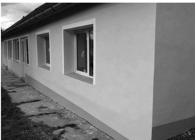
Az érköbölkúti iskola megszépült az új tanúvre