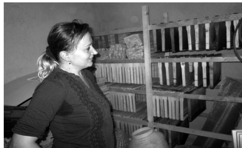
A méhészeti eszközök tárolójában polcokon sorjáznak a lépkerekek

A komoly méhészek tagjai a méhészek szövetségének, ahol nyilvántartásba veszik az állományt, minden kaptárra számozott beazonosító táblácska kerül. A méhész adataival, elérhetőség feltüntetésével, az állomány nagyságát megjelölő táblát kötelesek kihelyezni, amikor méhlegelőre szállítják a bogarakat. Az utaztatást engedélyeznie kell a méhészek szövetségének, valamint a szorgalmas kis „munkásoknak” naprakész egészségügyi könyvvel is kell rendelkezniük – ismerteti az ad-