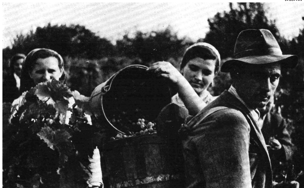
Puttonyba töltögetve legények hordják a szőlőt pincemélybe

A termesztés kezdetén erdőirtásokkal nyertek telepítési területet