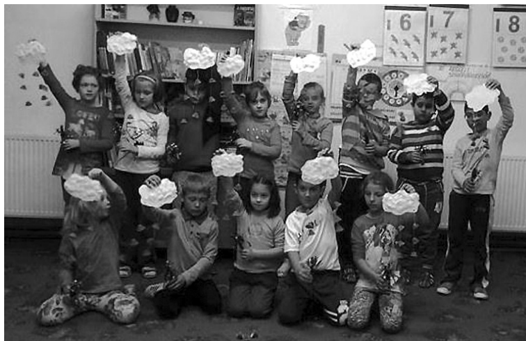
A székekybídi I. C osztályosok felhőcskéikkel integetnek Kópénak