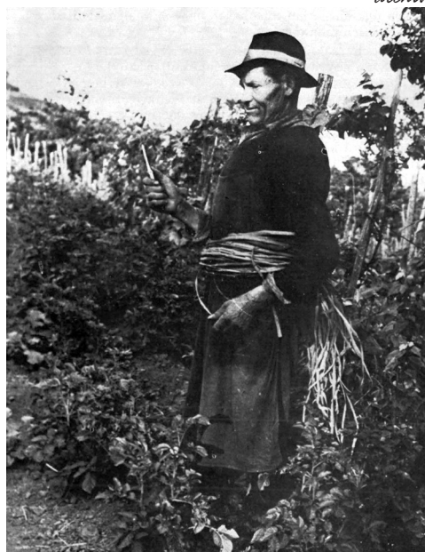
Szőlőkötő munkás, derekán kákakötelekkel

rülök mellé, a tolvajlások megelőzésére. A szüret megkezdése sem történhetett önkényesen. Előre meghatározták a szüretkezés dátumát is, ha valaki nem vetette magát alá a döntésnek, megbírságotlák. A korai szüretelést csak alapos indok alapján hagyták jóvá, ha betegség, rothadás támadta meg a termést. Ezek az öröklött és egyben szigorú rendelkezések a rendet, a kibontakozást, bizonyos önfomálód mércéhez való igazodást szolgálták. A közös adókból biztosították a termés védelmét, amellyel fejlesztésekre is futotta. Közös présházakat, eszközöket vásároltak, kutakat fúrtak, ami a permetezést, edények tisztítását könnyítette meg.