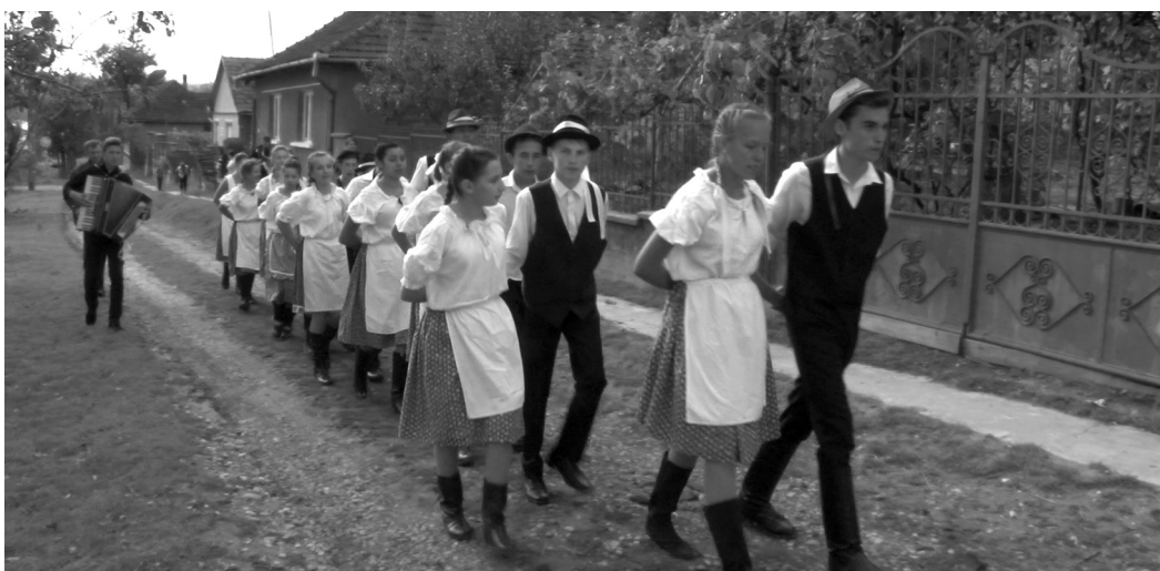
Az esti bál előtt hívogatni indultak a fiatalok, nótázva, muzsikaszó kísérettel