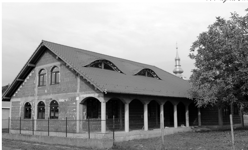
Nemsokára elkészül az érmelléki egyházmegye esperesi hivatalának székhelye

Az elmúlt öt év tevékenységének látható és láthatatlan jelei, eredményei vannak. Székelyhídon a parókiát kívül-belül felújították, amelynek keretében tetőcsere is történt. Felújították a gyülekezeti termet, emléktáblát avattak városunk szülőltje, Tofeus Dobos Mihály püspök (1624–1684) emlékére, parkosították a templomkertet. Antal József néhai magyar miniszterelnöknek mellszobrot állítottak, a műemlék orgonát felújították, a székelyhídi vár makettjének új verziója elkészült és egy szoci-