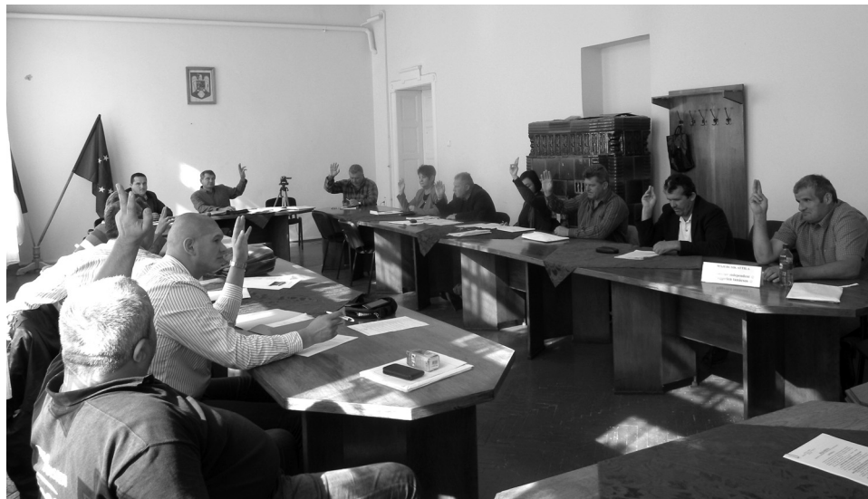
A jól előkészített határozattervezetekre szinte mindig egységesen szavazott a tanács

A következő napirendi pont tárgya egy 400 négyzetméteres terület árverés útján