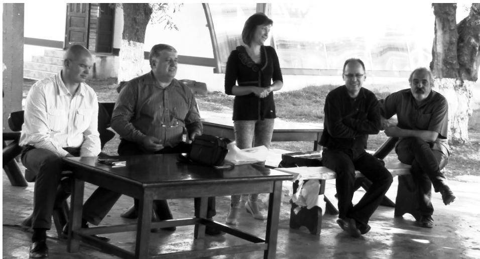
A pedagógusok számára biztató tény, hogy 2016–2017-es tanévben az Érmelléken nem csökkent a magyarul tanuló alsó tagozatosok száma

A viszontlátás öröme után, a megbeszélés első részében a körvezető üdvözölte kollégáit az új tanév kezdetének alkalmából, köszöntötte az elmúlt tanév során magasabb didaktikai fokozatot szerzőket, valamint az új tagokat. Ezután ismertette a 2016–2017-es tanévben életbe lépő minisztériumi rendeleteket, utasításokat: a tanév szerkezetét, a tanévben érvényes kerettantervet, tanmeneteket, tankönyve-