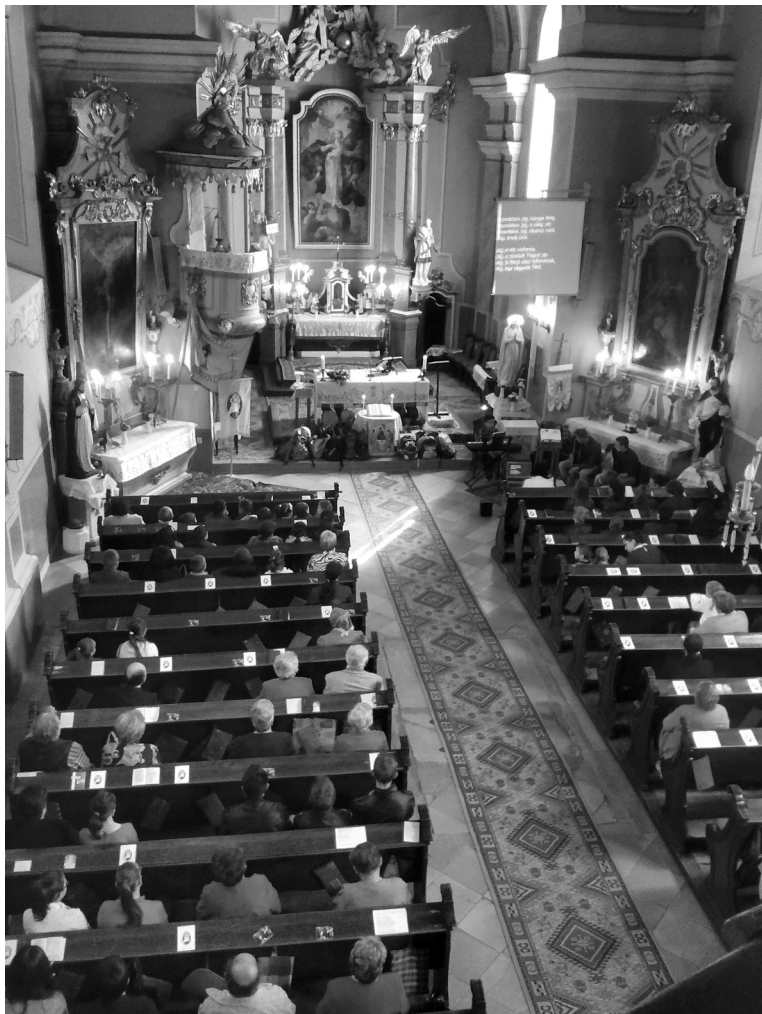
A diákok mellett sok-sok hívő volt jelen a tanévnyitó szentmisén

A szentmise kezdete előtt minden gyermek elhelyezte az oltár előtt az iskolatáskáját, ami egyik szerves részét képezte az ünnepélynek. A szentmisén a helyi ifjúsági énekkar szolgált, gitár- és zongorakísérettel, énekekkel gazdagítva az ünnepet. Az evangéliumot Szent Lukács könyvéből (Lk 16,19–31) olvasta fel Ozsváth József plébános, majd utána egy nem igazán megszokott dolog történt.