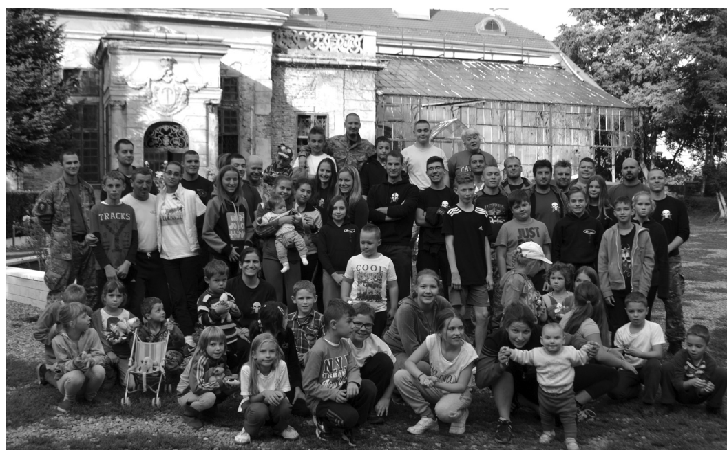
Az edzőtábor magyarországi résztvevői a gyermekotthon lakóival a Stubenberg-kastély udvarán