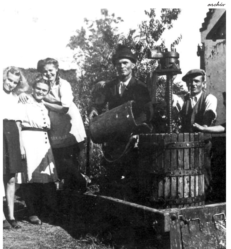
1940-es bagaméri szüret: a jó kedv, a nótás hangulat sem hiányzott

A diószegi bortermelés a XIX. századra a legjelentősebbé válik a térségben, főként Zichy Ferencnek köszönhetően. A gróf, aki az 1820-as években Bihar megye főispánja volt, felismerve a borpiac adta lehetőségeket, 102 hektáros szőlőgazdaságot hozott létre Diószegen. Az izléses címkével ellátott palackok messze földre vitték az érmelléki borok hírét. 1871-ben például a kínai császár két-száz üveg aszúborot rendelt a diószegi borászattól. A település borhoz való kötődését mi sem bizonyítja jobban, mint hogy az országban itt indult be elsőként vincellériskola 1870-ben. Röpke húsz év alatt közel négyszáz szakembert képeztek ki. A diákokat állami költségen tanították, ingyenes ellátásban részesültek, sőt iskolai egyenruhát is kaptak. Az egyre kiteljesedőbb, virágzó szőlőkultúrát a dühöngő filoxéra törte derékba. A betegséget először 1884. augusztus 14-én észlelték a kágyai szőlőhegyen. Röpke tíz év alatt az Érmellék szőlőbirtalma teljesen kipusztult. Az elszáradt tőkétet tűzre vetették, az épületek magányosan árvál-