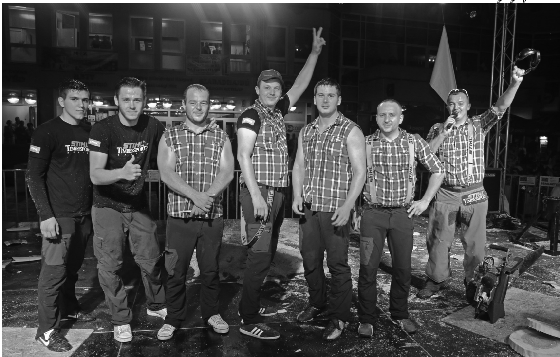
Sportfavágóink a kitarító munkának, a sok edzésnek köszönhetően eredményes évet zártak

– Mi a helyzet az utánpótláscsapattal, van-e tartalék?