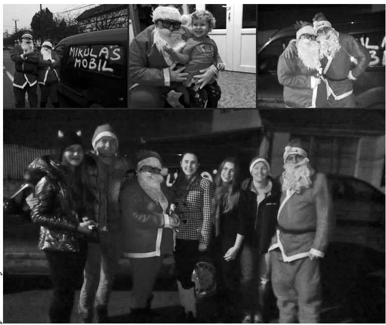
A Mikulás és segítői sok gyermeknek szereztek örömet