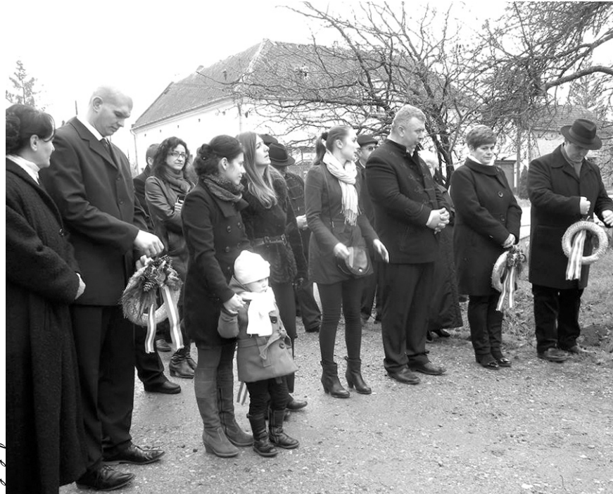
Szép számban emlékeztek a költő 138. születésnapjára

A megemlékezés a Himnusz eléneklésével zárult.