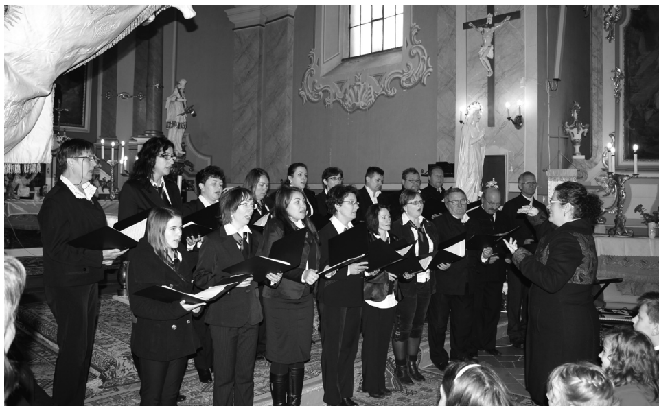
A házigazda szeplőtelen fogantatás plébánia kórusa

Tizennégy egyházzenei kórus énekelt a székelyhídi római katolikus templomban