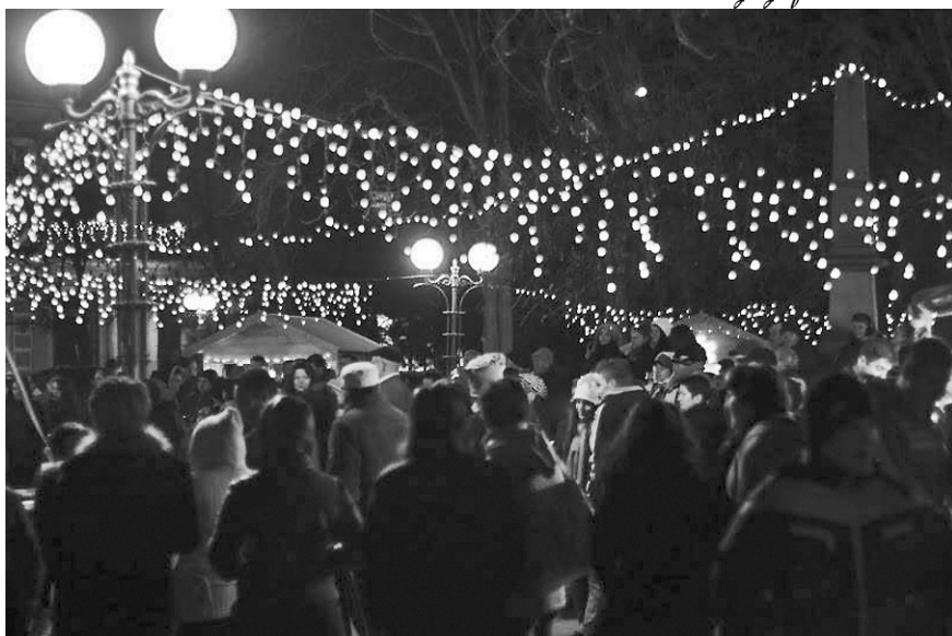
Ünnepi fények ragyogják be a vásári sokadalmat

Ünnepélyes keretek között köszöntötték az ötven éve Székely-