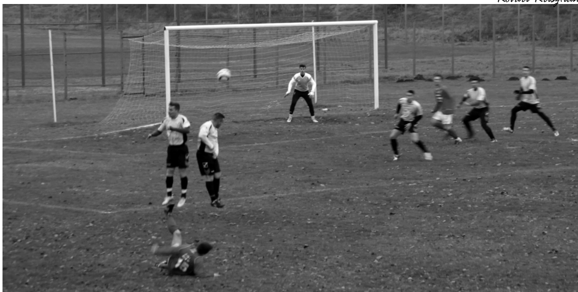
Sok szép helyzetet értékesítettek a Törekvés labdarúgói

Idegenben mindig nehéz, bárki is legyen az ellenfél. Ilyenkor – főleg a megyei foci-