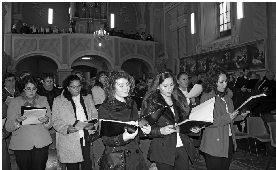
A jelen lévő mintegy kétszáz főből formálódott egyesített kórus

Alig csengtek le a XI. Érmelléki kórustalálkozó utómunkálatai, a dallamot, zenét, kóruséneket kedvelők november 21-én a székelyhídi római katolikus templomban találhatták magukat a IV. egyházmegyei kórustalálkozón. A Szeplőtelen fogantatás plébániára tizennégy kórus érkezett az egyházmegye minden szegletéből, hogy énekeikkel az Jóistent dicsőítsék.