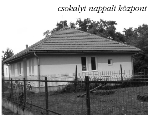
csokalyi nappali központ