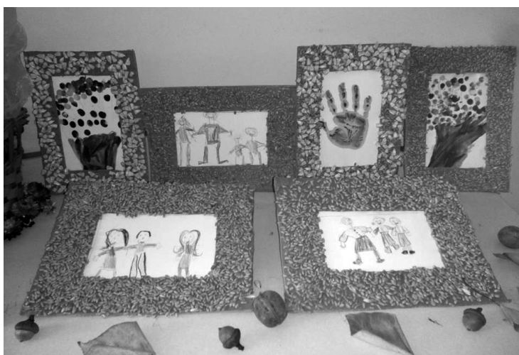
Igen figyelemre méltó munkák születtek