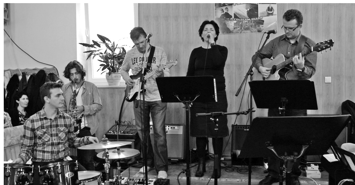
Igényes dallamok, énekek csendültek fel az Úr dicsőítésére