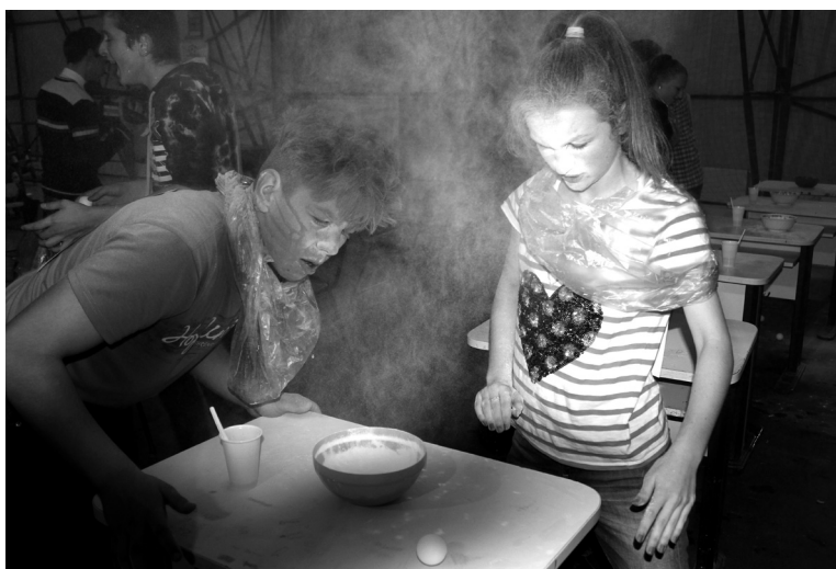
Méz- és lisztpakolás a gólyák arcán

Ugyanez a „szívatósi ceremónia” folytatódott a nagyközönség előtt is a pénteki gólyabálon. Ekkor a nyolc kiválasztott gólyapár bátorságát, kreativitását és nem utolsósorban gyomrát tették próbára a szervezők. A próbatételeknek széles volt a tárhá-