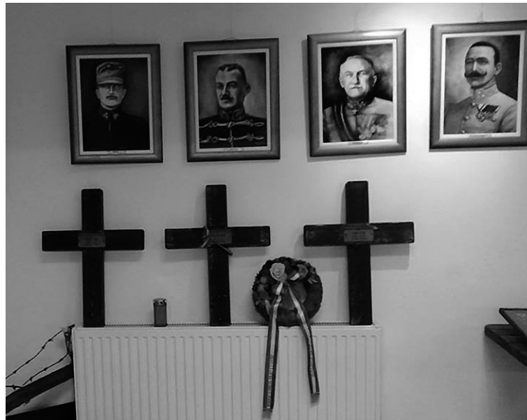
Első világháborús relikviákat láthattunk a Bakasors kiállításon

„A sírban nincsenek győztesek és vesztesek, a halott katonák, bármely nemzet fia is, nem ellenség, kijár neki a megemlékezés, a végtisztesség. Az eltemetett katonák öröksége arra int, hogy nem szabad teret engedni a különböző szélsőséges erőknek, mert a béke mindenképpen felett a legdrágább kincs.” (ismeretlen)