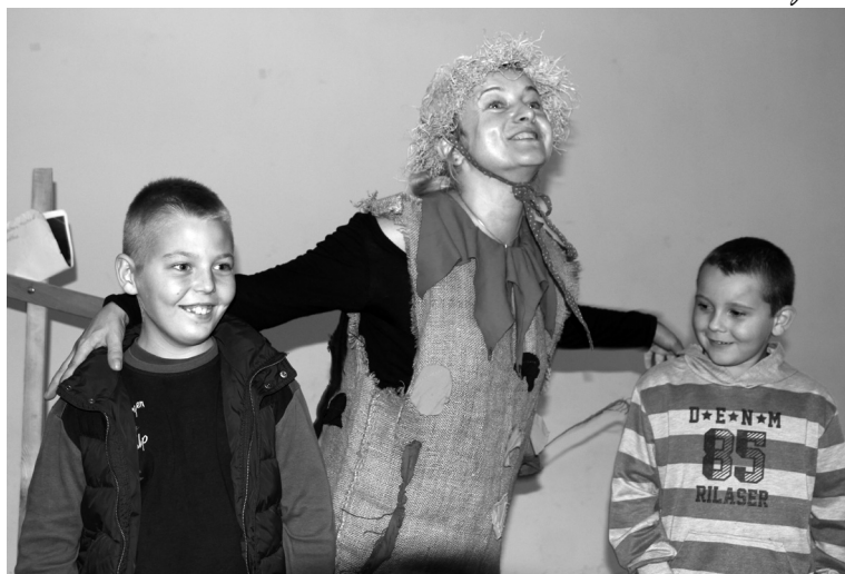
Az elképesztő madárijesztő és barátai

A színésznő tudatosan kevés díszletet használ. A jelmez s a különböző apró kellékek tárháza mellett leginkább saját hangjával, előadásmódjaival és testével jeleníti meg a közös mese karaktereit, teret engedve ezzel a határta-