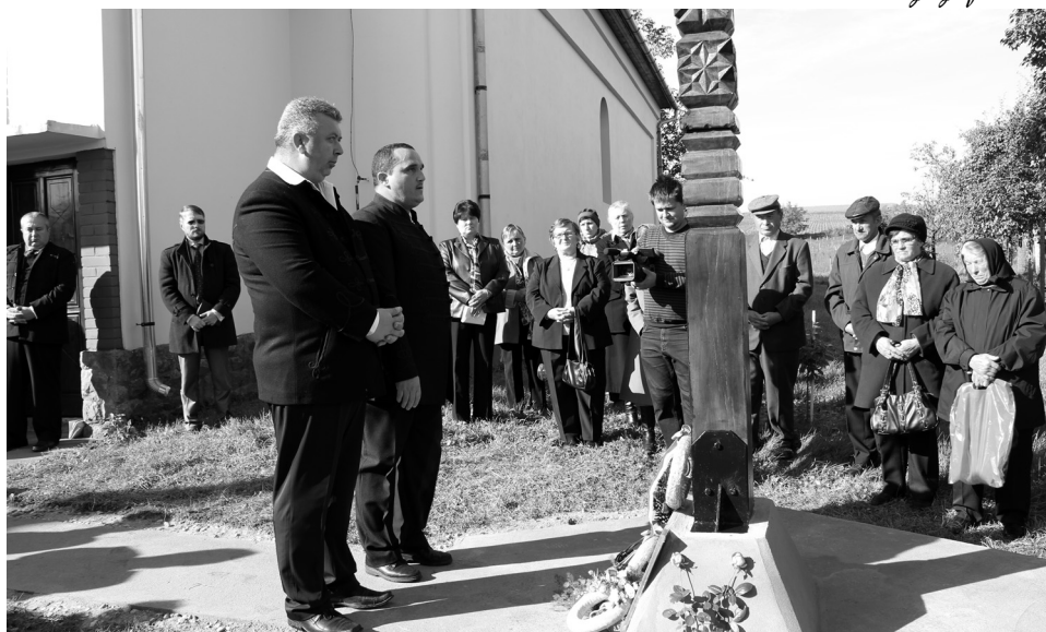
A városvezetők tisztelegnek az elesettek emléke előtt

„Ma egy olyan század kezdetén vagyunk, amikor építhetünk. Amikor