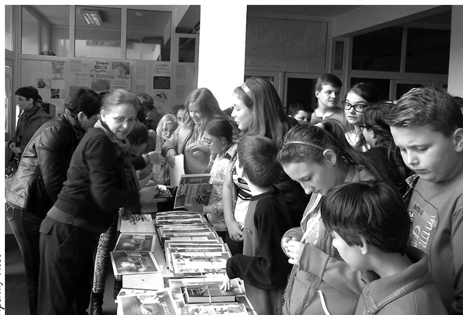
Értékes könyvjutalmakkal gazdagodtak a lepkevadászok

Elszállt a nyár, elszálltak a lepkék, lezárult a Székelyhídi Városi Könyvtár újabb nagy nyári lepkevadászati versenye. Sikertől messze „túlszárnyalni” a tavalyi eredményeket: kerekén 300 lepkét gyűjtöttek az olvasó gyerekek! Ez annak is köszönhető, hogy ezen a nyáron a lepkevadászok száma is nőtt. Idén negyven résztvevő gyűjtötte a lepkéket, vagyis olvasta szorgalmasan a könyveket (az elmúlt évben harminc). Hogy mit olvastak ilyen szorgalmasan a gyerekek? Most is a kortárs gyermek és ifjúsági könyvek voltak a legnépszerűbbek, olyannyira, hogy az első helyezettek 15-16 könyvet is elolvastak a vakációban.