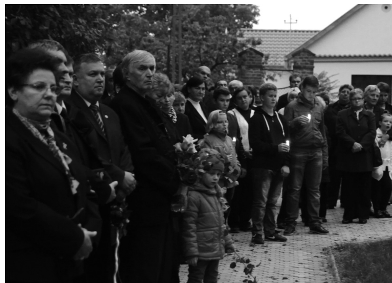
Idősek és gyermekek együtt emlékeztek az aradi tizenhárom tábornokra

Október 6-án este az aradi vértanúk mártírhalálának 166. évfordulójára emlékeztek Székelyhídon a helyi református templomnál.