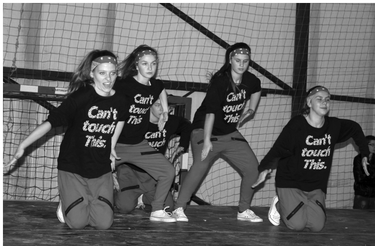
Az Enemy Dance dinamikus lányai