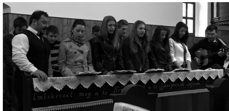
Az ifjúsági kör énekekkel készült a templom születésnapjára