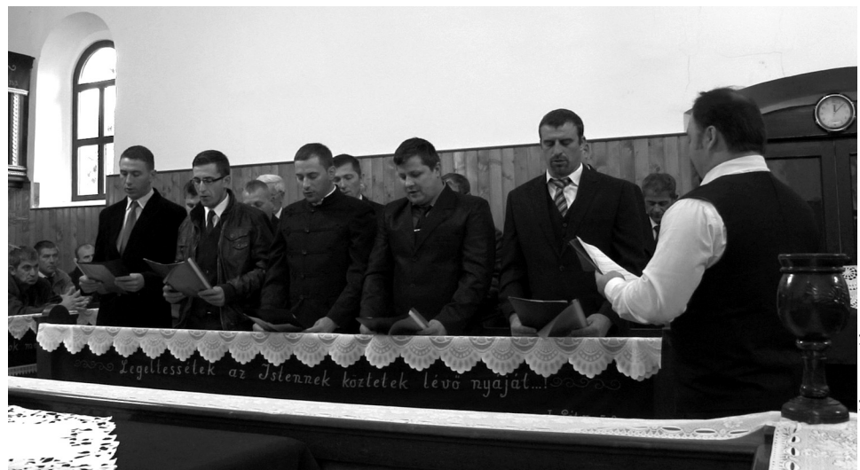
A férfikör is hozzájárult az ünnephez