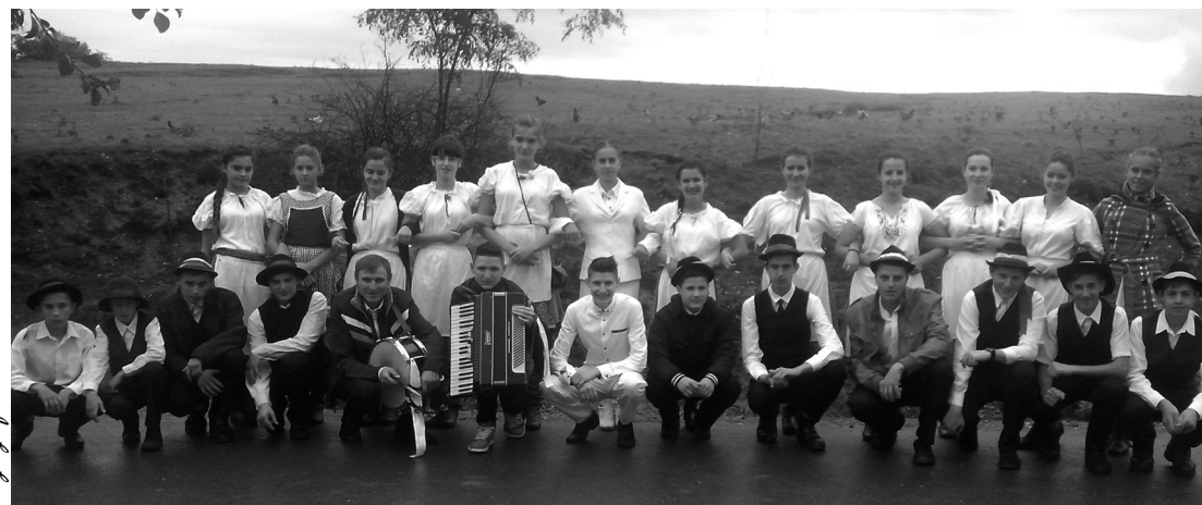
A fiatalok jókedvűen az eső sem szabhatott gátat