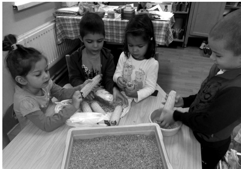
Kukoricát fejtegetni csudajóó!

A szeptemberi ős beköszöntésével a székelyhídi református napköziben is kezdetét vette az új óvodai tanév. Az első két hét az újonnan jött kiscsoportosoknak az óvodai élet megismertetésével, megszerettetésével telt, miközben próbáltuk minden téren felmérni készségeiket és képességeiket. A harmadik héten a gyerekek önmagukról, az óvodai életéről, kedvenc játékaikról, időtöltéseikről beszéltek az óvo nénikkel és a kispajtásaikkal. A negyedik hét témája „Én és a család” volt. A gyerekek bemutatták családjaikat, meséltek a szülők foglalkozásairól, a családi közös programokról, a szeretet erejéről, mely összetartja a családot. A foglalkozásokat célzatosan, úgy terveztem, hogy a gyerekek sikerélményként élhessék meg az elvégzett munkát, annak eredményét, fejlődjön szépérzékük, kerüljenek közelebb a természethez és felejtethetetlen élményt nyújtson számukra. A művészeti nevelés keretén belül kiscsoportosainkkal tényérnyomdázunk, hogy megmaradjon emlékként kis kezük lenyomata. Középcsoportosaink már megpróbálták körberajzolni kezüket nyitott ujjakkal, s mivel itt az ős, ebből őszi fát varázsoltak,