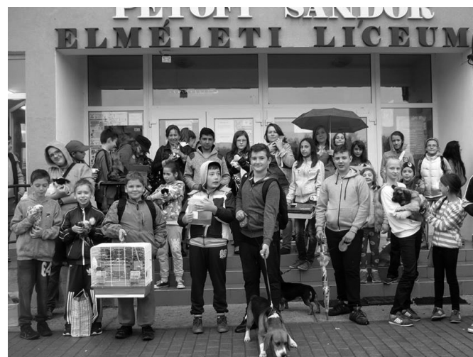
Büszkén mutogatták egymásnak a házikedvenceket

Ez év októberében is megemlékeztek az állatok világnapjáról a Petőfi Sándor Elméleti Líceum tanárai és diákjai, melyet hagyományosan október 4-én tartanak világszerte. A jeles dátum előírja a kedvencek kényeztetését és az a felett érzett öröm kifejezését, hogy bennük valóban hűséges és hálás barátokra lel az ember.