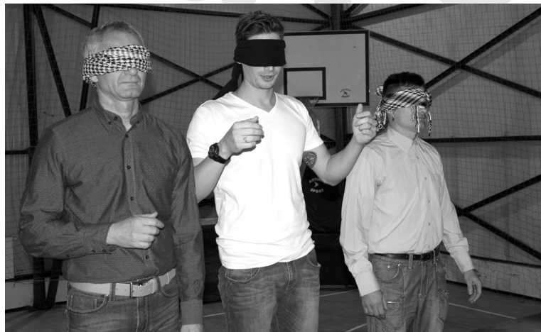
Próbára tett szemellenzős zsűritagok botorkálnak a színpadon