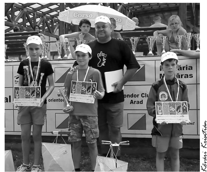
A legfiatalabbak is jól tájékozódtak az erdőben

A rendezés főszerepét a madarászi Tájfutó Sportklub vállalta magára, a versenybizottság elnöke maga Perje Csaba Oskar volt. Pénteken Madarász Kupa néven az egyéni, rövidtávú sprintversenyt rendezték, szombaton Varadinum