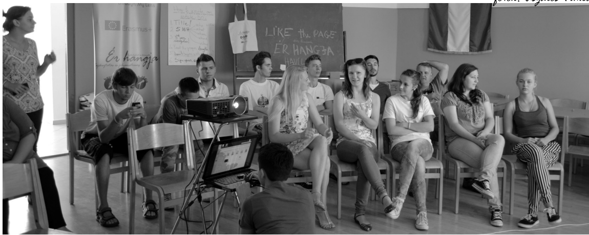
Zajlik a közös bemutató a szociálisan hátrányos helyzetű csoportokról

A hatnapos ifjúsági csereprogramra három országból, Magyarországról, Szlovákiából és Romániából érkezett nyolc-nyolc jelenleg is munkát kereső fiatal, akik az elektronikus és írott sajtó alapjaival, emellett kamerahasználattal, filmvágással, szerkesztéssel ismerkedhettek. A szervezők a projektnek az Európai társadalmi körkép a mi lencsénken keresztül címet adták, mert olyan helyi jellegű problémákat, kérdésköröket célzott meg, mint a szegénység és a halmozottan hátrányos helyzetű fiatalok ellen irányuló diszkrimináció, mindezt az európai és világszintű fiatalkori munkanélküliségi mutatókon át. A csereprogramnak a székelyhídi református egyházközség ifjúsági háza adott otthont.