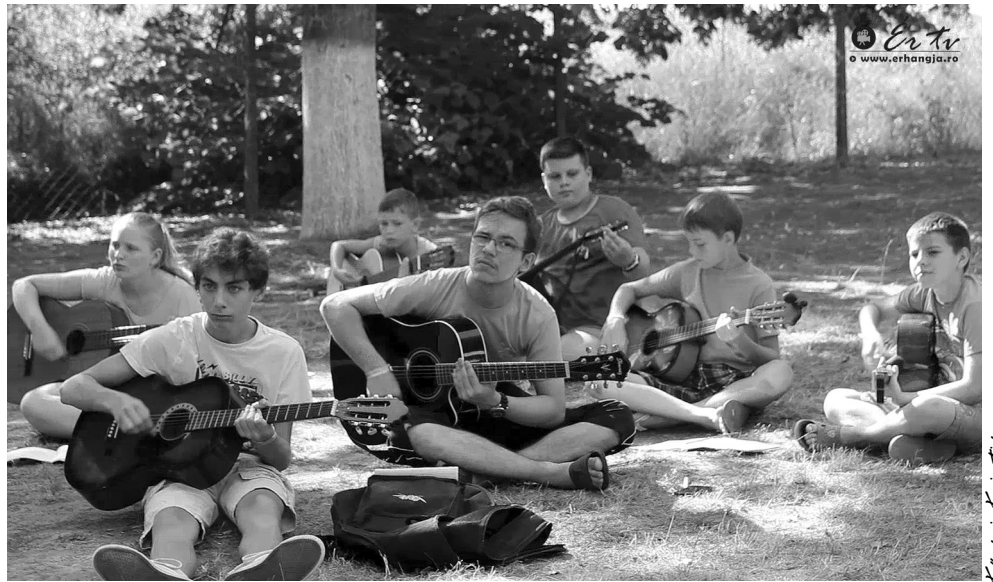
Jól ment a fűben való gitározás