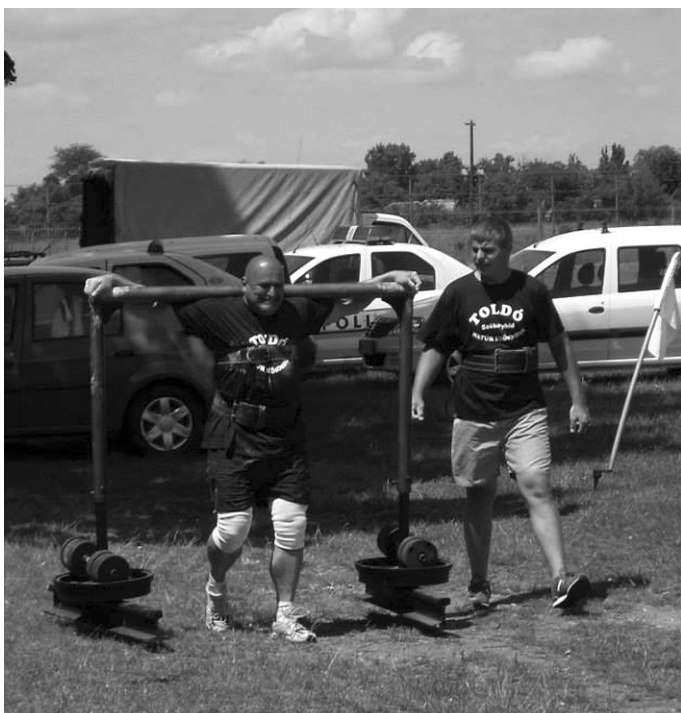
Egy ilyen gyakorlat végrehajtása több éves kemény edzés eredménye