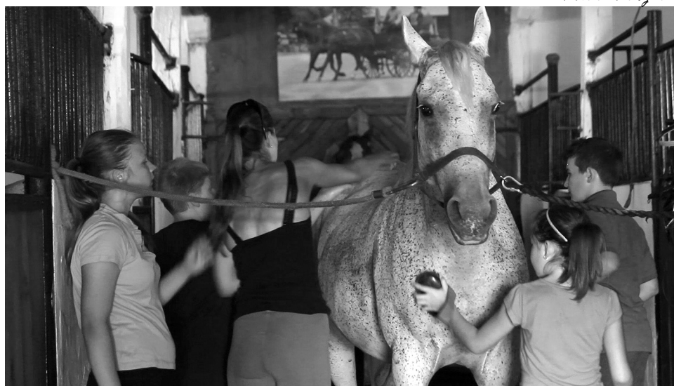
A táborban a gyermekek szívesen ápolgatták a lovakat

A tábor hete alatt a gyermekek nemcsak a lovaglás alapjait sajátíthatták el, hanem betekintést nyerhettek a loápolás rejtelmeibe is, megismerkedhettek a különböző eszközökkel, megtanultak figyelni a ló által adott jelzésekre. Azáltal érezték igazán lovasnak magukat, hogy megtanulták fel-