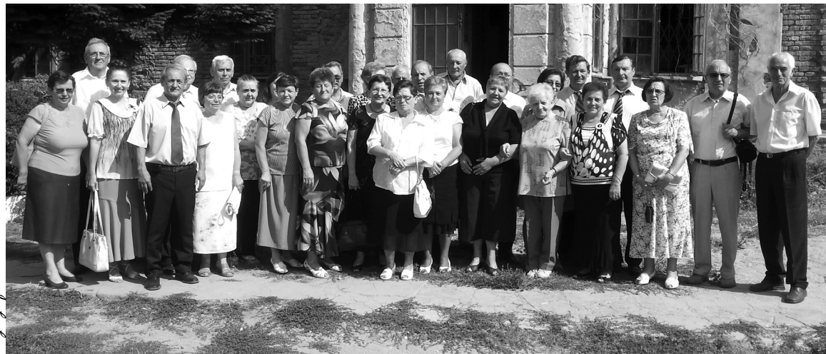
Szép számmal gyűltek össze az egykori osztálytársak