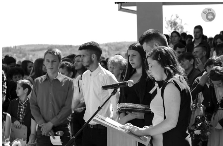
Az iskola jelképes kulcsát jókívánságokkal együtt adták át