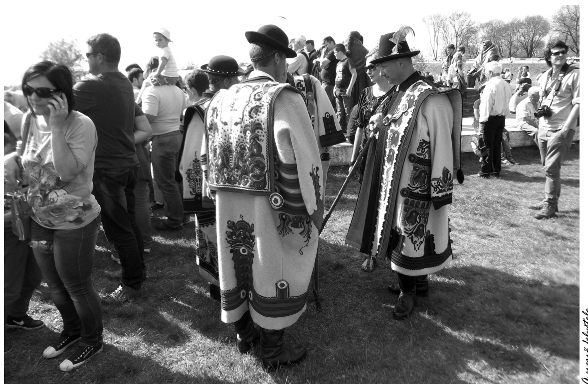
Igazi hagyományörző forgatag a kihajtás ünnepén

De honnan is ered a kihajtásünnep? A pásztorételek a tavasz kezdetét Szent György napjától, április 24-től számítják. Ekkor hajtják ki a jóságokat a téli szálláshelyekről, ekkor fogadják meg a pásztorokat, béreseket. Sok babona és népszokás kapcsolódik ehhez a naphoz: mágius, rontáselhárító szerepet tulajdonítottak annak a vesszőnek,