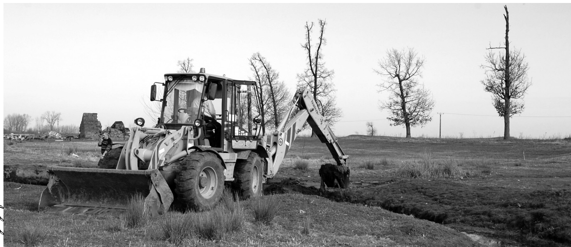
A városi felületen

Folyamatosan tart Székelyhídon az a tavaszi takarítási akció, amely márciusban a vasútállomáson kezdődött.