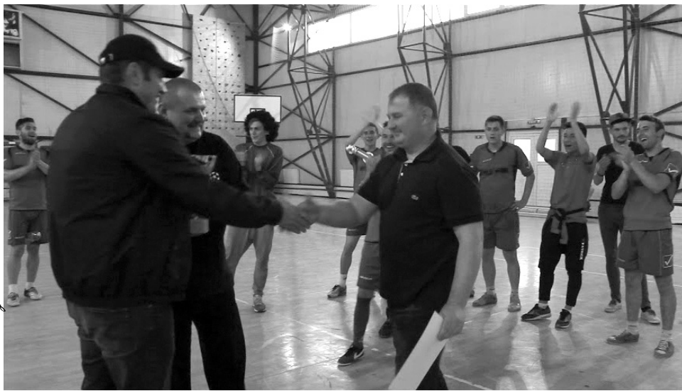
A szervezők átadják a csapatoknak a megérdemelt kupákat és okleveleket

A sorsolás szeszélyének is köszönhetően Kereki hamar kiszállt az érmekért folyó versenyből, előbb az Interstecstől, majd Diószegtől is elég komoly verést kaptak, a végén nemhogy a dobogóra nem értek fel, meg kellett elégedniük az ötödik helyvel. Az már az elején látszott, hogy az újonc váradi Ifiakkal komolyan számolni kell, csak Csokalytól és Diószegtől kaptak ki, megérdemelten lettek harmadikok. Ami a két nagy esélyest, az Interstecset és a Wild Hawkot illeti, semmit nem bíztak a véletlenre, az utolsó fordulóra – az egymás elleni meccsre – mindketten százszázalékosan érkeztek. A végén a tavalyi évhez hasonlóan most is a diószegiei örülhettek, egy nagyon látványos és gólokban gazdag