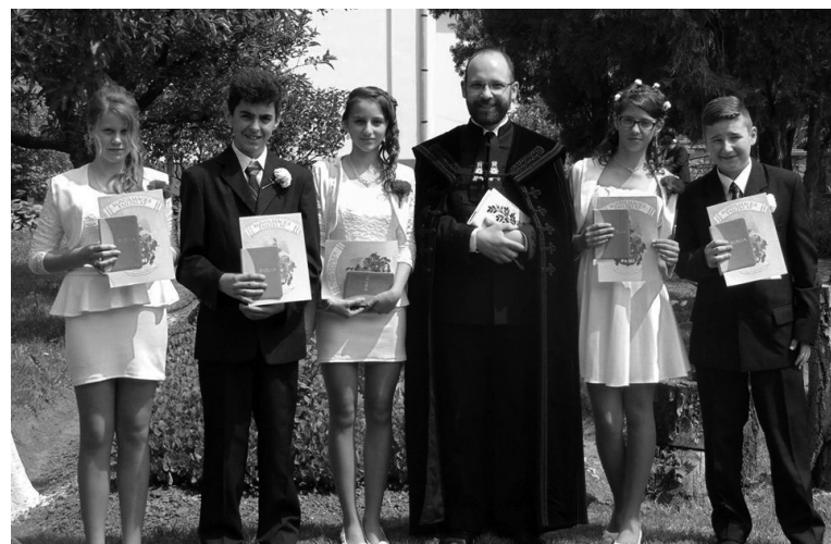
A nagykágyai református egyházközségben öt fiatal tett tanúbizonyosságot hitéről a gyülekezet előtt