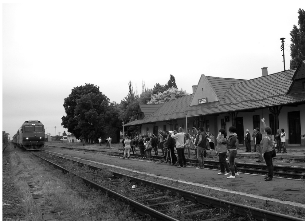
Érkezik a csíksomlyói búcsúra igyekvő zarándokokat szállító szerelvény

A csíksomlyói búcsúra robogó, székely gyorsból és csíksomlyói expresszből egyesített, 14 vagonból álló zarándokvonat május 22-én, pénteken háromnegyed tizenkettőkor haladt keresztül Székelyhídon.