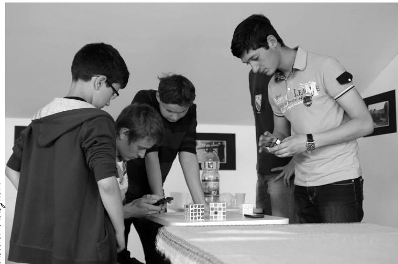
Csak fiúk vettek részt az Érmellék első Rubik-kocka versenyén