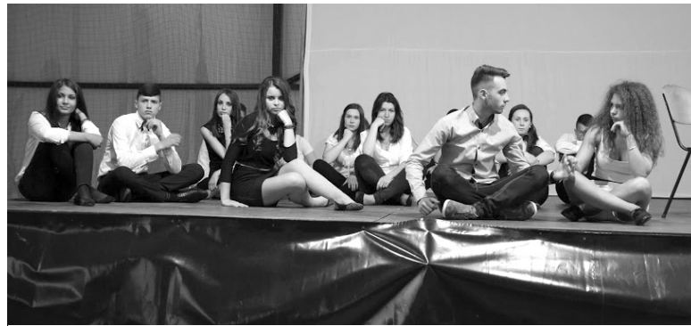
Különleges kortárs tánc-előadással is búcsúztatták a tizenegyedikesek

A XI. D előadása zárta az estét, az utolsó búcsúfilmmel. Végezetül a büszke osztályfőnökök,