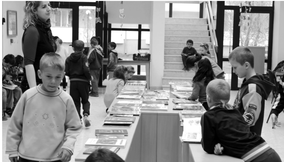
A könyvkiállítást mindig nagy érdeklődés övezi

Sokunk szívfájdalma Székelyhíd központjában az egykor szebb napokat is látott Művelődési Ház épülete. Mint tudjuk a település kulturális rendezvényeinek több éve a múzeum, a munkásklub, az iskola előadóterme ad otthont. Mondhatjuk, hogy lebonyolíthatóak ezekben az épületekben is, de azért hiányzik a színházi milió, a színpadi, színházi előadások varázsa.