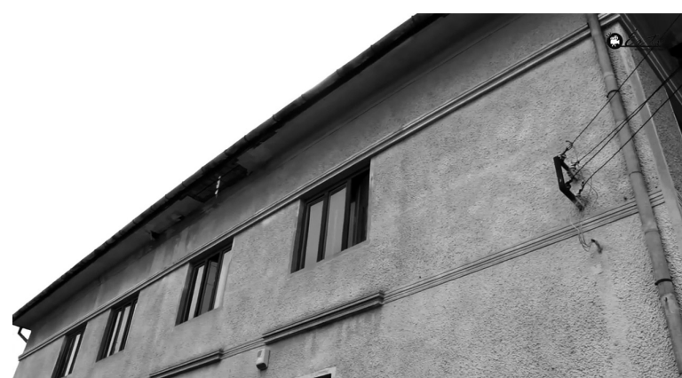
A tető is felújításra szorul

A székelyhídi városi könyvtár 2010-ben elnyerte az év könyvtára címet, mely kimondottan szakmai díj. Ezzel a Székelyhídon zajló újszerű, saját ötlete-