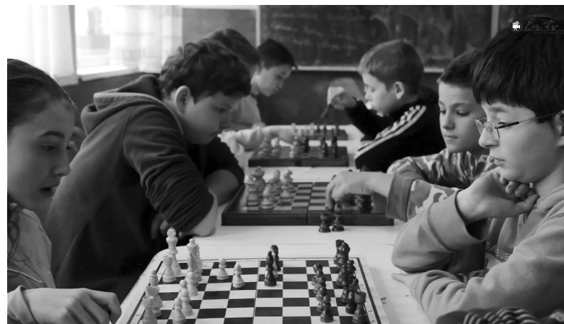
Kemény sakkmérkőzések zajlottak

ramokra csábították diákjaikat, így voltak akik ijászkodtak, lovárdába látogattak el, asztaliteniszt játszottak, könyvkiállítást tekintettek meg vagy közösségformálóként Nagyváradra látogattak kicsit kikapcsolódni.