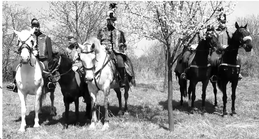
Az érköbölküti ünnepségre lóháton érkeztek a hagyományőrző huszárok

Meghívott vendégek, hagyományőrző gyalogos és lovas csoportok s ünneplő falubeliek gyülekeztek április 12-én az érköbölküti iskola udvarán, hogy a Rákóczi-émlékkünnep keretében szoboravatón, lófuttatáson, fegyverbemutatón vegyenek részt. Az ünneplőket a házigazda Rákóczi Lajos köszöntötte, aki ismertette II. Rákóczi Ferenc fejedelem életének és tevékenységének Érköbölküthöz köthető vonatkozásait.