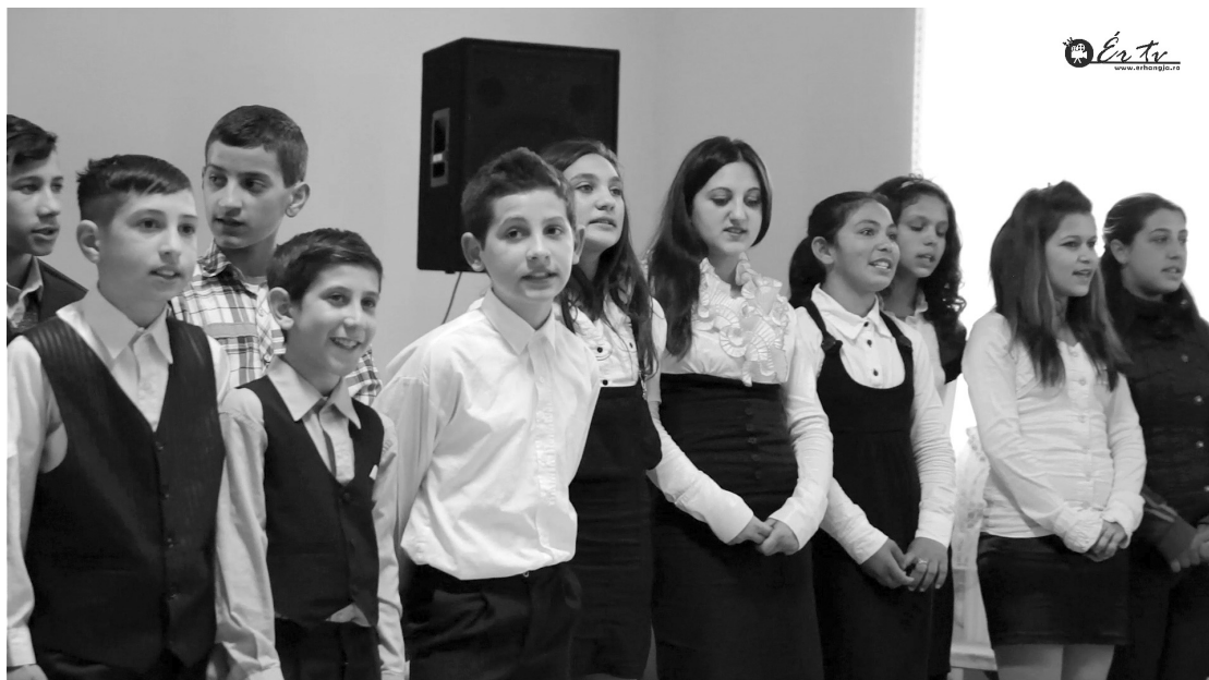
A diákok fegyvermezzetben, feladatukra koncentrálnak elő műsorukat