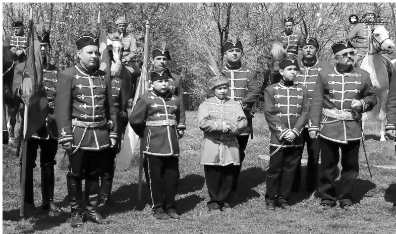
A szentimrei kurucezred tagjai is tiszteletüket tették a népünnepélyen

Hogy miért is különleges a most avatott szobor? Az ötletgazda egy élő, teljes alakos Rákóczi-szobrot akart megfaragtatni, mégpedig egy a tűzhalál miatt csonkolt gesztenyefából. Ám az eredeti ötletbe a természet beleszólt, mert a munka kezdetekor kiderült, hogy a fa belseje kikorhadt,