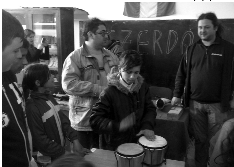
A különleges hangszereket a diákok is megszólaltatták

A hegyközszentmiklósi Toldy általános iskolában a gyerekek sokkal jobban várták az Iskola másképp elnevezésű programot, mint mi, pedagógusok. Hiszem, hogy az április 7-én kezdődő eseménysorozaton mindenki talált magának megfelelő programot, amit elraktározhat és tovább fejleszthet.