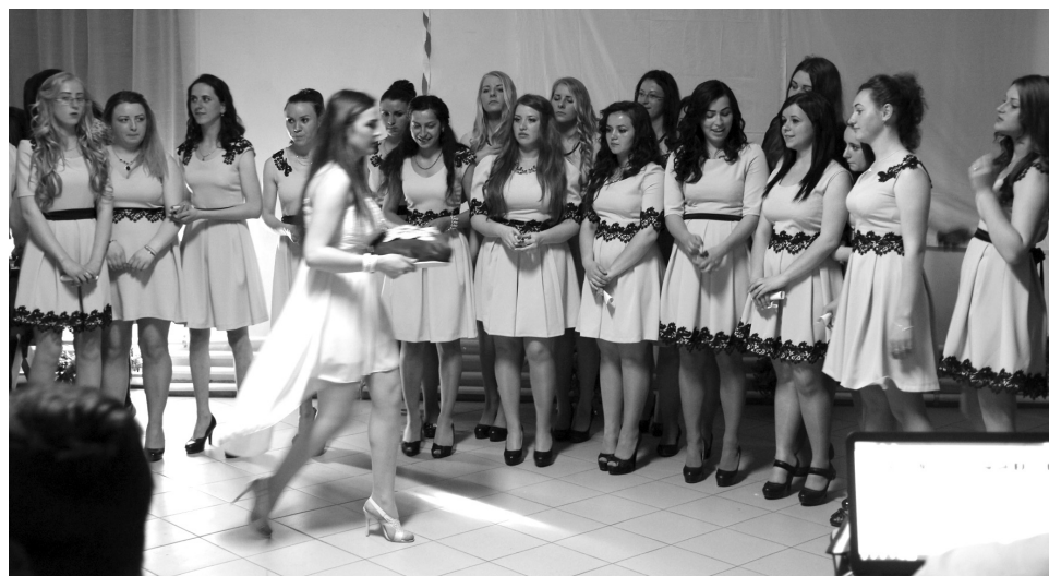
Megható pillanat a kitűzők átvételekor

A diákévek mindannyiunk számára felejthetetlen élményeket tartogatnak. Sokunk emlékezetében még évek múltán is elevenen élnek épp úgy a vidám, mint a meghitt szívdobogató pillanatok. Egy ilyen felejthetetlen élményben volt részük a nagykágyai szakiskola végzőseinek is a számukra szervezett szalagavató alkalmával.