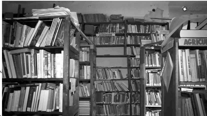
Nagyon zsúfolt a városi könyvtár