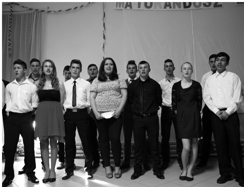
A XI. osztályosok komoly hangvételű összeállítással is készültek

Manapság az iskolai események előadásaiban a szervezők gyakran használják a technika különböző vívmányait. Ezt tették a XI. B-s fiúk is, akik egy kamera segítségével elkészítették a Hogyan lehet túlélni