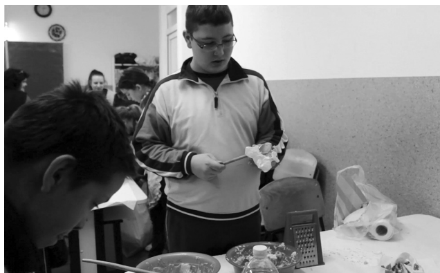
A fiúk is szívesen főzöcskéztek

A hét folyamán 60–90 perces programokat tartottak, megszervezésükből mindenki kivehette a részét. A szekelyhídi tanintézményben sokan látogatták meg a zum-