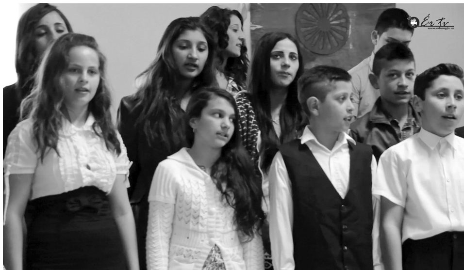
A diákok nemcsak testüket, lelküket is ünneplőbe öltöztették

Székelyhídon, mint köztudott, számottevő roma kisebbség él, és nyilvánvaló tény az is, hogy minden etnikum számára fontos az, hogy legyen évente legalább egy olyan alkalom, amikor kifejezheti az együtvé tartozás fontosságát. A romák számára ilyen nap április 8-a, a roma kulturális világnap, amelyet 1971-ben jelöltek ki egy angliai konferencia alkalmával.