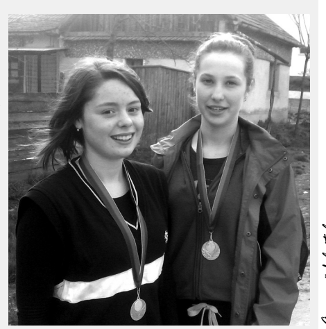
A szögő fényképe