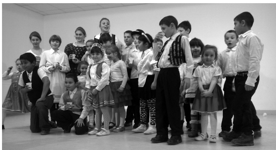
Kicsik és nagyobbak is néptáncoltak a karácsonyi bemutatkozáson

templomát, megtekintettük a sétálóutcát, a városházát és annak tetejéről a kedvenc városomat, Nagyváradot. Majd az Old Mill éttermet kerestük fel a gyerekekkel és az estére szépen kivilágított december 1. parkot (egykori Széna tér), mely ünnepre hangolta diákjainkat. Élményekben gazdag kirándulásnak voltunk részesei.