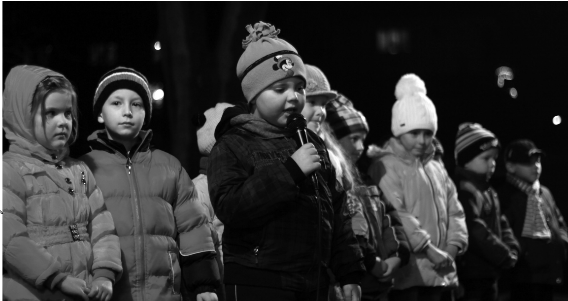
A gyermekek karácsonyi verseket, énekeket, betlehemes játékokat adtak elő a szabadtéri színpadon

A vásár idején minden este színpadi előadások voltak megtekinthetőek. Felkészítő óvónőkkel és tanítóknokkal meglátogatták a székelyhídi vásárt Csokaly, Nagykágya, Hegyközszentmiklós, Érköbölkút és Érolasz gyerekei, de természetesen helyi ovások és sulisok is szerepeltek és adtak elő karácsonyi dalokat, verseket, betlehemes játékokat. Szereplésük után minden gyerek a múzeumba érkezett, hogy forró teával melegedjen és mézes kalácsot díszítsen. Majd természetesen a Mikulás házikójába is bekukkanthattak, ahol kis ajándékok vártak rá-