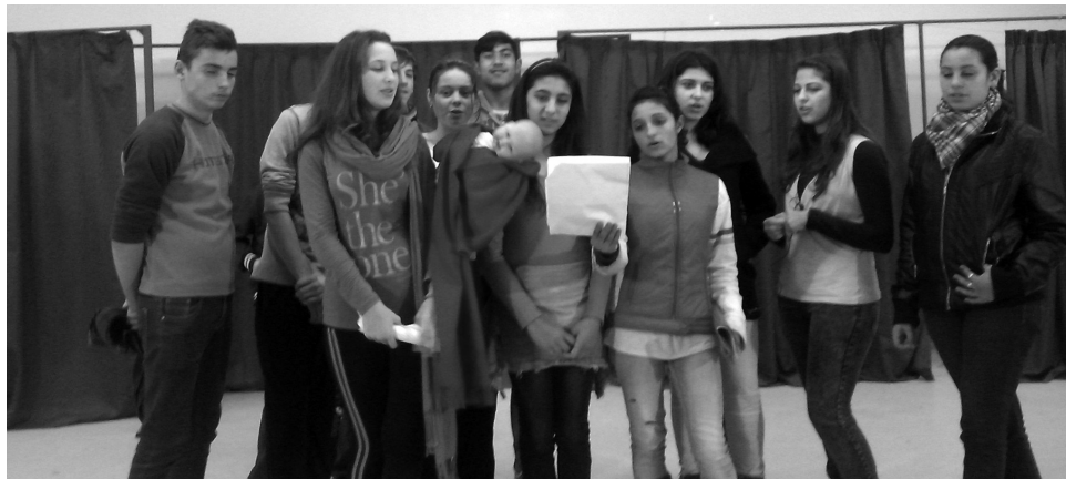
A nagyobbak betlehemes játék keretében elevenítették fel a kis Jézus születését