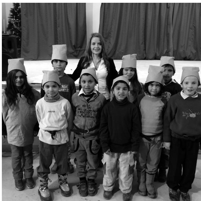
Az ünnepségen manócskákból sem volt hiány