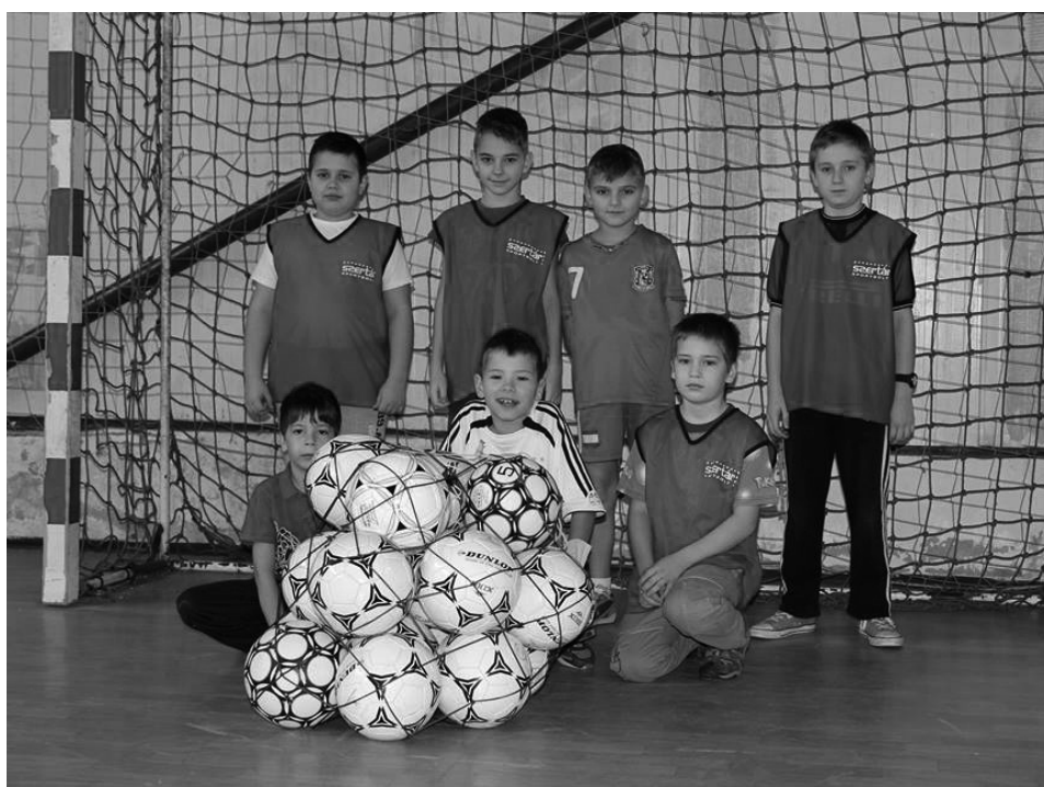
A 6-8 év közötti focisták csapata a Kirchdorf am Innból érkezett labdákkal