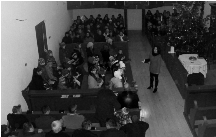
Karácsonykor megteltek az érolaszi református templom padsorai

A templom elsőrendű felújítási tervei, az anyagi korlátok miatt a legszükségesebb munkálatokra korlátozódtak. Ám amikor nekiláttak az érolaszi templom tetőbontásának kiderült, hogy mindenképpen szükséges a teljes szerkezet cseréje, mely aztán új tetőcserepezést is kapott. Csak ezután tudtak nekilátni a templom belső felújítási munkálataihoz. Az anyagiak előteremtése mindig nehéz feladat, de mint ahogy a tiszteletestől megtudtuk, hála Istennek többen is segítő kezet nyújtottak a felújításban, így egy holland gyülekezeti kapcsolat révén jelentős támoga-