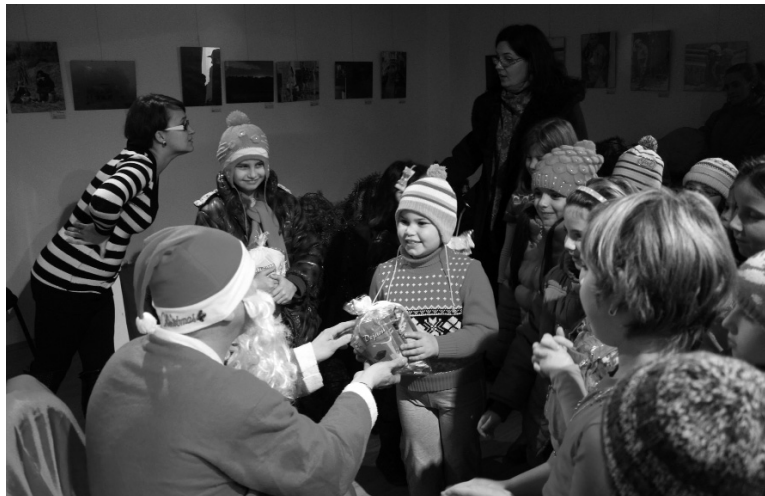
A nagyszakállú Mikulás minden gyermeknek ajándékot adott