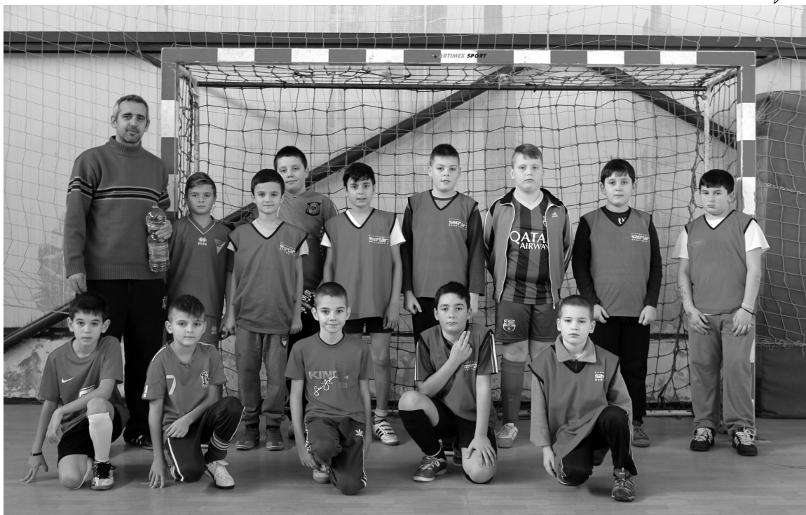
A 9-10 éves labdarúgók hősiesen helytálltak a bajnokságban

Még a téli vakáció előtt fogalmazódott meg az ötlet, hogy a fiatalok korcsoportokra osztva mérkőzzenek meg más települések csapataival. Négy csoport alakult (6–8, 9–10, 11–13 év közöttiek és 14 év felettek). Először, még decemberben a legkisebbek léptek pályára, Margitta és Szentjobb volt az ellenfél. A margittaiak 100%-os teljesítménnyel végeztek az élen, a szentjobbiakat 1-0-ra, a székelyhídiakat 3-0-ra verték. A második helyért egy nagyon változatos mérkőzést vívott a két csapat,