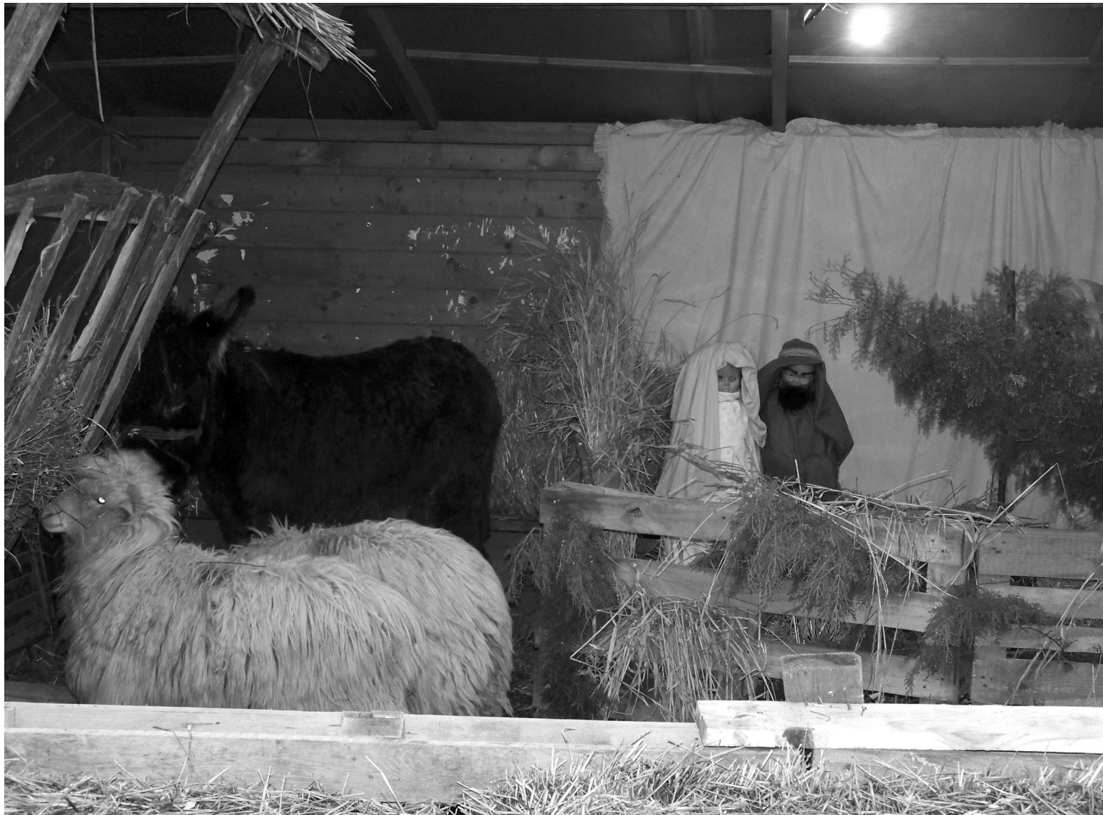
Sokak öröme idén is felépítik a betlebemet a városközpontban

Ismét ünnepi díszbe öltözik Székelyhid központja december 17. és 23. között. Az idei évben negyedik alkalommal megrendezett Karácsonyi Vásár új helyszínen, a központi parkban várja az érdeklődőket, akik minden nap más-más programból