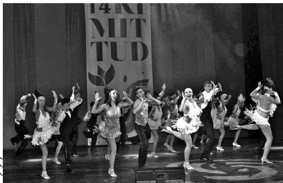
Dinamikus koreográfia vezette győzelemre a csapatot a nagyváradi döntőben