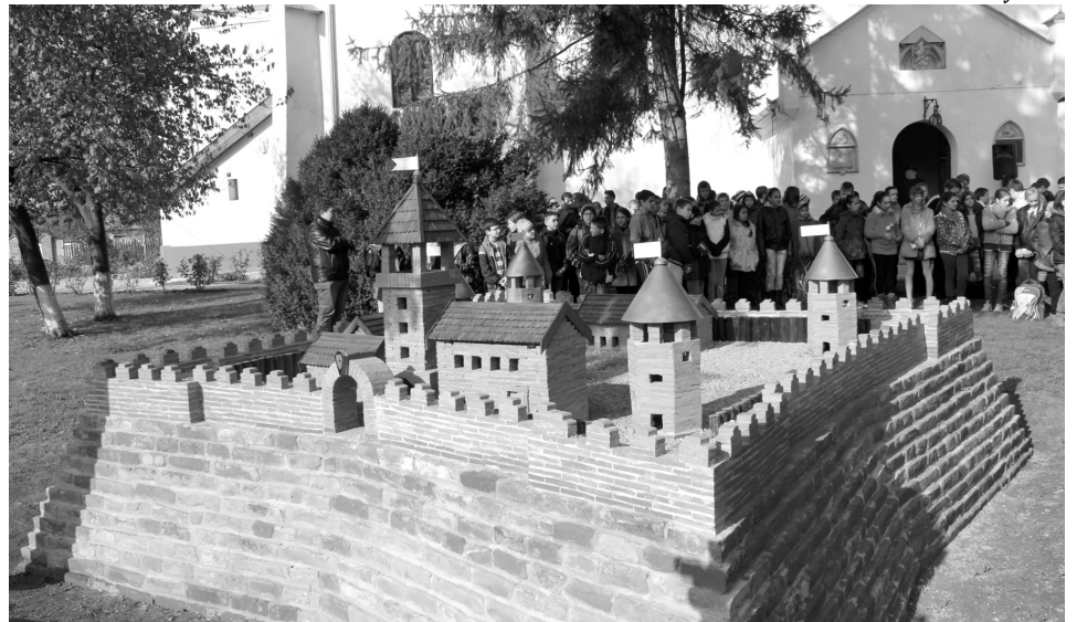
A templomkert gyöngyszemének szánják az újjáépített vármakettet

A székelyhídi református egyházközösség összetartásáról tett bizonyosságot, hiszen önerőből, külső támogatás nélkül sikerült megvalósítaniuk a gyülekezeti ház létrejöttének álmát. Az épület teljes mértékben