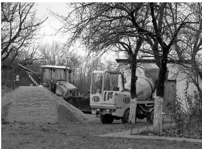
Megjelentek a munkagépek a csokalyi iskola udvarán

Csokaly legégetőbb problémája még mindig a vezetékes víz hiánya, bár az ivóvíz- és szennyvízhálózat lefektetése elkezdődött a környezetvédelmi ügynökség (administrația fondului de mediu) által finanszírozott pályázat segítségével. Sikerült is lefektetni mindkét hálózat rendszereit, ám sajnos megfelelő kút hiányában még nem kerülhet ivóvíz a csokalyi lakosok otthonaiba, s jelen pillanatban az erre irányuló munkálatok is leálltak. Tehát Csokalyon sajnos még nem működik az ivóvízrendszer, így a lakosság kénytelen a falvak kútjaiból, kútjaitól hordani a háztartásokba a vizet.