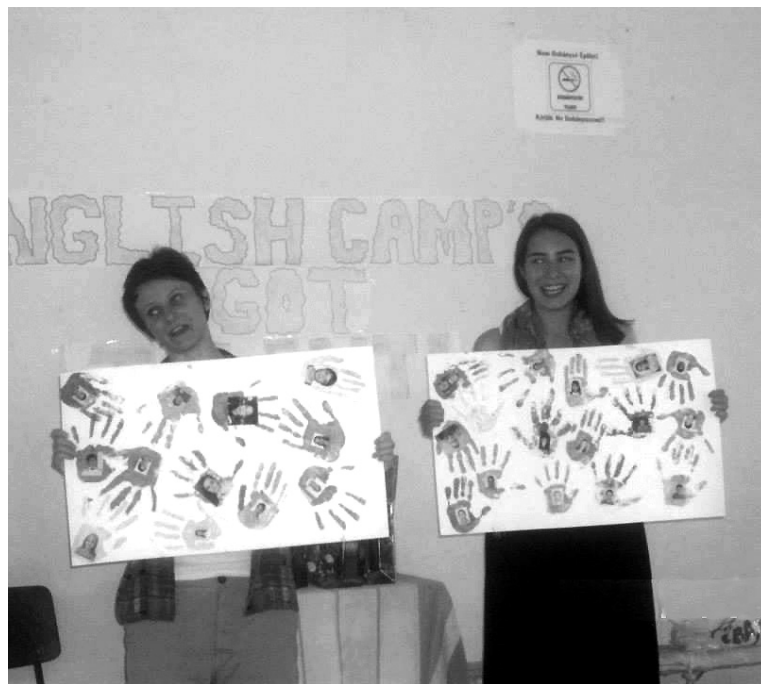
Játékosan tanított a helyi és külföldi oktató

Sok énekkel, játékkal, és még több tanulnivalóval várták az ideai angoltáborok tanítói a nyelvtudásukat fejleszteni kívánó gyerekeket július első hetében között úgy Székelyhídon, mint Érolasziban.