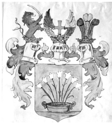
A Draveczy család címere

* A Draveczy család az egyik ősi nemesi család Biharban. Több birtokkal rendelkeztek környékünkön, például a gálospetri Draveczy-kastély is az övék volt, mely a közelmúltban a Dévai Szent Ferenc Alapítvány birtokába került.