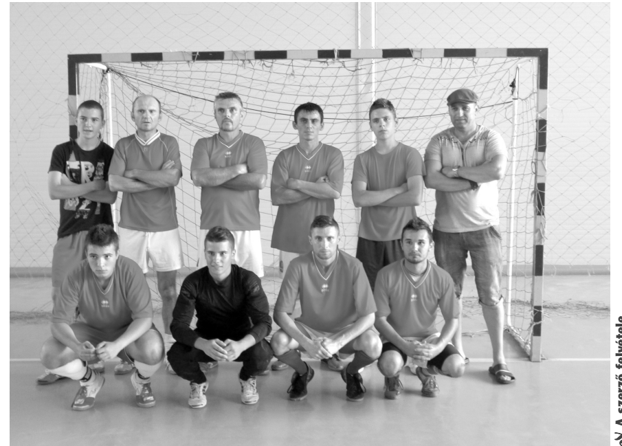
Jövőre összejöhet a harmadik győzelema most sérülésektől megtizedelt Interstecsnek