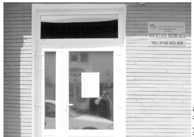
✂ Aszalós Tímea