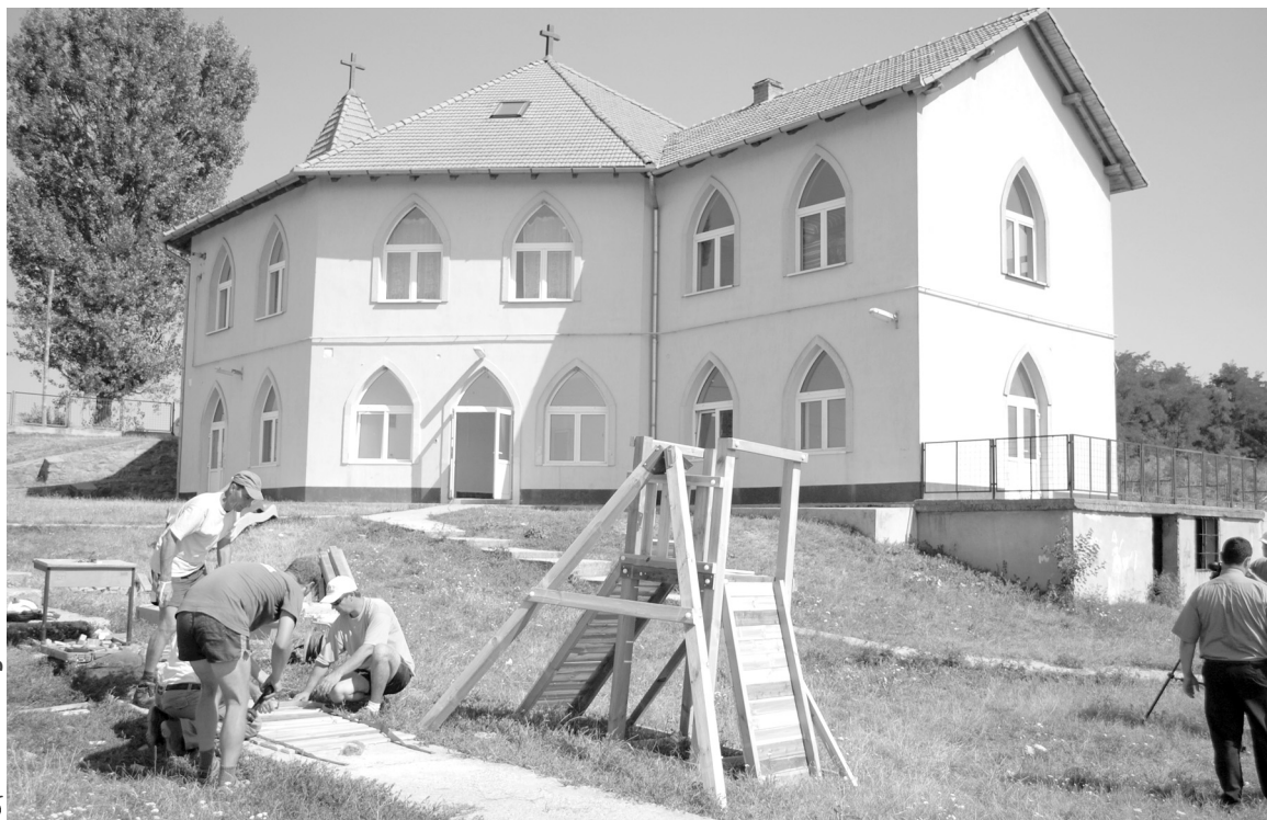
✂ Szabó Csongor

✂ Megépült a tizedik új játszótér Székelyhídon a roma baptista imaház udvarán