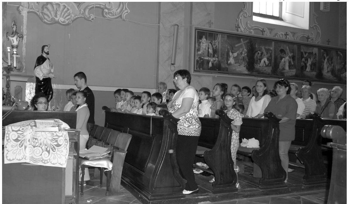
Meghatotta a gyülekezetet a szentmisén éneklő gyerekkórus

denki kicsit levetkőzhetette a hétköznapok gondját és együtt imádkozhatt az érmelléki árvák otthonáért. A remények szerint szeptemberben már fel is szentelik a gyerekvédelmi intézményt, amely az egykori Stu-