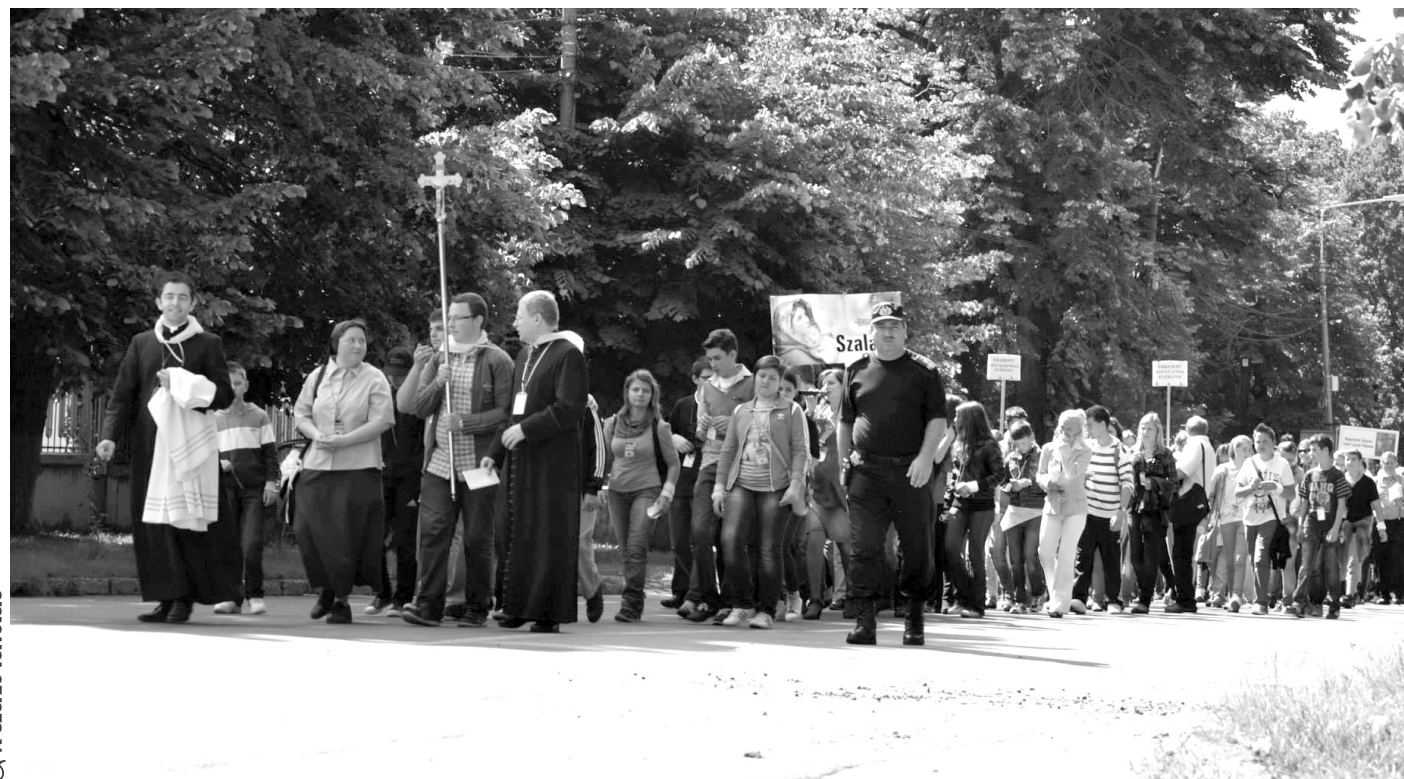
A nagyváradai püspöki bazilikába vonulnak a katolikus ifjúsági találkozó résztvevői

* A bihari egyházmegye számos településéről érkeztek a fiatalok a „Telve hittel és Szentlélekkel” ( Apostolok cselekedetei , 11. fejezet, 24. vers) mottójú ifjúsági találkozóra, amelyet a nagyváradai római katolikus püspökség az egyházmegyei ifjúsági központ keretében negyedik alkalommal szervezett meg június 8-án Nagyváradon.