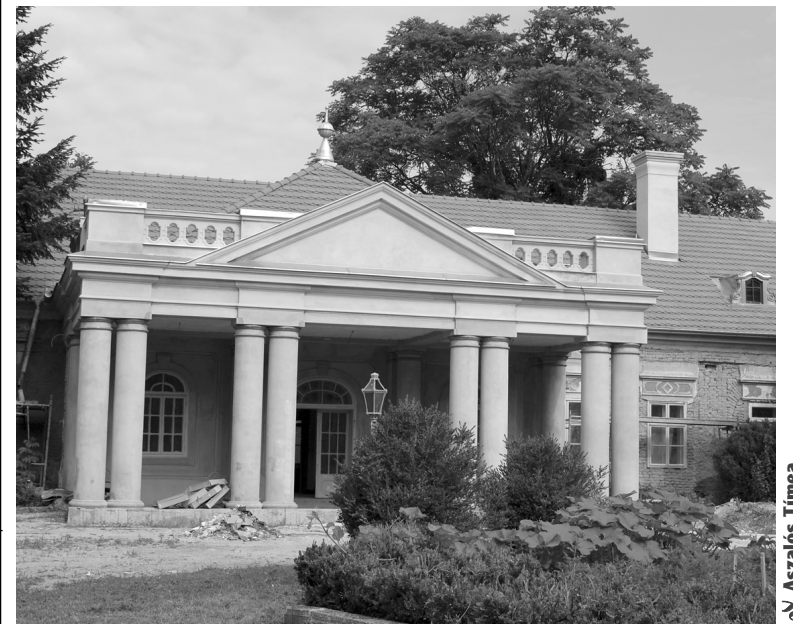
Az árva gyerekek otthona lesz szeptembertől a felújított kastély