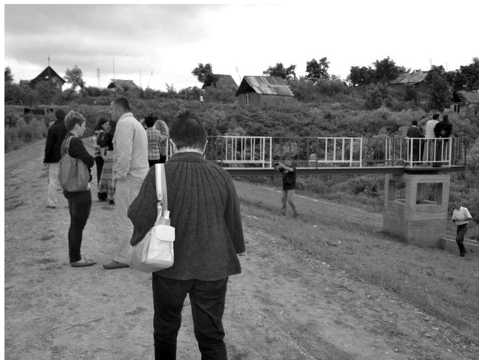
Megtekintették az elkészült lassítógátakat a zárókonferencia meghívottjai