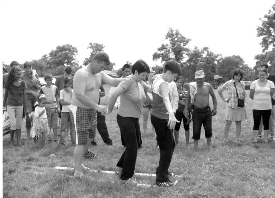
Az egész család ügyességére szükség volt a vetélkedőn