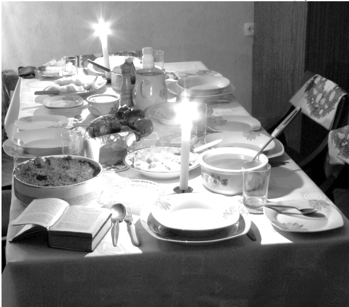
A világ minden táján a megterített asztal várja az összegyűlt családtagokat a közös ünnepi étkezéshez

Spanyolországban, Mexikóban, Puerto Ricóban és Dél-Amerikában, a három királyok, más néven a bölcsök visznek karácsonyi ajándékokat a gyermekeknek.