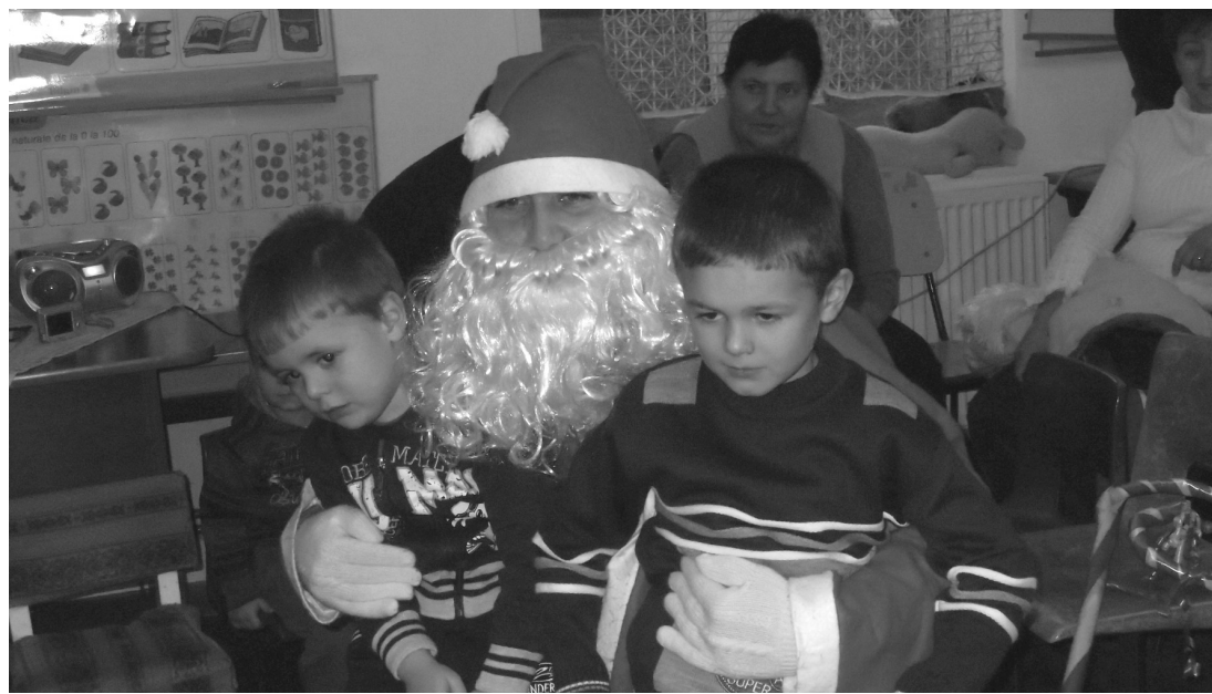
A bátor jelentkezők a Mikulás karjaiba ülhetek