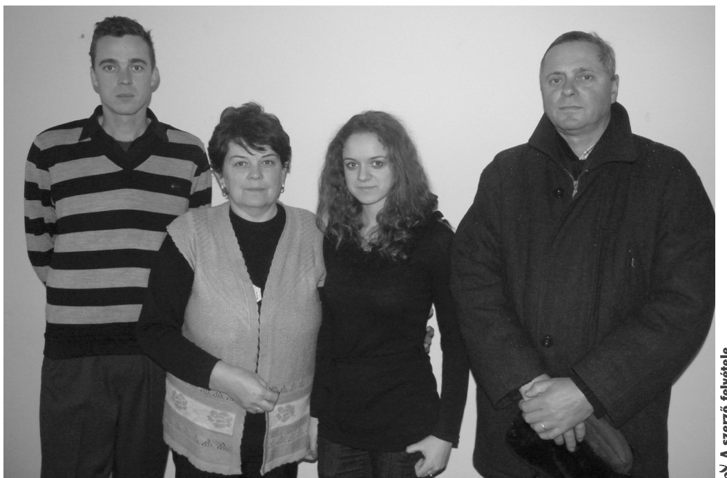
Nemsokára a Beke család tagjai is leteszik az állampolgársági esküit