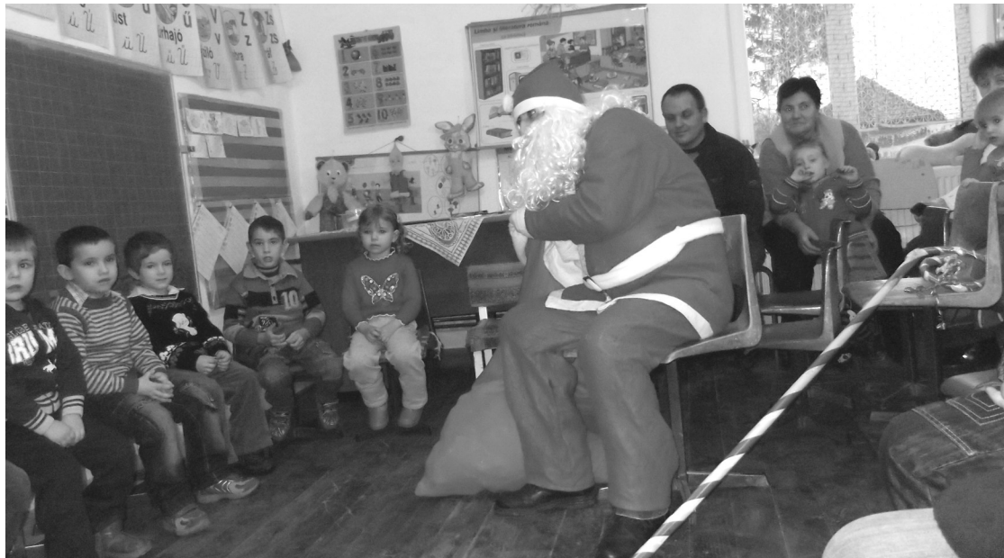
Az óvodások kíváncsian lesik, milyen ajándékokat tartogat számukra szájájában a Mikulás