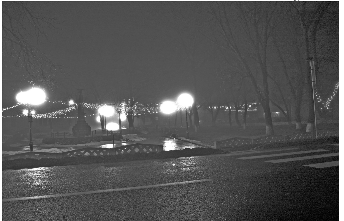
Éjszakai ünnepi díszkivilágítás Székelyhíd központjában

Pedig csak egy kicsit erőfeszítésbe kerülne, hogy ha már vásárolunk, akkor azt ne olyan vadul és megfontolatlanul tegyük, mint ahogyan manapság szokás, és főleg ne legyünk átverve lépten-nyomon. Ezt hívjuk tudatos vásárlásnak. A fogalom, hogy picit tudományosak is legyünk, először 1992-ben került lejegyzésre egy brazilai környezetvédelmi konferencián. Később, 1994-ben, Svédországban egy hasonló eseményen adták ki hivatalosan a „fenntartható fogyasztás” kifejezés formájában. Mit is jelent ez? Idézem: „Az alapvető szükségletek kielégítésére és az életminőség javítására irányuló szolgáltatások és termékek használata, miközben a természeti erőforrások és mérgező anyagok használata, ezzel együtt a hulladék és mérgező anyag kibocsátása minimálisra csökken azáltal, hogy a jövő generációinak szükségleteit ne veszélyeztessen.” Szóval vásároljunk annyit, amennyi szükséges úgy, hogy minél keveseb-