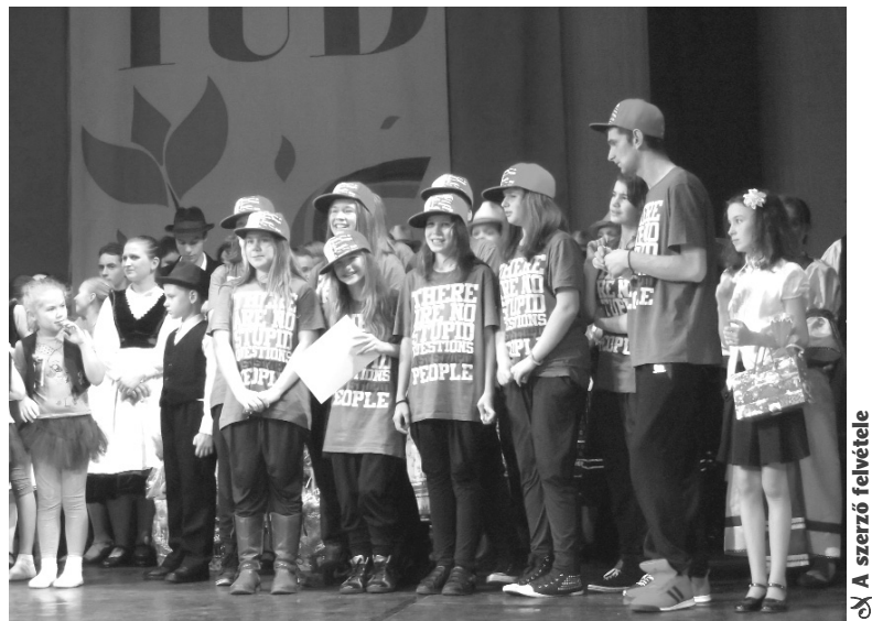
A Free Steps tánccsoport a nagyváradi színpadon