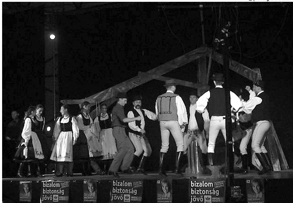
Varázslatos ritmusú tánccal keltették életre Fekete Sáfrán történetét a nagyváradai művészek

Sáfrán először a rossz utat választja, a gazdag lányt veszi el cselszövésével feleségül, akit csak a pénzért szeret. Hamarosan megérkezik az égi igazságszolgáltatás: Sáfrán számárrá változik, gazdag és fukar felesége pedig azonnal pénzkereseti lehetőséget lát benne, és elvezeti a vásárra. Itt csoda folytán találkozik a