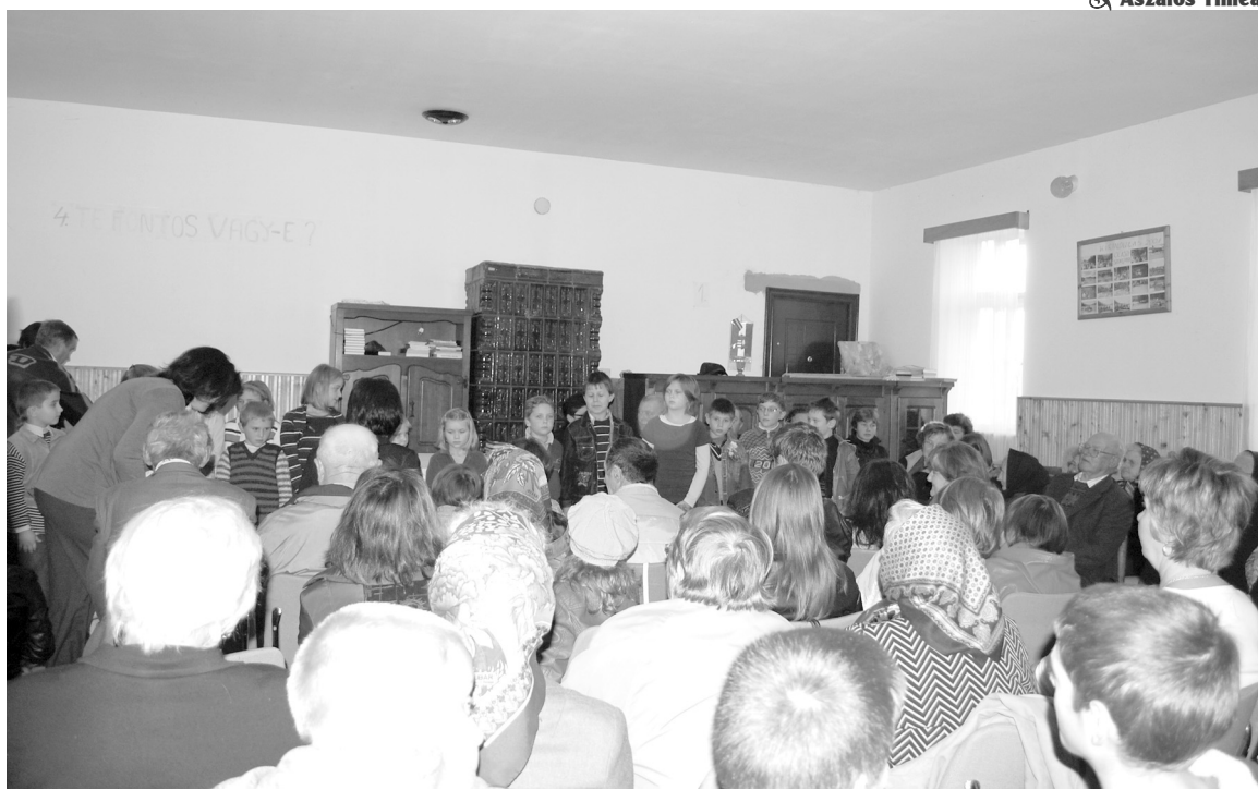
Az iskolások énekekkel és szavallatokkal tették színesebbé az idősebb falubeliek tiszteletére szervezett napot