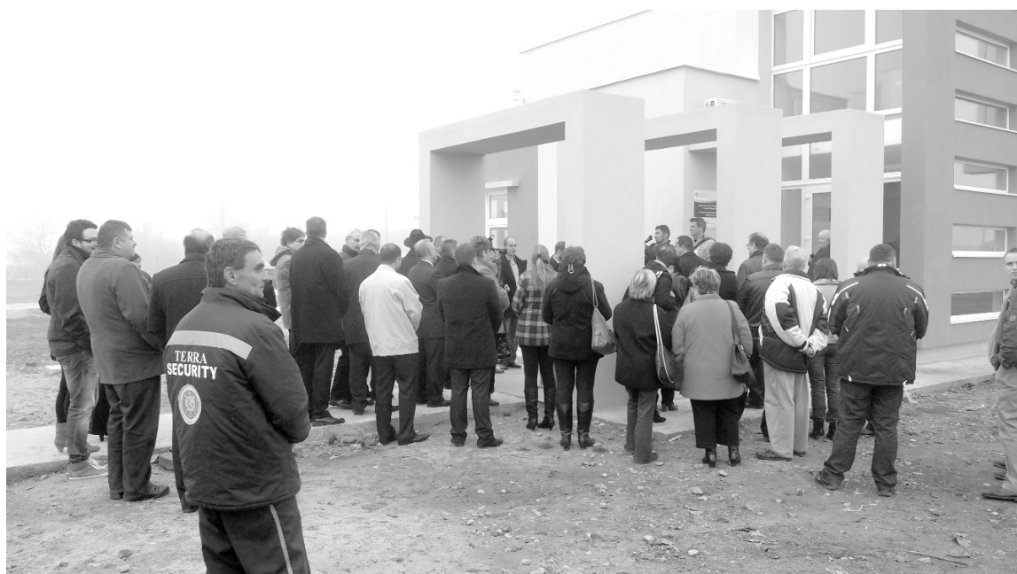
A tucatnyi cég működését elősegítő inkubátorház átadásán szép számú meghívott és érdeklődő volt jelen