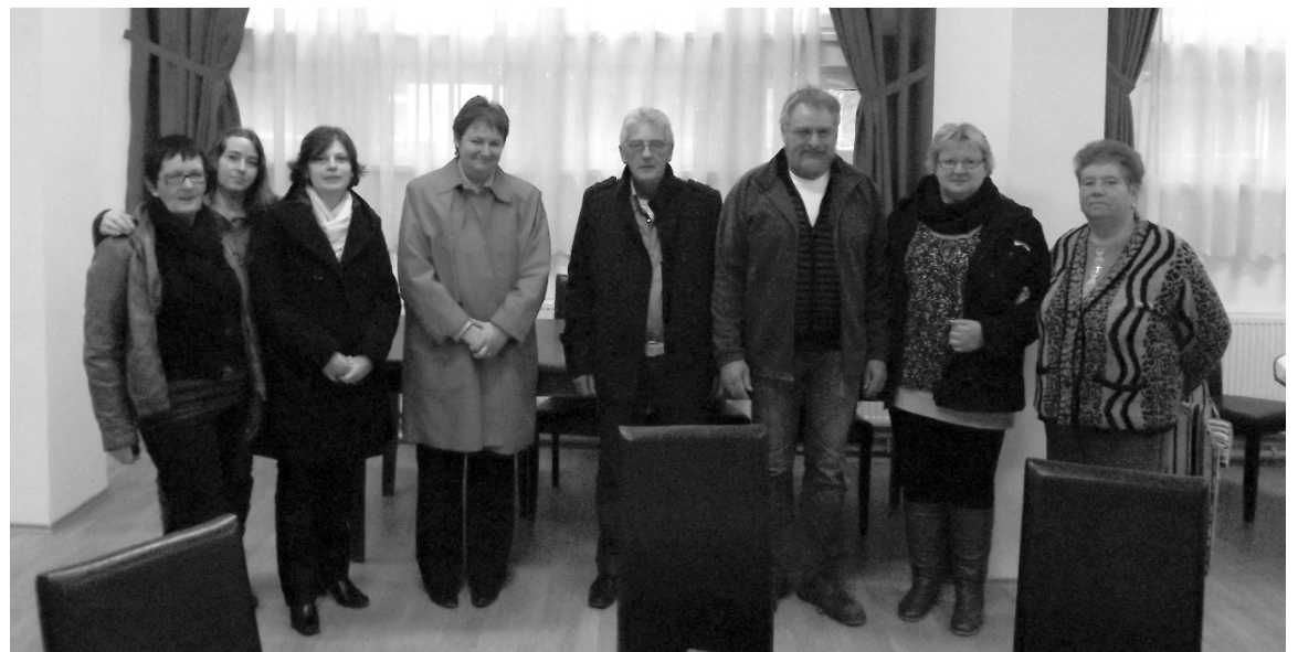
Legutóbb a margittai kórházba is ellátogattak hollandiai emberbarátok