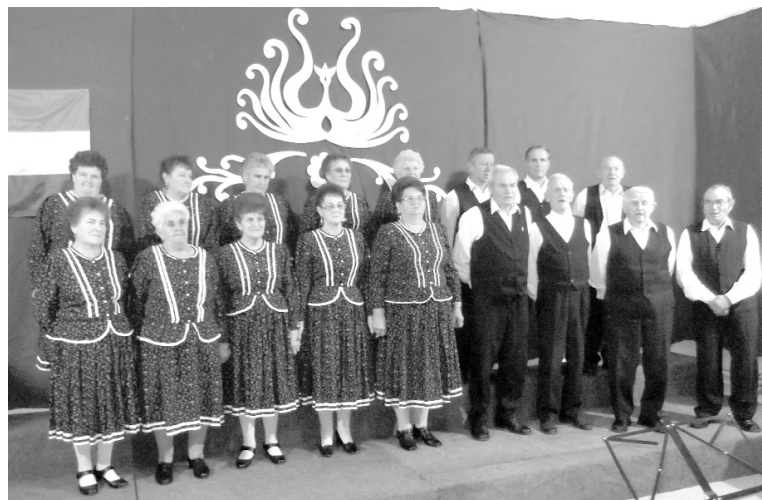
Magyarországi vendégek: a Nyíradonyi Pávákör