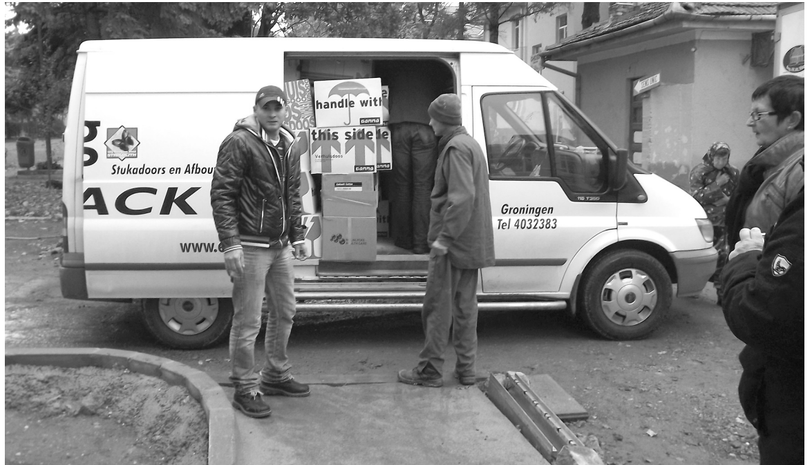
Jól fog a Nyugat-Európából érkező segítség a köbölküti rendelőben