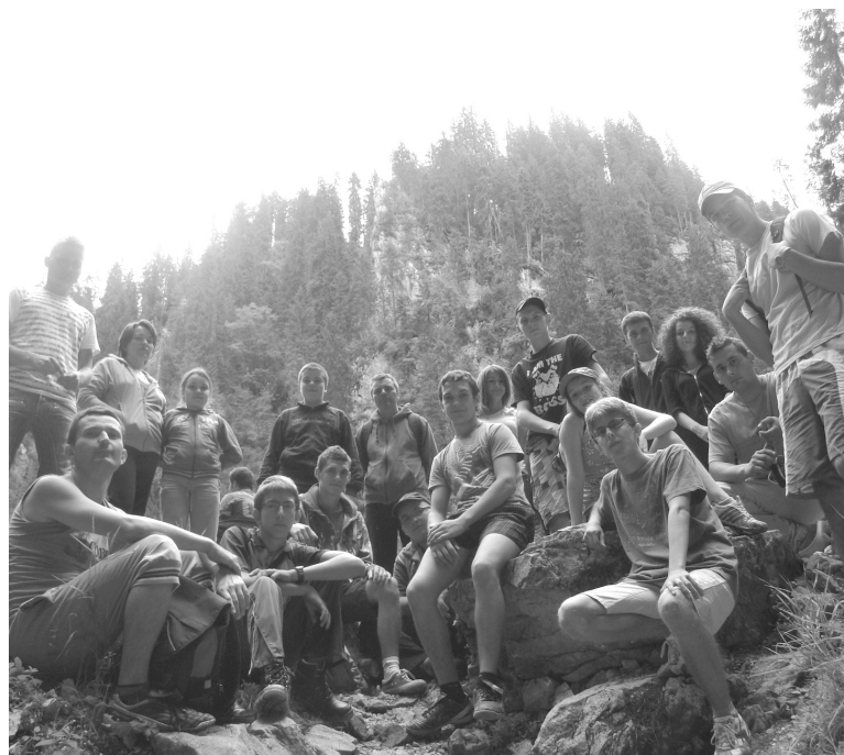
A csapat pihenője újabb ismeretlen helyek felfedezése közben