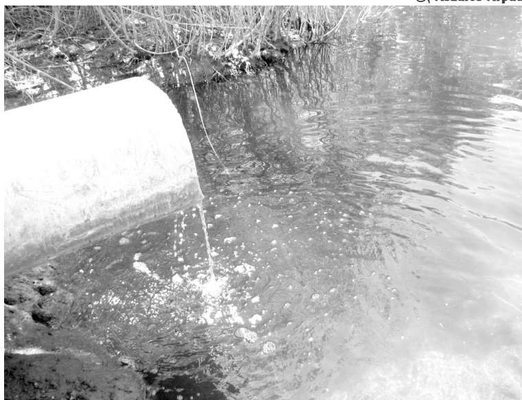
Ökológiai bomba lehet a patakba juttatott termálvízben levő vegyületekből