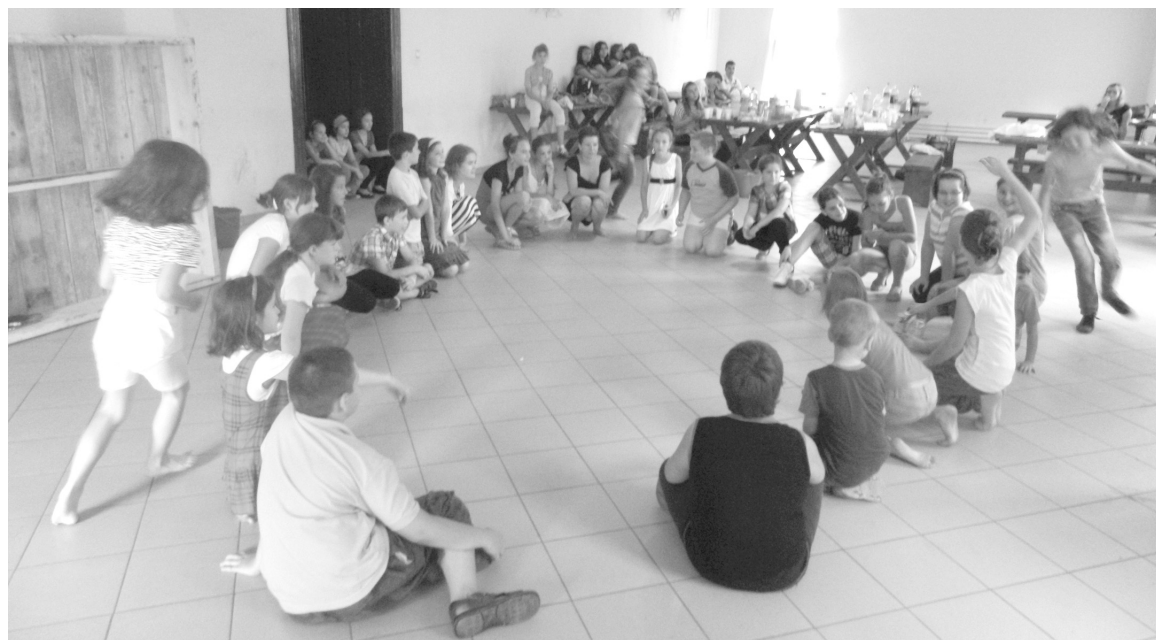
Így sokkal könnyebb, mint az iskolában: játékokkal fűszerezett nyelvtanulás a munkásklubban