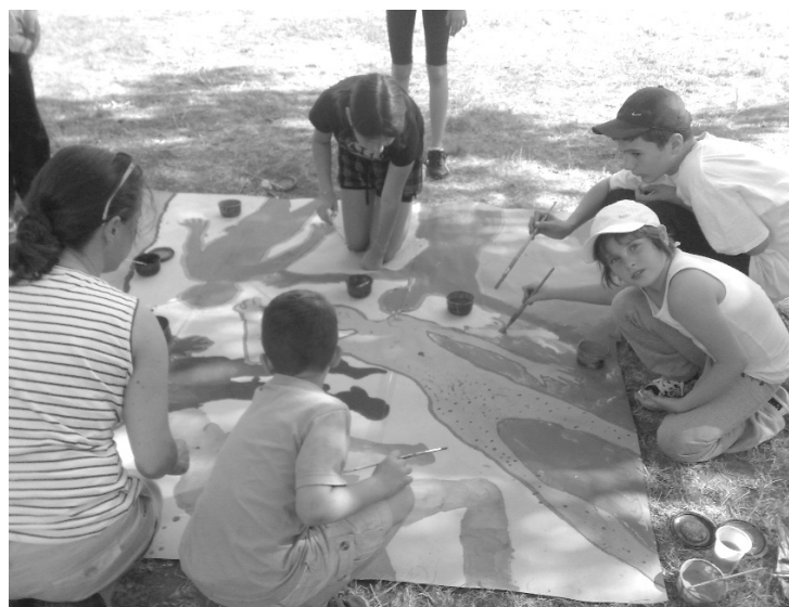
A rajzolás-színezés-festés nemcsak művészet, hanem csapatépítés is