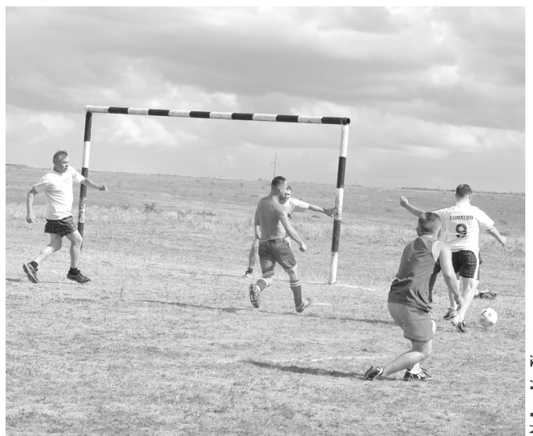
5-2-re nyerte a focimeccset a nőtlenek csapata