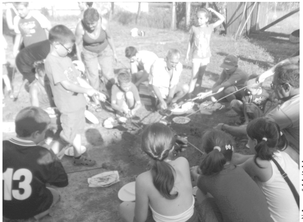
Hangulatos szalonnasütés az utolsó napon

Idén a kisebb korosztály képviseltette jobban magát, de az életkor igen változó volt, voltak itt három-, de tizenhét évesek is. Külön érdekességnek számított a kulturális sokszínűség: a helyi fiatalok mellett a foglalkozásokra Magyarországról, Kanadából, Franciaországból, Izraelből érkeztek gyerekek, illetve bekapcsolódott egy csoport belga fiatal is. A tábor így sokszor a nyelvek