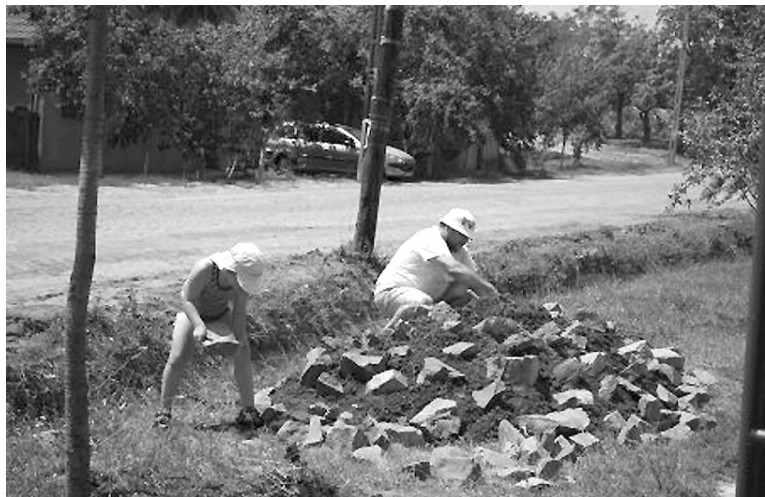
Készül a sziklakert: mert aki a virágot szereti...

ve, hogy lábteniszpályát és sziklakertet építsenek. Ugyancsak a célkitűzések között szerepelt az Érolaszi központjában levő terület kitisztítása, fűnyírás, bokorvágás. A tizenöt főből