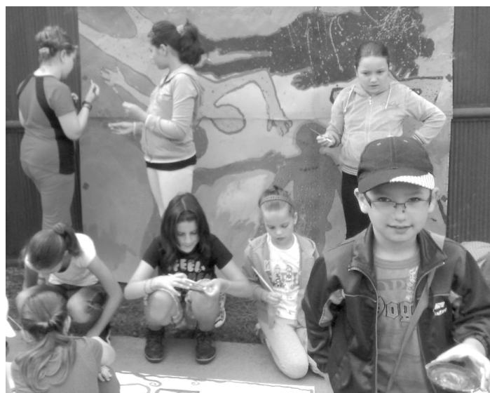
Összpontosítás: így bontakozik ki az alkotói fantázia