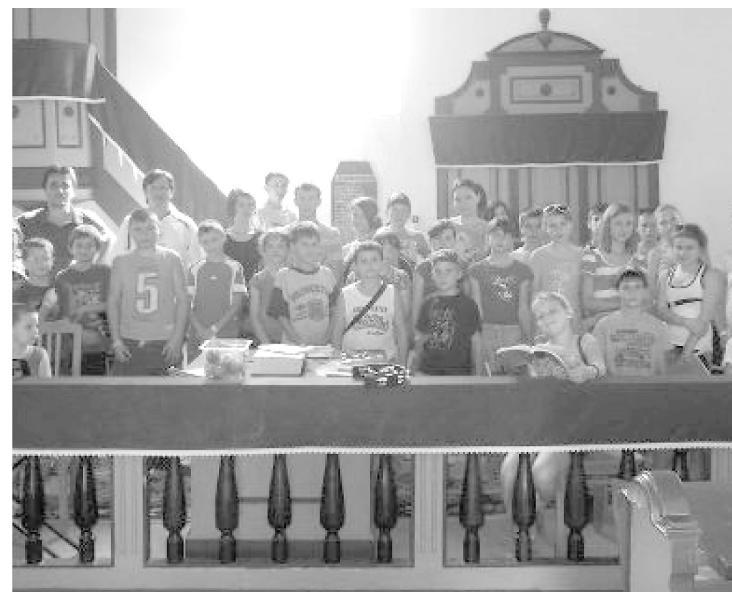
Az „Istenre figyelő” zenetáborosok a hegyközszentmiklósi templomban