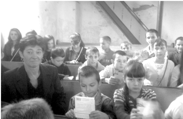
Gyerekáthít a hegyközszentmiklósi templomban

📍 Bibliahetet tartottak Érköbölkúton és Hegyközszentmiklóson