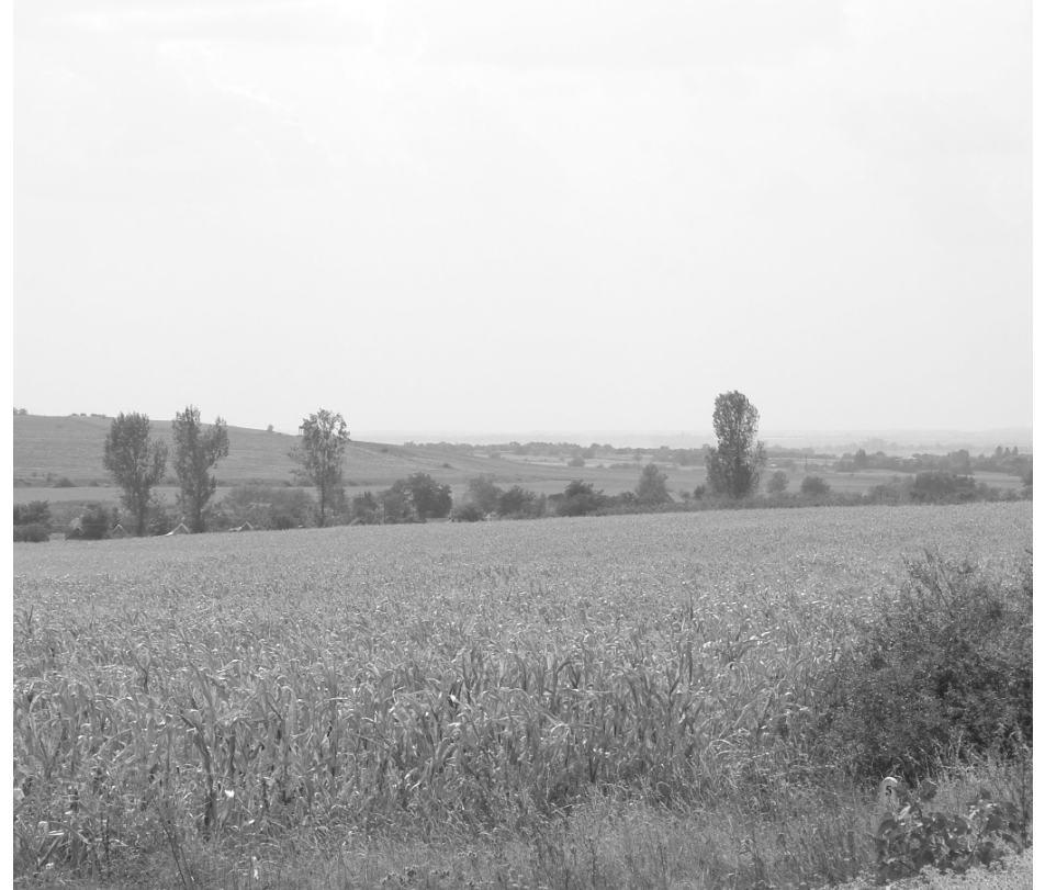
Az érmelléki határon is tönkretette a kukoricatermést a szélsőséges időjárás