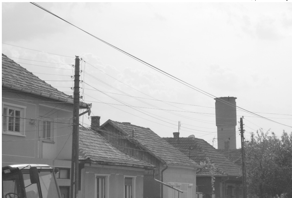
Nyomásgyakorlást csak a székelyhídi víztoronyból! Havonta 22 ezer lejjel csökkennének a város kiadásai az ivóvízhálózat cég általi üzemeltetésével