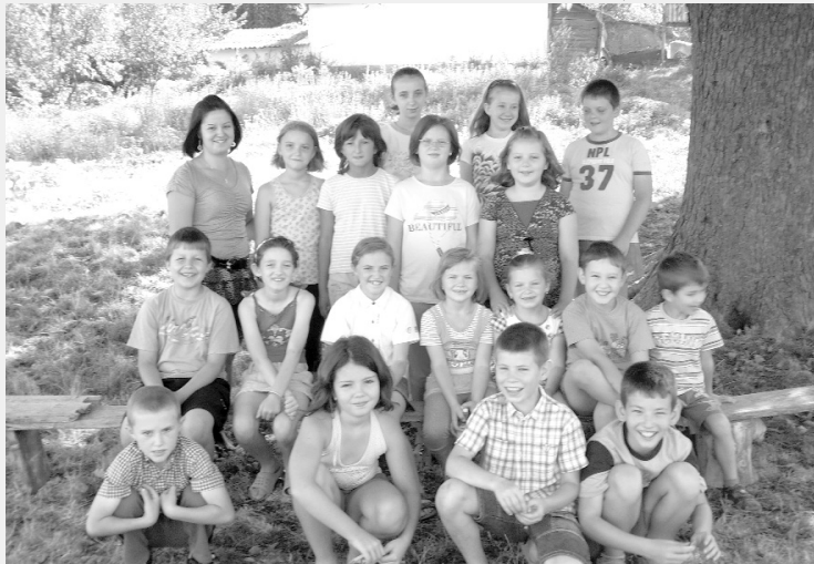
Kicsi és még kisebb nyelvtanulók a gesztenyefa árnyékában

* Idén nyáron is tárt kapukkal várta Érolasi gyerkőceit az egyhetes angol tábor augusztus 20–25. között. Bár a célcsoport a 6–18 év közötti diákság volt, a tábor érdeklődő, szorgalmas résztvevői közül a legfiatalabb öt, míg a legidősebb tizenkét éves volt. A gyerekek számolni, olvasni, énekelni tanultak, és legtöbbször most alapozták meg felkészültségüket a még előtűnik álló angoltanulásra. Természetesen az önfeledt játék sem maradhatott ki a napi programból, ami szintén nem nélkülözte az angol nyelv használatát. Az első nap megszeppenséget legyűrve a több mint húsz fős, hangos kis sereg már a következő évi táborról álmódzva hagyta el minden nap az iskola tantermét.