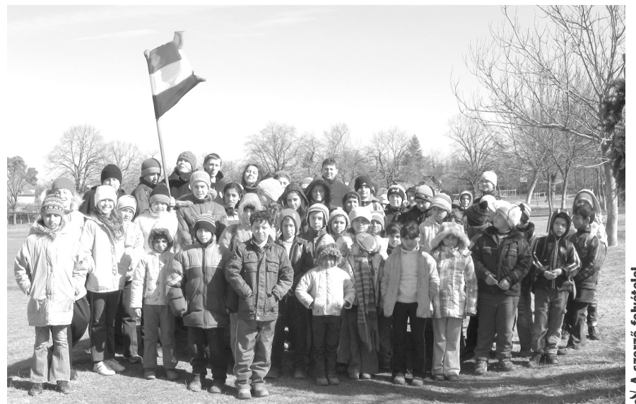
Csoportkép a kopjafá megkoszorúzását követően