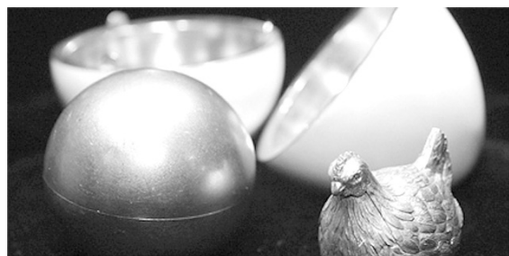
Dollármilliókat érnek: az első Fabergé-ékszer, a Tyúktojás, illetve a leghíresebb, a Koronázási tojás