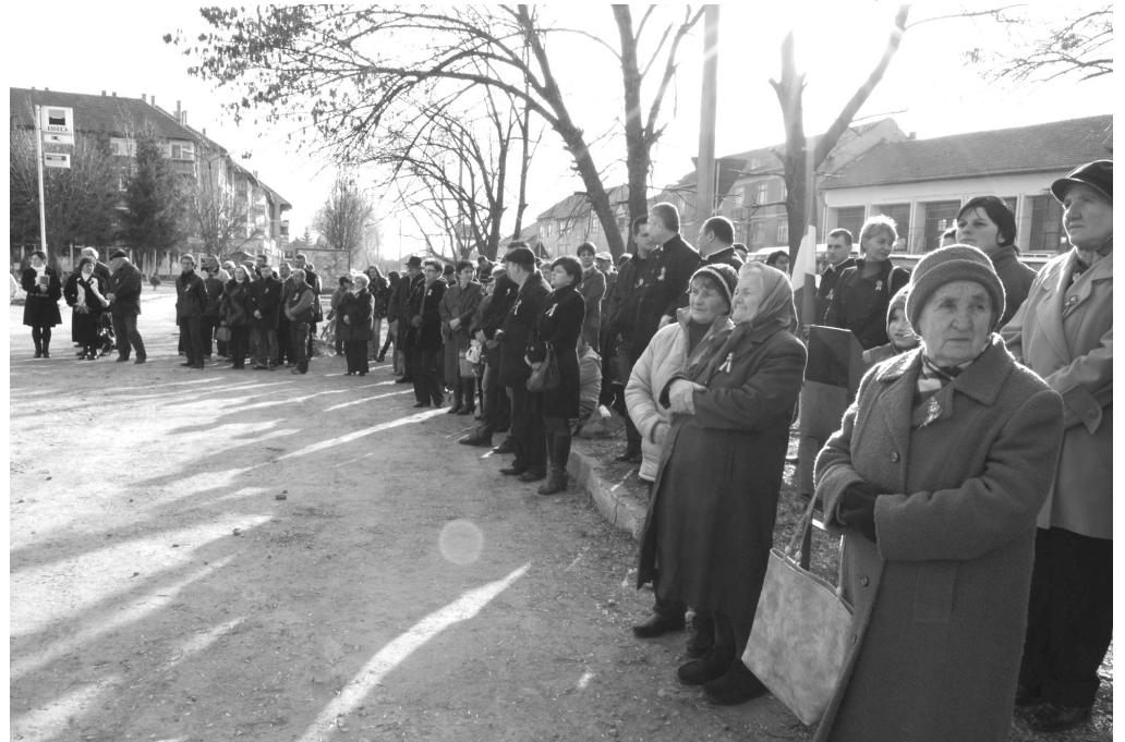
A művelődési ház előtti téren összegyűlt megemlékezők sokasága

* Március 15-én délután jelentős számú ünneplő gyűlt össze az 1848–1849-es magyar forradalom és szabadságharc kitörésének évfordulóján Székelyhíd központjában, a helyi művelődési ház előtt.