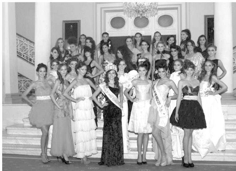
A Miss World Romania versenyzőnye