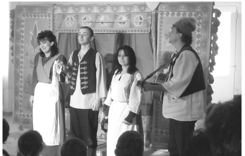
Könnyen csaltak mosolyt közönségük arcára a Lilliput társulat művészei