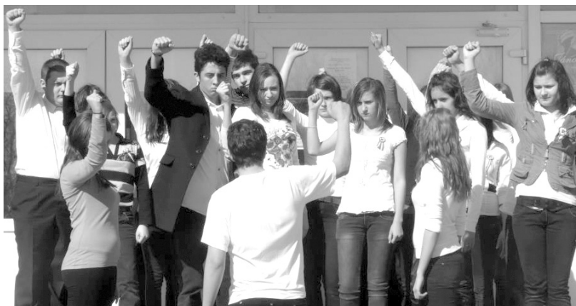
Tanulóink „forradalmi” lendületben