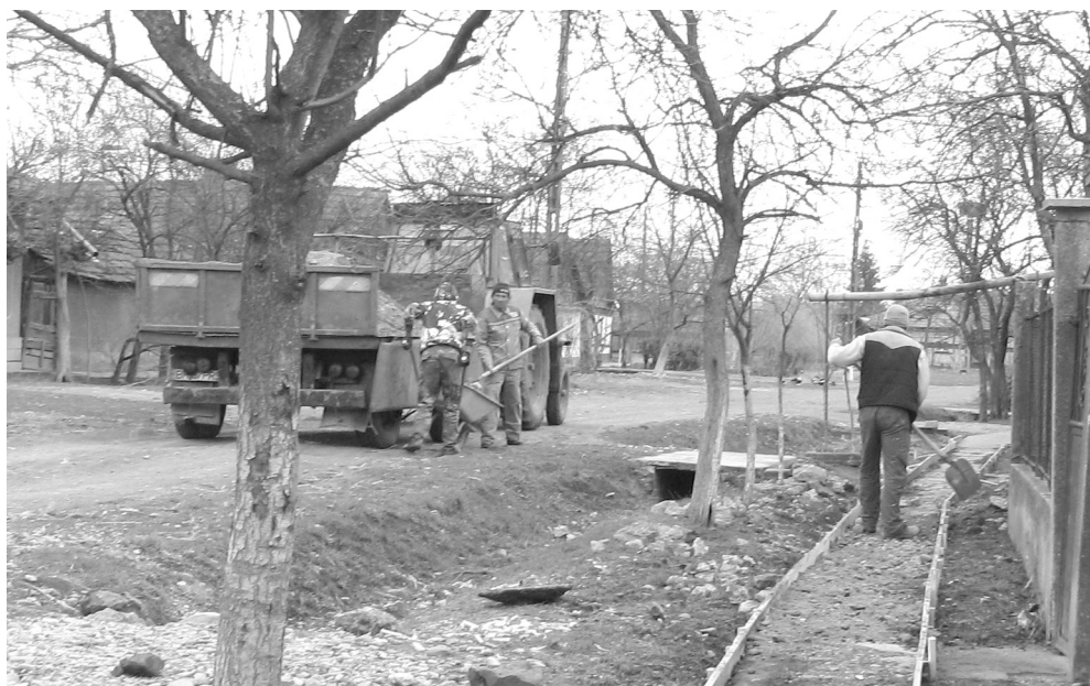
Nem kell többé sártengeren eljutni a házakhoz

* A tavasz beköszöntével egyre több lakost lehet látni, amint földjükön, kertjükben vagy az utcán a házuk előtt serénykednek. És nincs ez