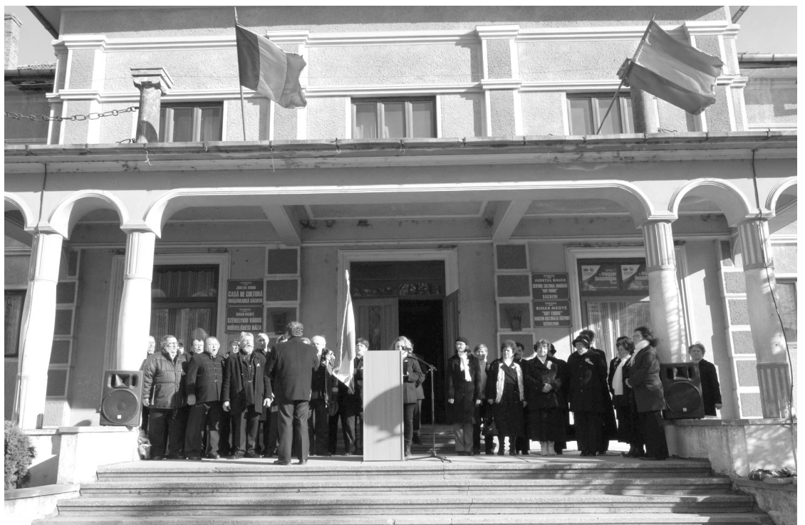
Ér hangja A Székelyhídi Férfikórus és a Búzavirág népdalkör előadásai tették igazán ünnepivé az idei március 15-ét

Az ünnepnapot a Szózat , a Himnusz és a Székely himnusz közös elneklése zárta.