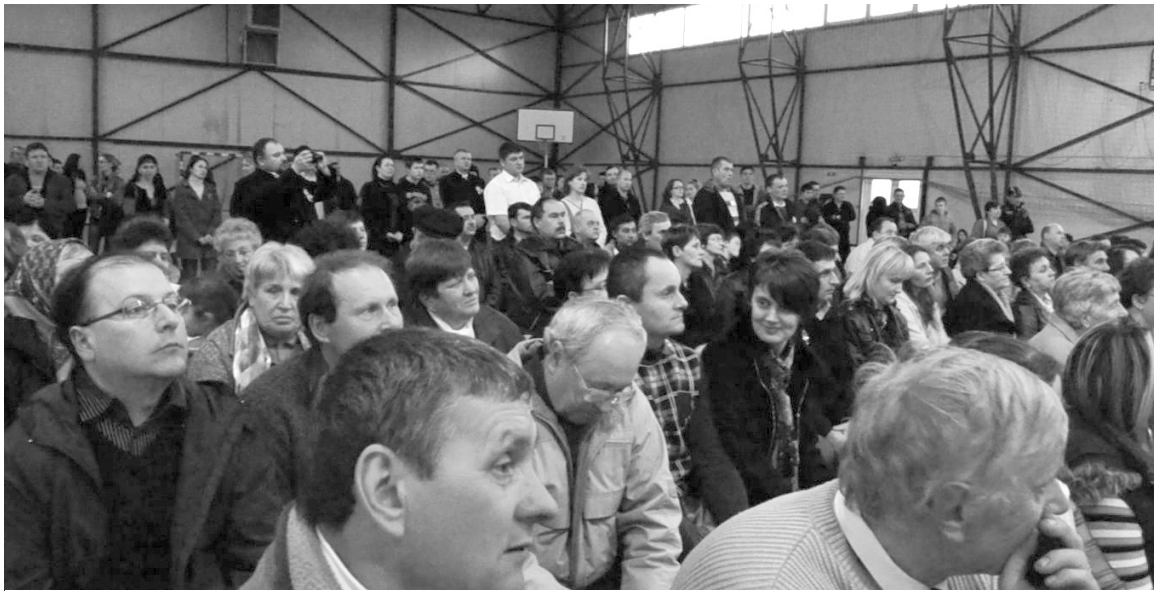
A sportcsarnok zsúfolásig megtelt székelyhídiakkal és környékbeliakkal

„Győzni fogunk, ha itt már Seregen ágyú áll. Az obsitos harang is egyszer Tornyába visszazsall. Elfeledjük majd lassan A harcot, vérözönt, A béke minden ágyút Haranggá visszaönt.” V. B.