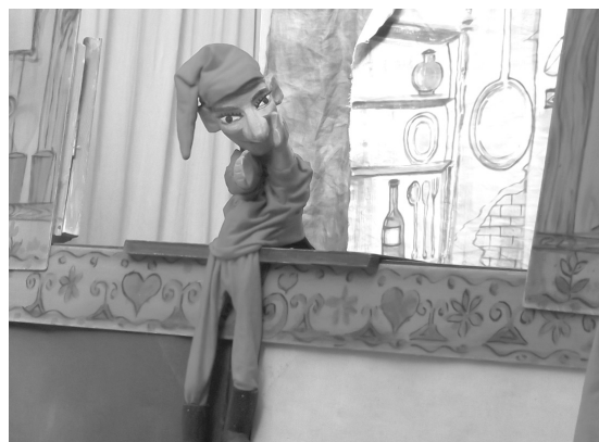
Vajon mit súghat Paprikajancsi az őt figyelő gyerekeknek?