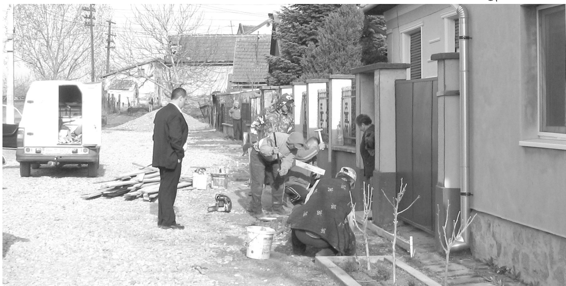
A polgármester ellenőrzi a munkálatok előrehaladását

Ugyanitt kell megemlítenünk a város utcáinak járdázását, amelynek eredményeként összesen körülbelül 10 kilométernyi járdát sikerült megépíteni vagy újraönteni a város különböző utcáin. Ezek között szerepel a Vecser mindkét oldala, Kiskágya teljes jobb oldala és szakaszokban a