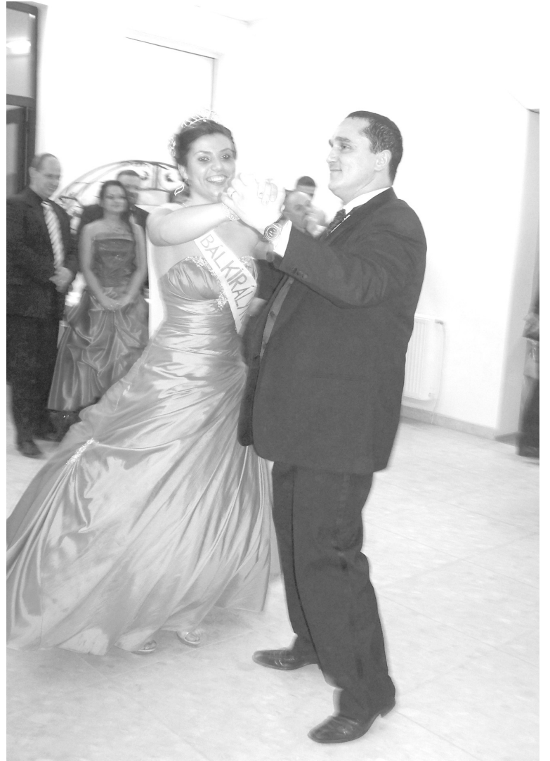
Az új bálkirálynő első tánca mindig a polgármesteré