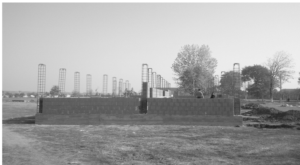
Az épülő sporttelepen jól haladnak a munkálatok

2012 augusztusára befejeződik a két gátból álló esővíz-elvezető rendszer felépítése, amely megoldást jelent az eddig számos alkalommal nagy károkat okozó árvíz problémájára. (Remélhetőleg 2008-ban utoljára történt