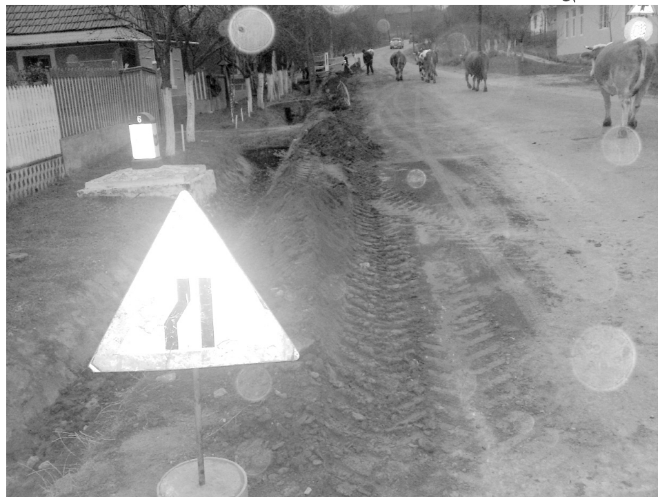
Zajlik a hegyközszentmiklósi és nagykágyai utcák modernizációja

városunkban, hogy több száz lakást veszélyeztetett a hirtelen lezúduló esőzés nyomán keletkezett belvív.) A két gát közül az egyik a Kiskút völgyön fogja az esővizet összegyűjteni, a másik pedig a Cser völgyén, ez utóbbi már szinte teljesen elkészült.