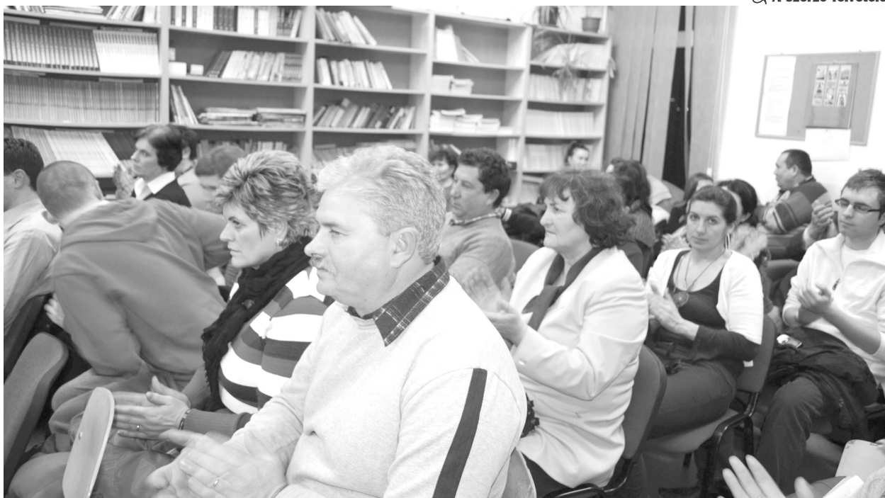
Szép számban gyűltek össze a film- és irodalomkedvelők

📖 Bemutatták a Griffiti Dráma- és Filmműhely új filmjét, a Riport Kiadó könyvek és kiadványok sokaságával érkezett Székelyhídra