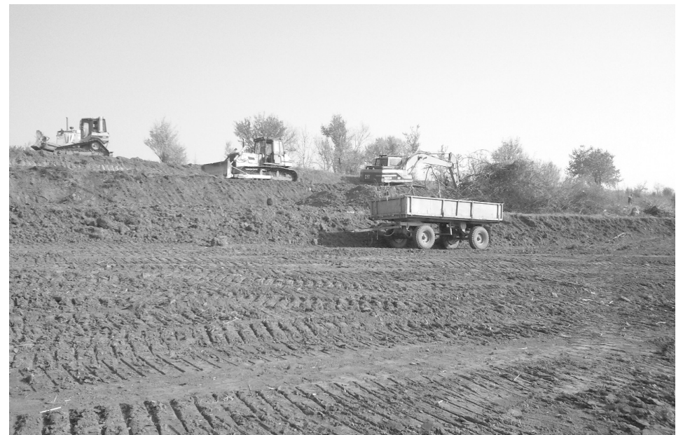
A Cser völgyi gát már szinte teljesen kész

Az önkormányzat elindított egy programot, melynek keretén belül feltérképezik a Székelyhídihoz tartozó összes földtulajdont, mind a 15 140 hektárnyi területet és próbálják szisztematikusan adatbázisba foglalni