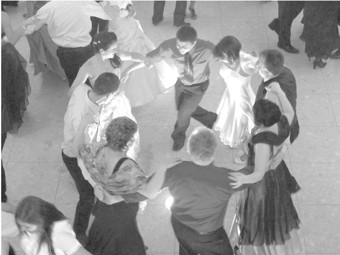
A pörgős dallamok lendületében ajánlatos összekapaszkodni

Az érmelléki farsangi bálakon hagyományra vált az aukció is, melyen ezúttal székelyhídi képzőművészek alkotásai és a meghívott vendégek felajánlásai kerültek kalapács alá. Az aukció teljes bevételét 9550 lej