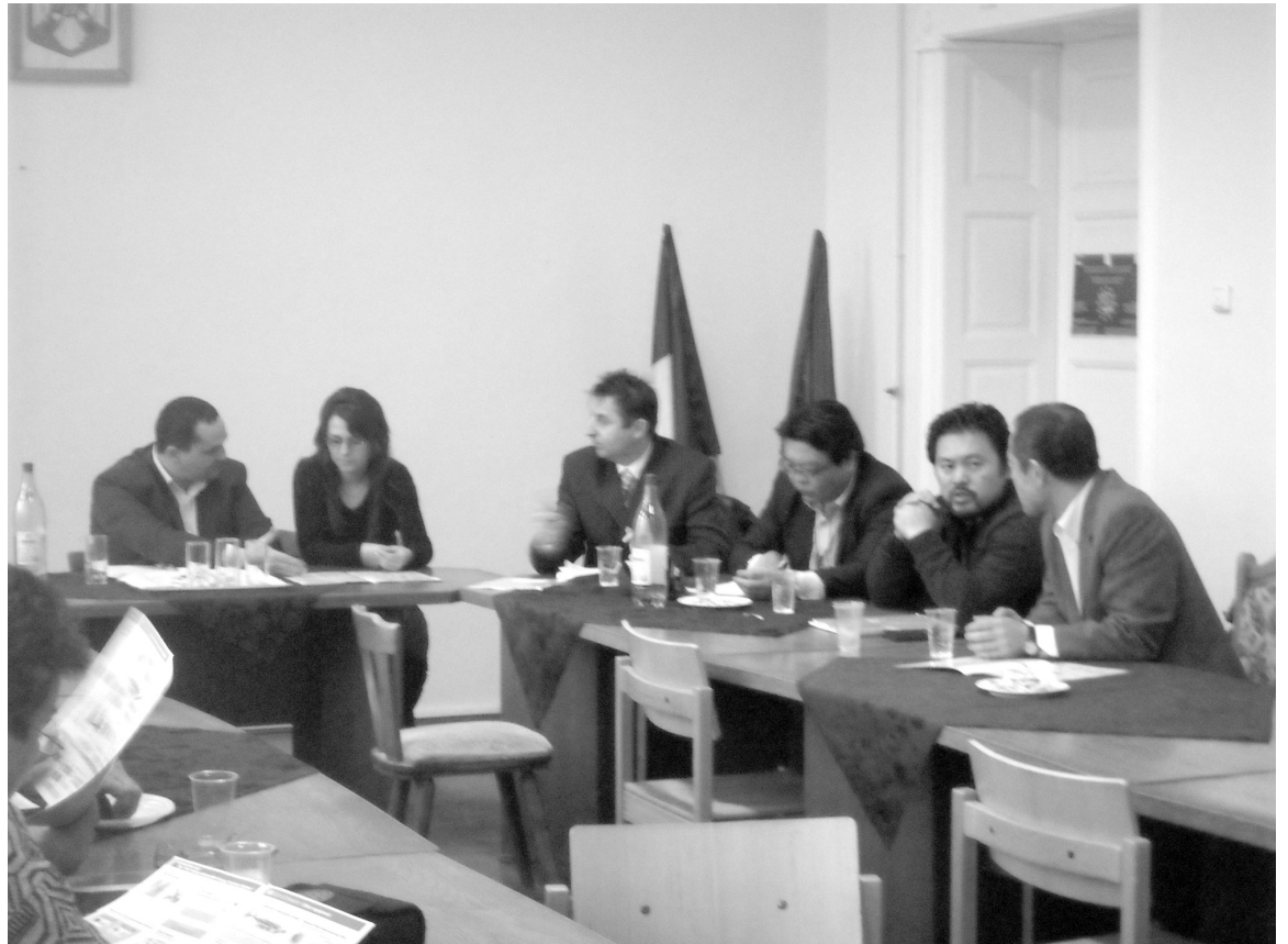
Az ázsiai cég képviselőinek (jobbra) javaslata ellen több kifogás merült fel a megbeszélésen