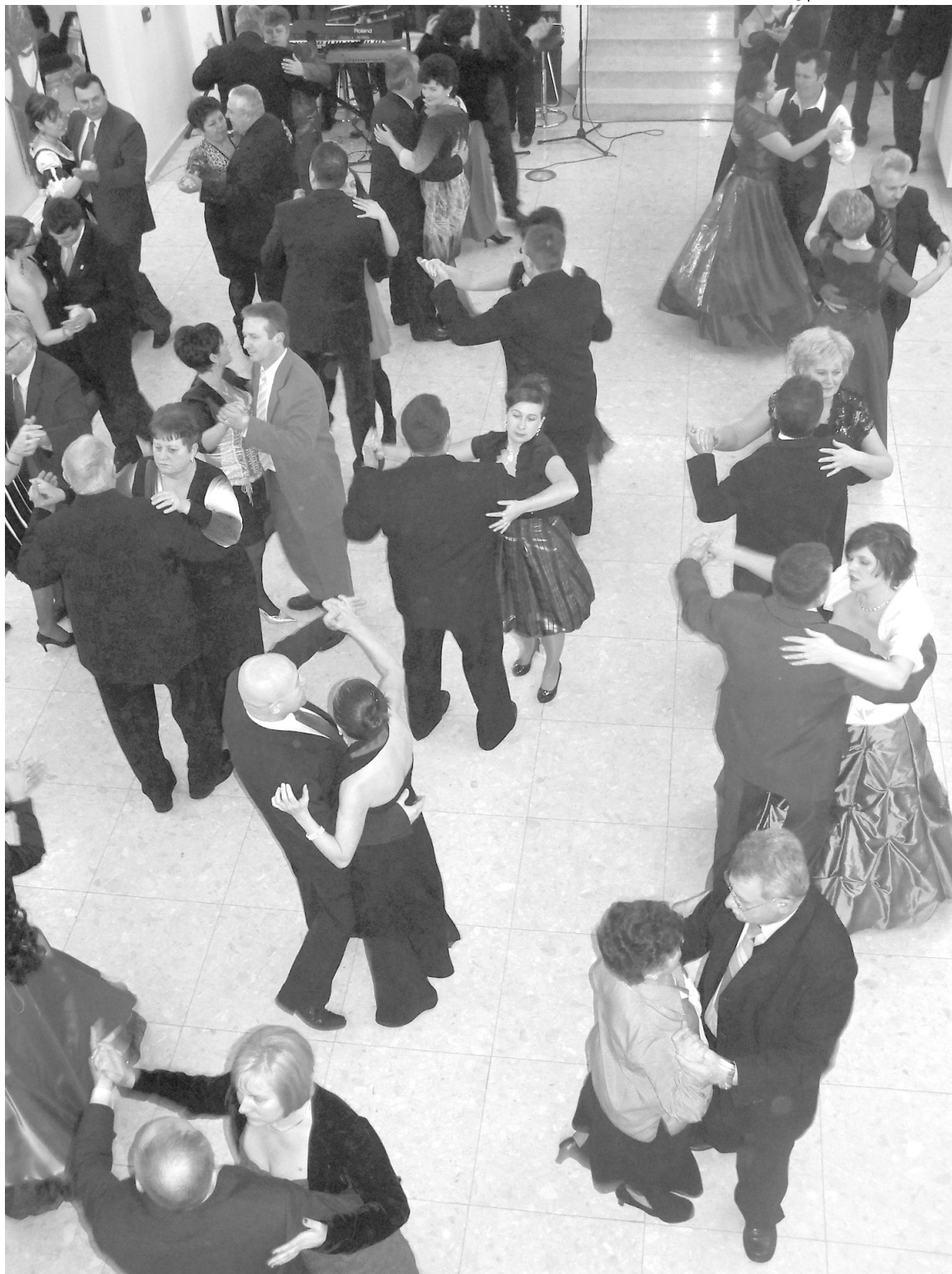
A vacsora után a bálozók birtokba vették a táncparkettet

* Népes részvétellel rendezték meg a már hagyománnyá vált Érmelléki Farsangi Bált január 21-én a Székelyhídi Múzeum épületében.