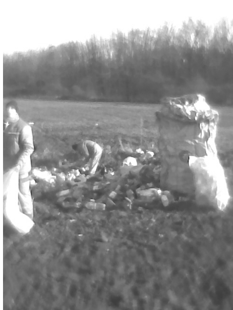
Az AVE munkatársai 12 köbméternyi hulladékot szedtek össze a műholdas felvételeken is látszó nagyobbik szemétkerakó helyszínén