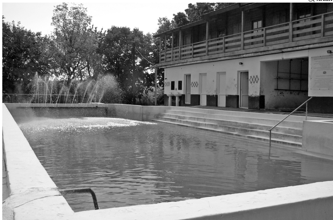
Már nemcsak nyáron lehet pancsolni a felújított termálstrandon

* Sokan nem tudják vagy nem is hiszik el: a hegyközszentmiklói termálstrand most, a hideg időszakban is üzemel. Az elmúlt években megszokhattuk, hogy szeptember végén lakat került a strand bejáratára, azóta viszont több változás is történt.