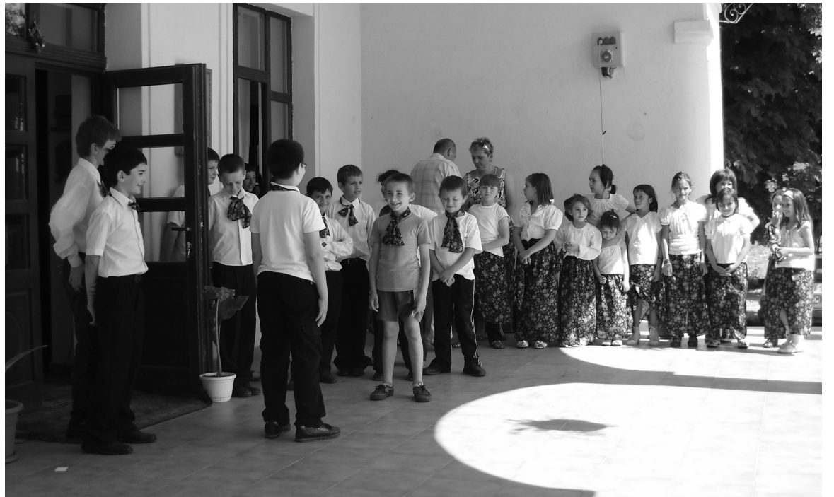
A székelyhídi csoport csapatbemutatója