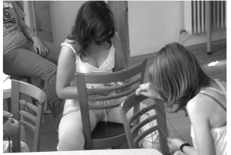
Így készül az indiánfonásos karkötő