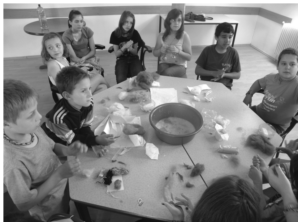
A résztvevők nemezelés közben

☞ Ismerkedés az érmelléki népművészeti hagyományokkal