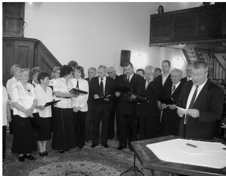
Előadáshoz készülődik a székelyhídi egyház felnőttkórusa