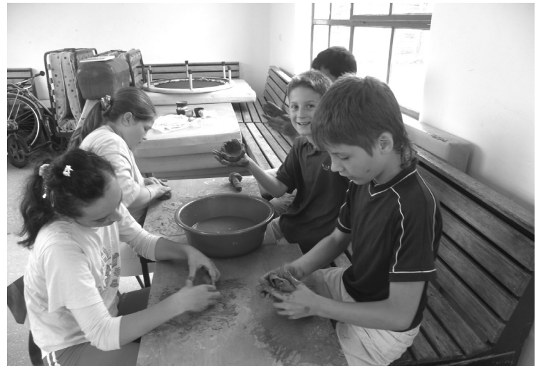
Alakulnak az agyagedények