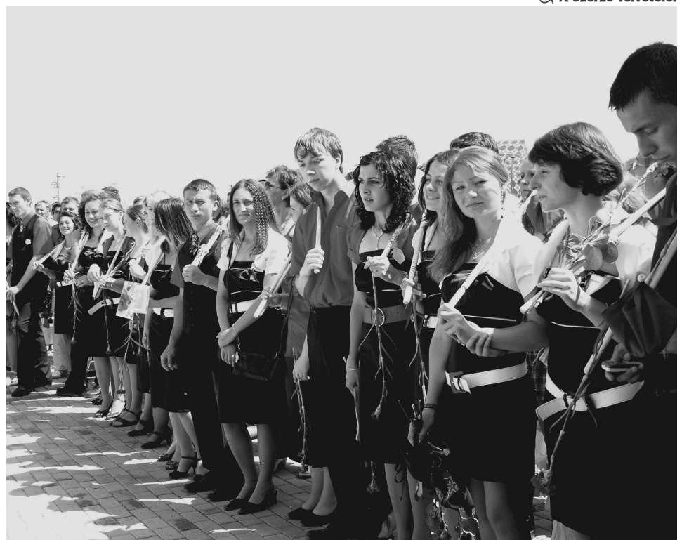
Ballag már a vendiák...