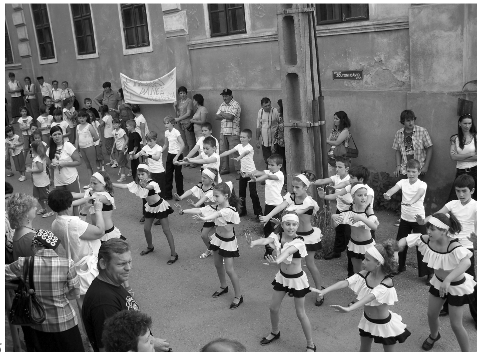
Ügyesen ropják a táncot a gyerekek

A rendezvényt a Communitas Alapítvány támogatta.