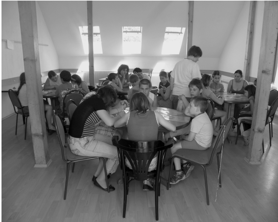
Táboro ügyeskedés az üvegfestésben

☞ Ismerkedés az érmelléki népművészeti hagyományokkal, a kézművesmesterségek technikáival