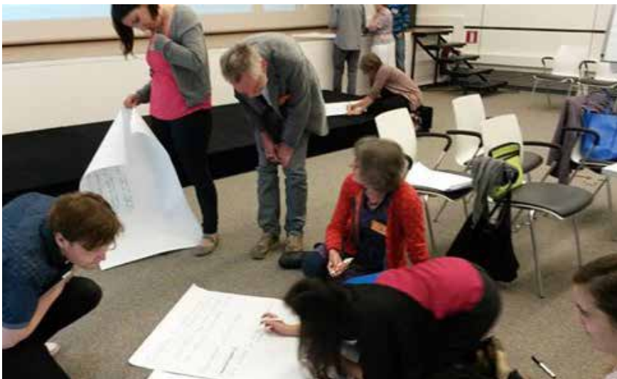
Az OED partnerek eszmecseréje a konferencián