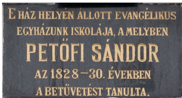
Emléktábla Kecskeméten, a Luther-palota homlokzatán (Szabadság tér)