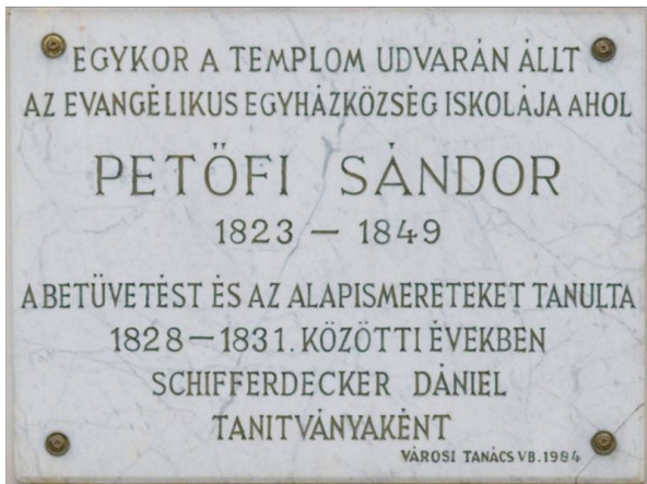
Emléktábla Kecskeméten, az evangélikus egyházközség épületén (Arany János utca)