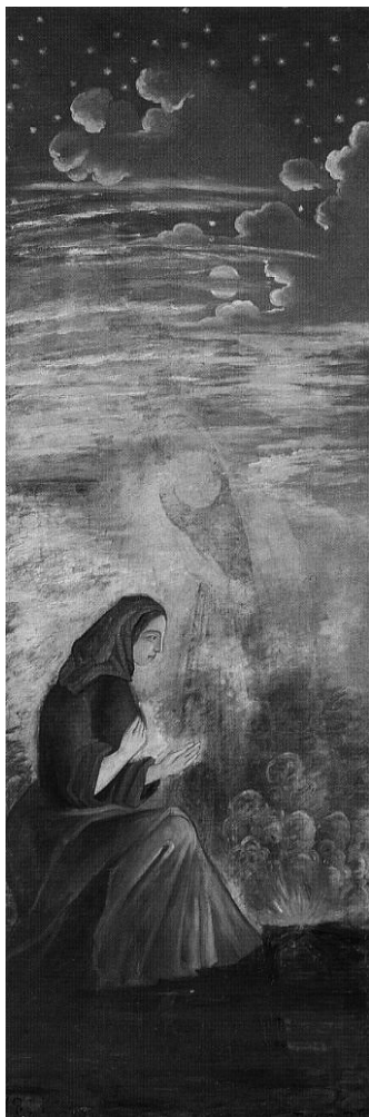
PAUL CÉZANNE (1839–1906) festménye

Csendes éjjel keltául. De megmaradtak azok az örök karácsonyok, és a kertbe költözött fenyők. Mert sokan várjuk a csodát, legalább évente egyszer. De hó már ritkán esik azon az estén. Vannak, akik tagadják még a globális felmelegedést is.