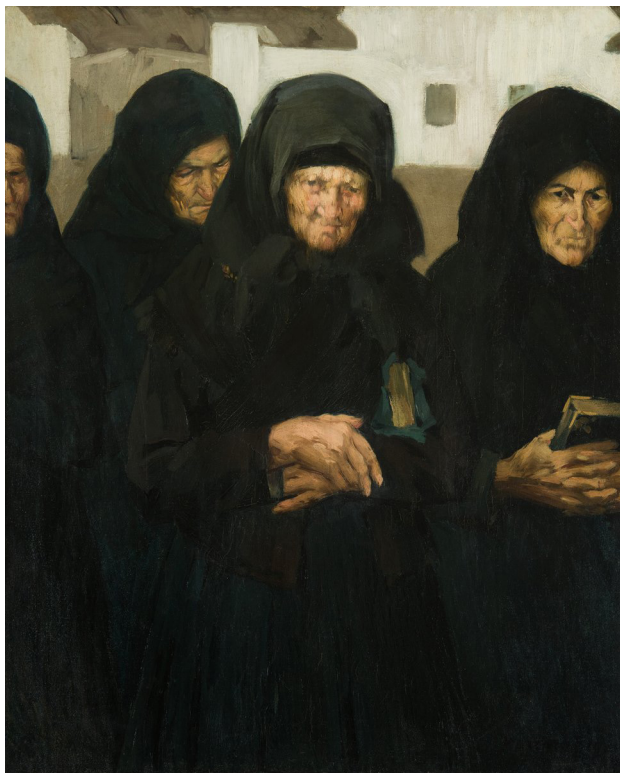
Vaszary János (1867 – 1939) festménye/Magyar Nemzeti Galéria