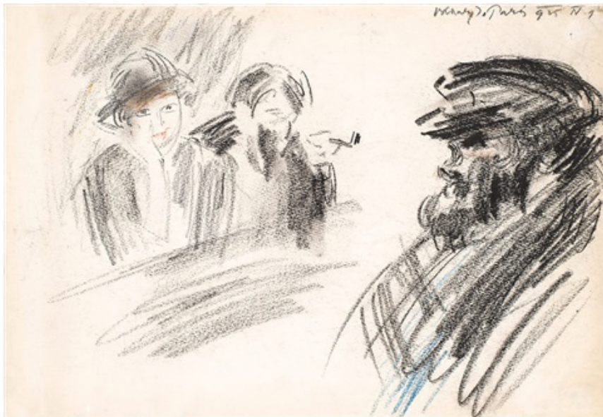
Vaszary János (1867–1939) grafikája

A lány, Kölyök tekintetével a tarkóján, befordult a sarkon. Fehér pálcájával maga előtt kopogtatva lépdelt. Valahová időben oda kell érnie.