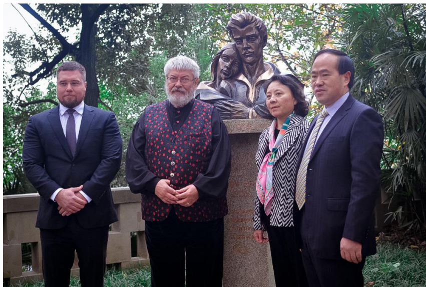
A Petőfi Sándor- és Szendrey Júlia-szobor felavatási és adományozási ünnepsége

Nem kétséges, hogy Csunking városa e szoborral belépőt szerzett magának nemcsak a magyar irodalomtörténetbe, hanem megjelent a magyar nemzet kiterjesztett énjének valóságában is.