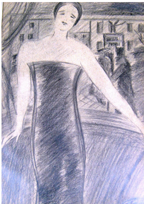
Vaszary János (1867–1939) grafikája

Tóth Krisztina: Fehér farkas . Magvető, Budapest, 2019.