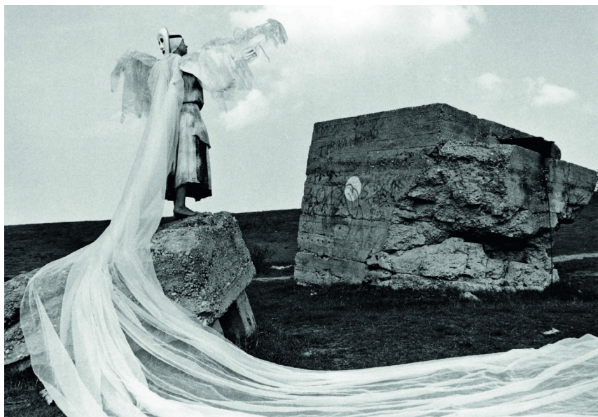
Bukott angyal, akció, Újvidék, 1988

ként és művészként is. A szabadságra meg kell érni? Mi neked a szabadság most? A költészet, Hvar szigete, a természet közelsége, a színpadi élmény, az utazás aktusa? S mennyiben köthető ez a szabadság lakóhelyhez, környezethez?