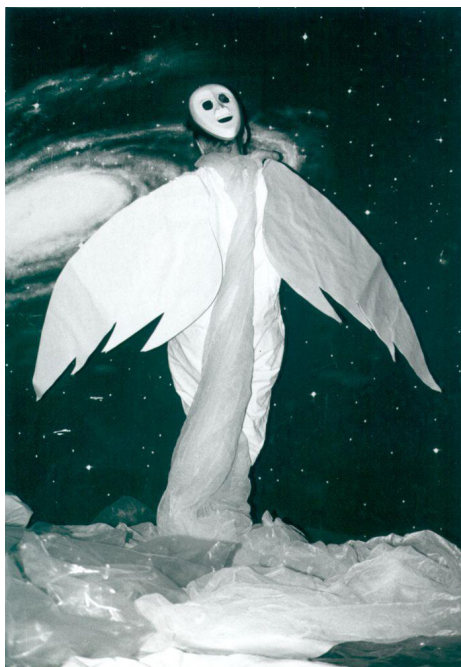
Bukott angyal, Szeged, 1992

bai Pétertől idézett mottó: Ismertek bennem téged és engem tebenned.