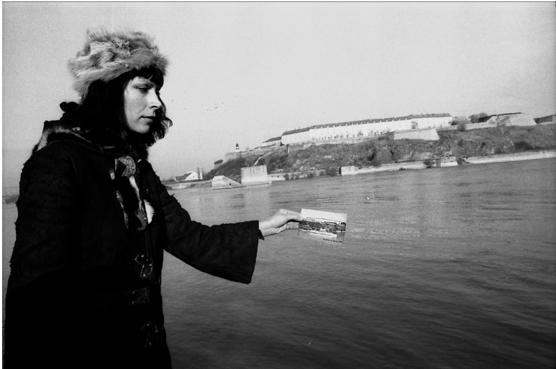
Újvidék leeresztése a Dunán