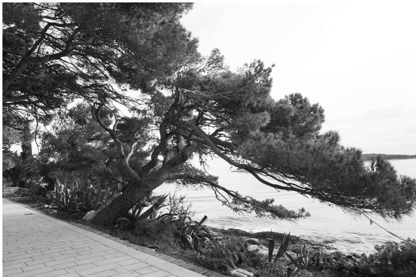
A költő kedvenc fája Hváron, 2015

Medréből szomorúan kihajolt, a fény fáradt hullámaira, őszülő vízre horgolta az Írást.