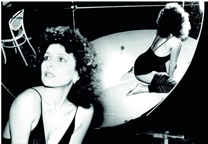
Bayer aspirin, 1982

– Budapesten teljesen új életet kezdtem ötvenévesen, de mégis folytattam régi, küzdelmes életemet: a mindennapi betevő falat megszerzése, lakásgondok... De néhány év múlva folytathattam az alkotómunkát is. A nagyvárost választottam, hogy jobban elrejtőzhessen. A Jugoszlávia ellen bevezetett zárlat miatt a nyolcvanas évek közepétől nem utazhattam külföldre, és megszakadt külföldi karrierem. Később, a kilencvenes évek elején kitört háború miatt áttelepültem Magyarországra, és Budapest jó helyszín volt számomra, hogy folytassam alkotói tevékenységemet, és újra szerepeljek külföldön.