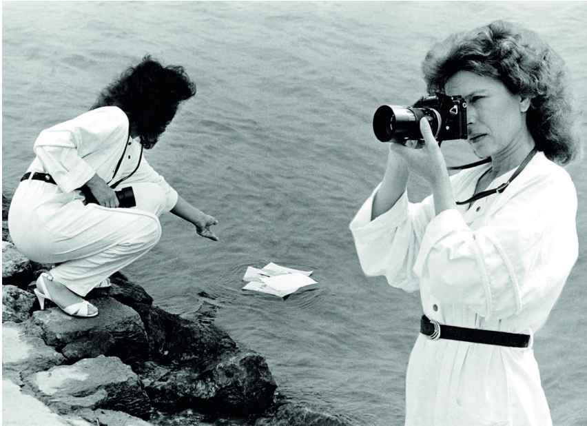
Budapest leeresztése a Dunán, 1988, Baksa Gáspár kollázsa