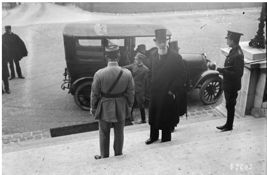
Apponyi Albert 1920. január 15-én megérkezik a francia külügyminisztériumba, hogy átvegye a békeszerződés tervezetét a külügyminisztérium híres óratermében