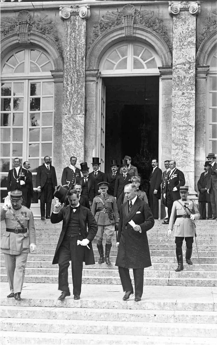
1920. június 4-én, néhány perccel a trianoni békeszerződés aláírása után Benárd Ágost küldöttségvezető (balra, cilinderral a kezében) és Drasche-Lázár Alfréd rendkívüli követ, államtitkár (jobbra, fedetlen fővel) elhagyja a versailles-i Nagy Trianon-kastélyt