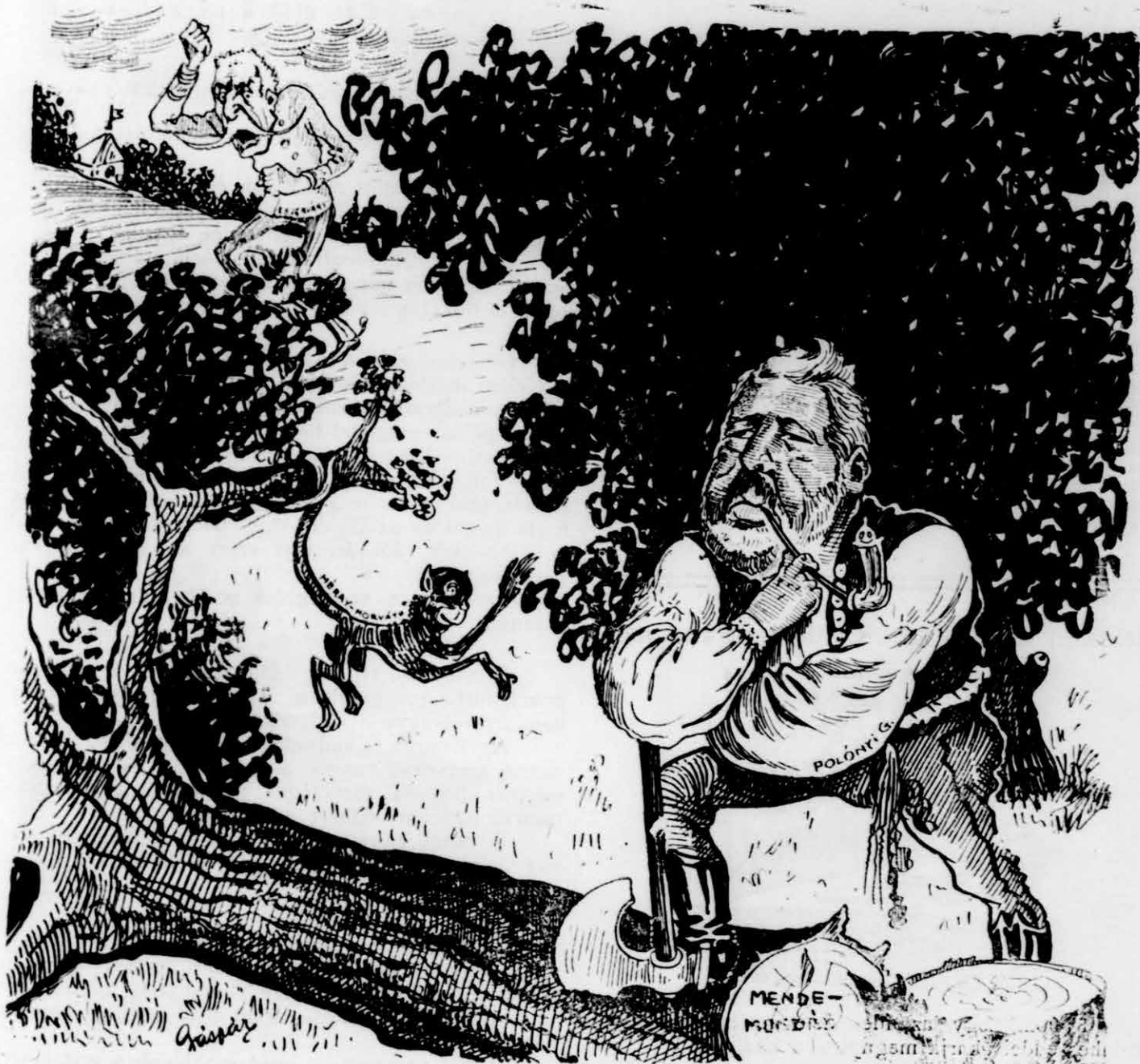
Kidőlt a fa Mandulástul.