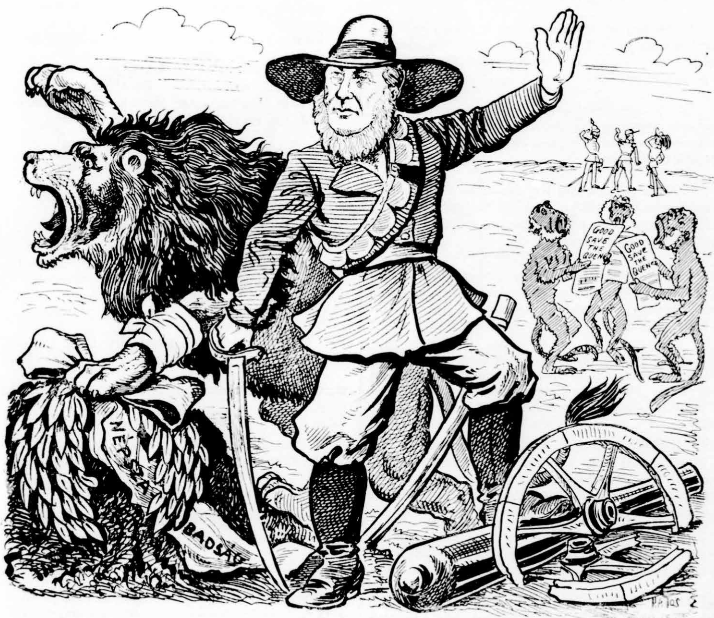
Krüger: Azért mi győztünk, mert az ilyen halálban már benne van a föltámadás.