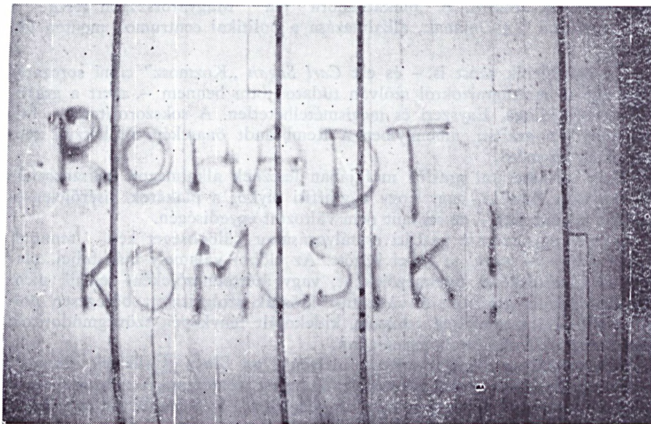
1.kép Salgótarján, városközpont. (vörös neolux, 1 x 2 m) Szöveg: ROHADT KOMCSIK!