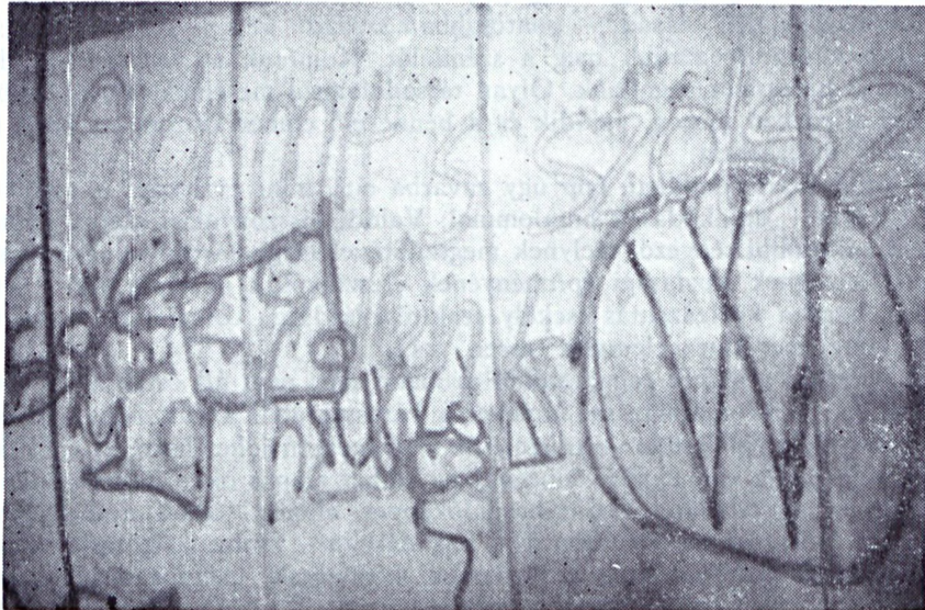
11.kép Salgótarján, városközpont (falrészlet, vegyes technika)

Salgótarján, városközpont (Ø,5 x Ø,6, vörös neolux, v. akrill) Szöveg: NEW YORK CITY