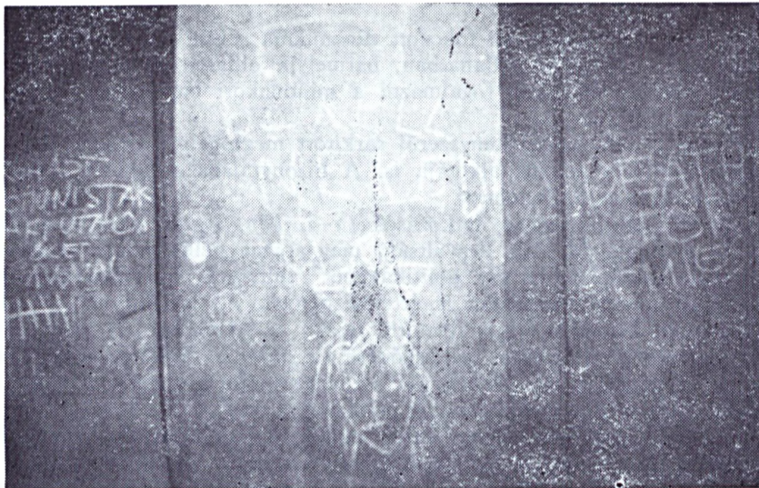
3.kép Salgótarján, Pécskö út. (1 x 0,5 m, kréta) Szöveg (középen): EZ KELL NEKED ? (jobb oldalon): ROHADT KOMMUNISTAK AKI UTALJA OKET HUZZON EGY VONALAT