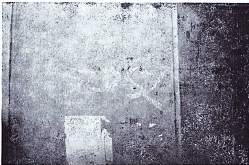
9.kép Salgótarján, városközpont (0,2 x 0,5 m, kréta) Szöveg: SZDSZ