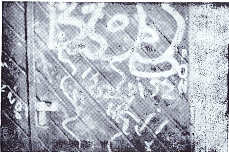
8.kép Salgótarján, Arany J.út (0,5 x 1 m, kréta) Szöveg: NO(Z)DISZ-DISZNO