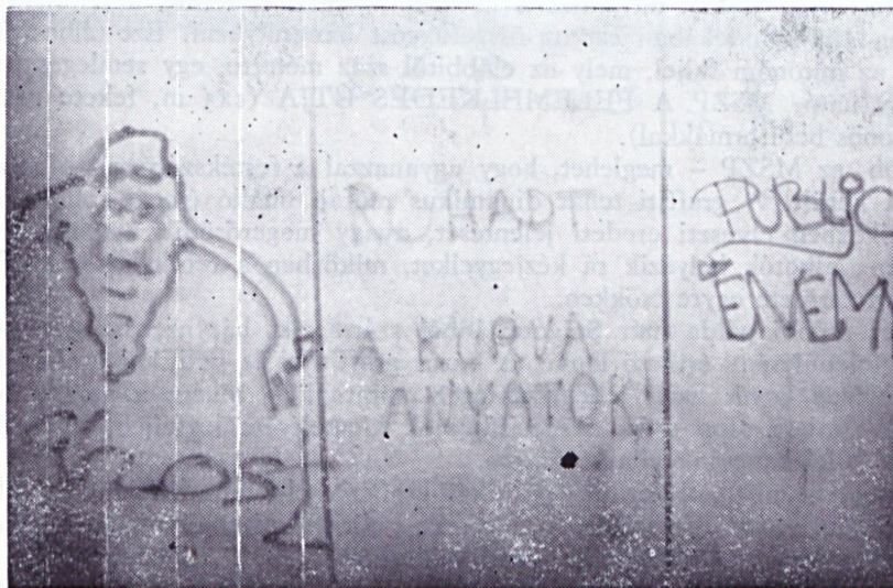
2.kép Salgótarján, Mérleg út. (fekete neolux, 1 x 1 m, középen mészkövet kitakarás) Szöveg: ROHADT KOMMUNISTAK A KURVA ANYATOK!