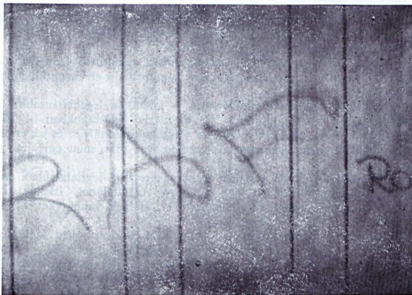
7.kép Salgótarján, városközpont (0,5 x 1 m, vörös neolux, v. akrill) Szöveg: RAF

A 7. kép szövege: RAF (Vörös Hadsereg Frakció – nyugatnémet ter-