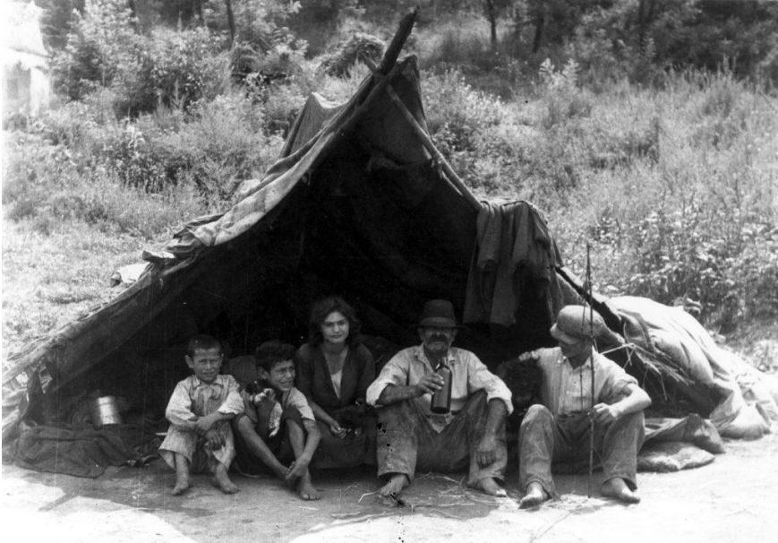
Sátoros oláh cigányok. Kisterenye, Nógrád megye.