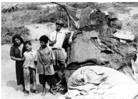
Sátoros oláh cigány család. Kisterenye, Nógrád megye. Erdős Kamill felvétele, 1959.

Erdős munkásságának kiemelkedő részét jelentették gyűjtőútjai. Publikációi és hagyatékban maradt, kiadatlan írásai e gyűjtőutak során szerzett anyagaiból születtek. 1956-ig csak véletlenszerűen gyűjtött a környezetébe került cigányoktól. Különösen sok kórházi adatközlője volt. 1956-tól kezdődtek a tudatos és szakszerű, széleskörű és alapos szakirodalmi felkészülésre alapozott nyári gyűjtőútjai az ország különböző tájaira az egyes cigány népcsoportokat felkeresve. Ezen utak közé tartozott 1956-os Nógrád megyei gyűjtése, amikor is főleg Balassagyarmaton gyűjtött. 1957 nyarán – az előző évi súlyos tüdővérzéséből felépülve – ismét Balassagyarmaton és környékén gyűjtött a kárpáti cigányok között. 1959-ben a kisterenyei cigányságot kereste fel és készített róluk számos, életmódjukat dokumentáló fényképet.