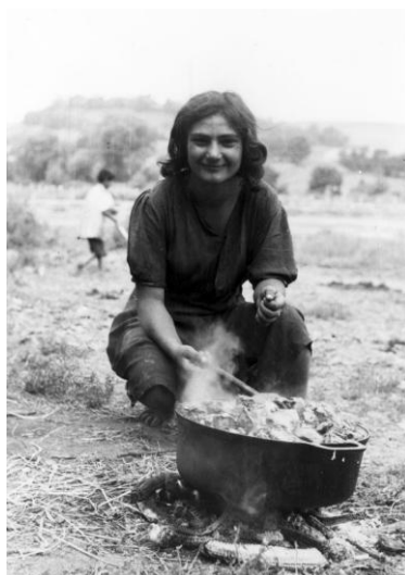
Ebédet főző cigányasszony. Kisterenye, Nógrád megye. Erdős Kamill felvétele, 1959.

Egyik legkorábbi, fontos publikációja az Adatok a Nógrád megyei „kárpáti” magyar-cigány varázsláshoz a Néprajzi Közleményekben jelent meg 1957-