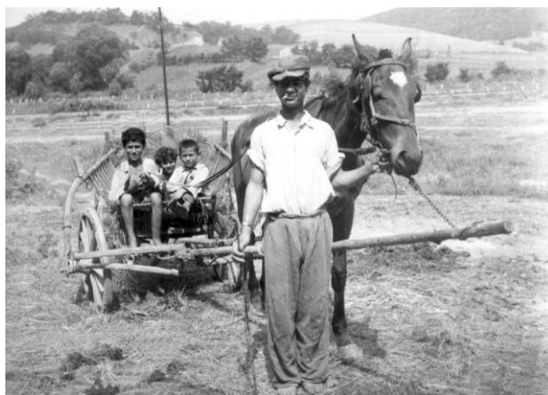
Sátoros oláhcigány férfi három gyermekével. Kisterenye, Nógrád megye. Erdős Kamill felvétele, 1959.

Bár egyes vélekedések szerint jelentősége túlértékelt, Erdős Kamill meghatározó hatást fejtett ki a magyarországi cigányügyre. Az országban fellelhető minden cigány nyelvi csoportot megismert, és megalkotta a cigánykutatás ma is használatos fogalmi hálóját. „Ha megnézzük a mai magyarországi csoportokat, az általa meghatározott kategóriákat használják a kutatók” – állapította meg Landauer Attila, az MRE cigánymissziós referense. 8 Erre példa, hogy foglalkozás alapján állított fel csoportokat, az oláhcigányságot többek között lókereskedőkként, üstfoltozókként és sátorosokként csoportosította. 9