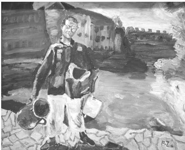
Botos Zoltán: Fazékárus egy kőpárkányon

Kedves közönség, kedves ismerőseim, – azt hiszem, mondhatom ezt így, hiszen eltöltöttünk együtt közösen egy fél órát – a kiállítást ezennel megnyitom.