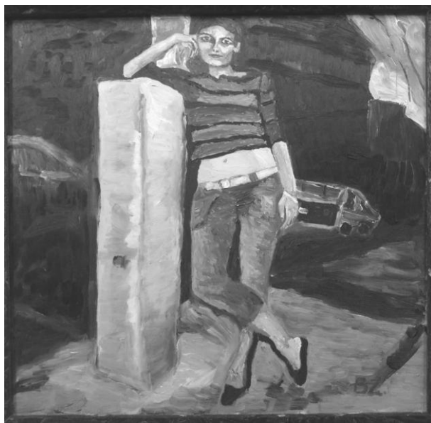
Botos Zoltán: Valakit vár

A feleségét csókoló férj látványa a világ bármely pontján érvényes. Foglalkozás, életkor, társadalmi helyzet – mindez lényegtelen. Egyetlen dolog állandó minden esetben: érezhető benne az asszonyi sértődöttség, a harag, ami a világ minden asszonyát megérintette már Jakutföldtől Afrika déli csücskéig. Azért ismerős, mert valódi. A jelenet azért fontos, mert örök időktől fogva létezik, bolygónk bármely szegletében. És ez valószínűleg így is marad. Emiatt az állandóság miatt illeszkedik az idő folyamába. A pillanatot megelőzi egy másik, valami, ami csak a kép szereplői számára valóság, számunkra ismeretlen, ha az alaphelyzetet át is éltük már valamilyen módon. És bár a csók kedves, mondhatnám, vidám, mégis szomorú a kép. Épp attól, amit nem tudok, a titkos szomorúságtól, amit az asszony rejt. A bánat ismeretlensége intimitást hordoz.