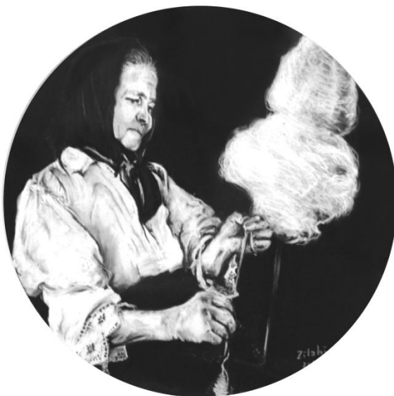
Zilabi Nono: Székely asszony guzsallyal (2019, MAGYAR FOLKPANORÁMA sorozat, szén és paszttell, 24x24 cm)