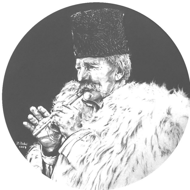
Zilahi Nono: Furuházó székeky jubász kifordított bundában, báránybőr csuklyával (2019, MAGYAR FOLKPANORÁMA sorozat, szén és pasztell, 32x32 cm)

Örömmel lapozom újra és újra a szén- és pasztellrajzokat. „Sic transit...”, jut eszembe. Magány és béke, különös csend övezi a rajzok szereplőit, akik alázattal élik hétköznapjaikat, némaságban, munkával, és bizonyára áldozattal teli életük. Mind elmennek. Esterházy Pétert parafrázálva: hallgatni legszebben a kezek hallgatnak. Legyen ez a zárszó.