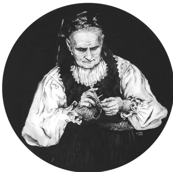
Zilabi Nono: Magyarországi kötőasszony (2019, MAGYAR FOLKPANORÁMA sorozat, szén és paszttell, 32x32 cm)