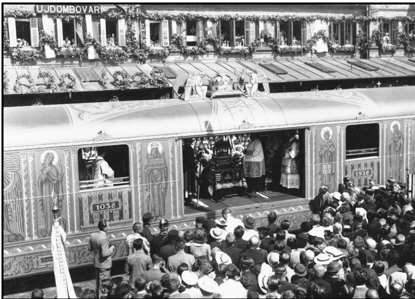
Megérkezik az Aranyvonat Újdombóvár állomásra

Másik szembeötlő különlegessége a kb. 3,3 m x 1,8 m szélességű nyílás-kiképzése volt, amely lehetővé tette, hogy a kocsi mindkét oldala felől megtekinthető legyen a Szent Jobb. Az ajtók csendes és biztonságos nyitása-zárása, a mozgatószerkezetek kialakítása, a rezgéscsillapítás és a mindmégannyi műszaki lelemény, amely a Szent Jobb-vagon, de maga az egész szerelvény biztonságos működtetését szolgálta, jelentős műszaki teljesítmény volt.