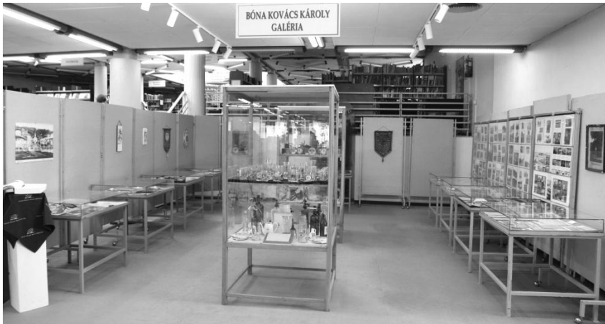
„Őrizzük emlékeinket...” Salgótarján 100 éve, várostörténeti kiállítás

Most pedig javaslom, tekintsük meg a kiállítást! Remélem, a látottak Önökből is előcsalogatják az emlékeket, mai szóhasználatnál élve: lehet nosztalgizálni. Néhány szóval szeretnénk bemutatni a kiállított anyagot. Amennyiben kérdésük lenne ezzel kapcsolatban, jelezzék, s mi megpróbálunk válaszolni rá.