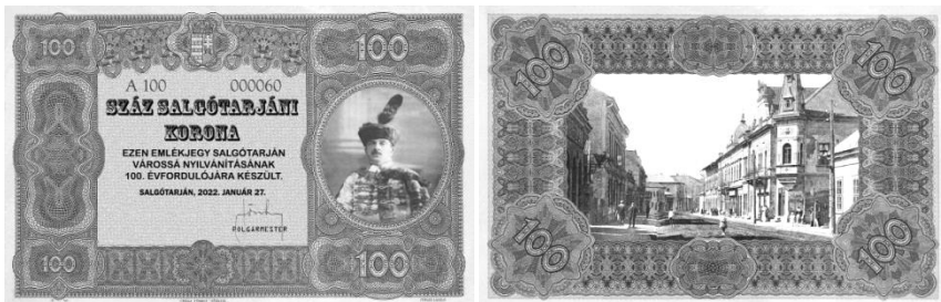
100 korona 1920 – előoldal és hátoldal (Készítette: Jubász László)

A folyamatos bányászás kérdésének megoldását az 1861-ben megalakult Szent István Kőszénbánya Társulat jelentette, amely aztán vasútépítési engedélyt is kért. A megépített Pest–Salgótarján közötti vasútvonalat 1867-ben adták át. Ezáltal a szén szállítása egyszerűbbé vált. A vasutat még abban az évben átvette az állam, ez lett a MÁV első vasútvonala.