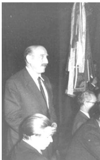
A kollégiummá avatás ünnepi előadói

Az 1966–1973 közötti időszak küzdelem az új kollégium építésért. 1966-ban fa- és falgombásodás miatt lakhatatlanná vált a kollégiumi épület több szárnya, le kellett zárni nyolc helyiséget, többek között hálótermeket is. Diákjai számára az egészséges környezet biztosításáért harcolt, ami egyet jelentett egy új kollégium megépítésével. 1969-ben az építkezést megkezdték. 7 Az építkezéssel járó nehézségek, kudarok nem csüggesztették el, hanem új küzdelmekre készítettek. A felmerült gondokkal és az elhúzódó kivitelezéssel két újságíró is foglalkozott, 1967-ben és 1972-ben. 8 Meglett az eredménye. Arcidegzsába-műtét után volt betegállományban, amikor kézhez kapta a határozatot. 1973. január 1-jén nyugdíjazták. Nyugdíjazása után tovább ta-