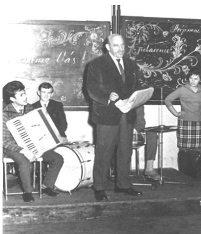
Ünnepi műsor a szlovák-magyar barátságról