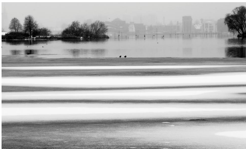
Agócs József: Tél a tavon

2021. június 12-én a Nógrád Megyei Fotóklub Egyesület „ÉLETMŰ-DÍJ” kitüntetést adományozott részére.