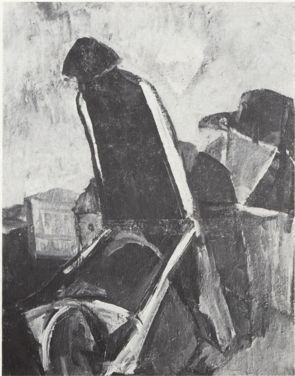
Iványi Ödön: A RÉGI TARJÁN