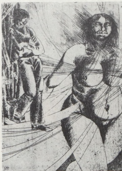
Szujó Zoltán: BOLONDÓRA (illusztráció)