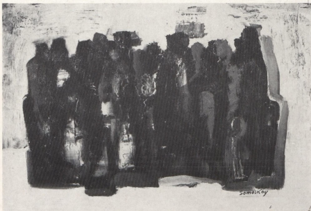
Somoskői Ödön: TÉL