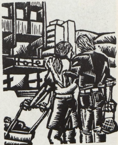
Hibó Tamás: A VÁROS