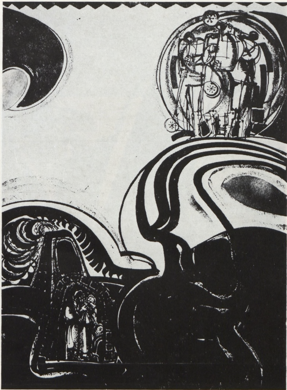
Czinke Ferenc: A VÁROS GYÖKEREI IV;