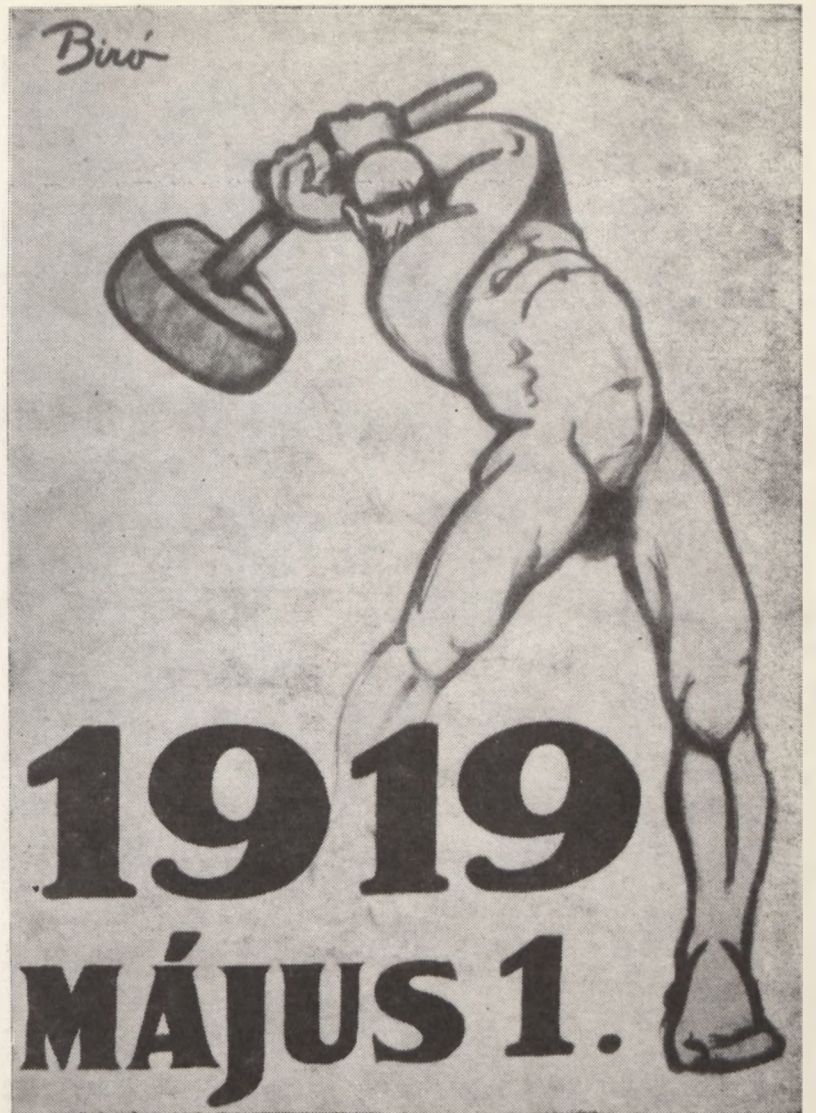
POLITIKAI PLAKÁTKIÁLLÍTÁS Balassagyarmat 1974. december — 1975. január