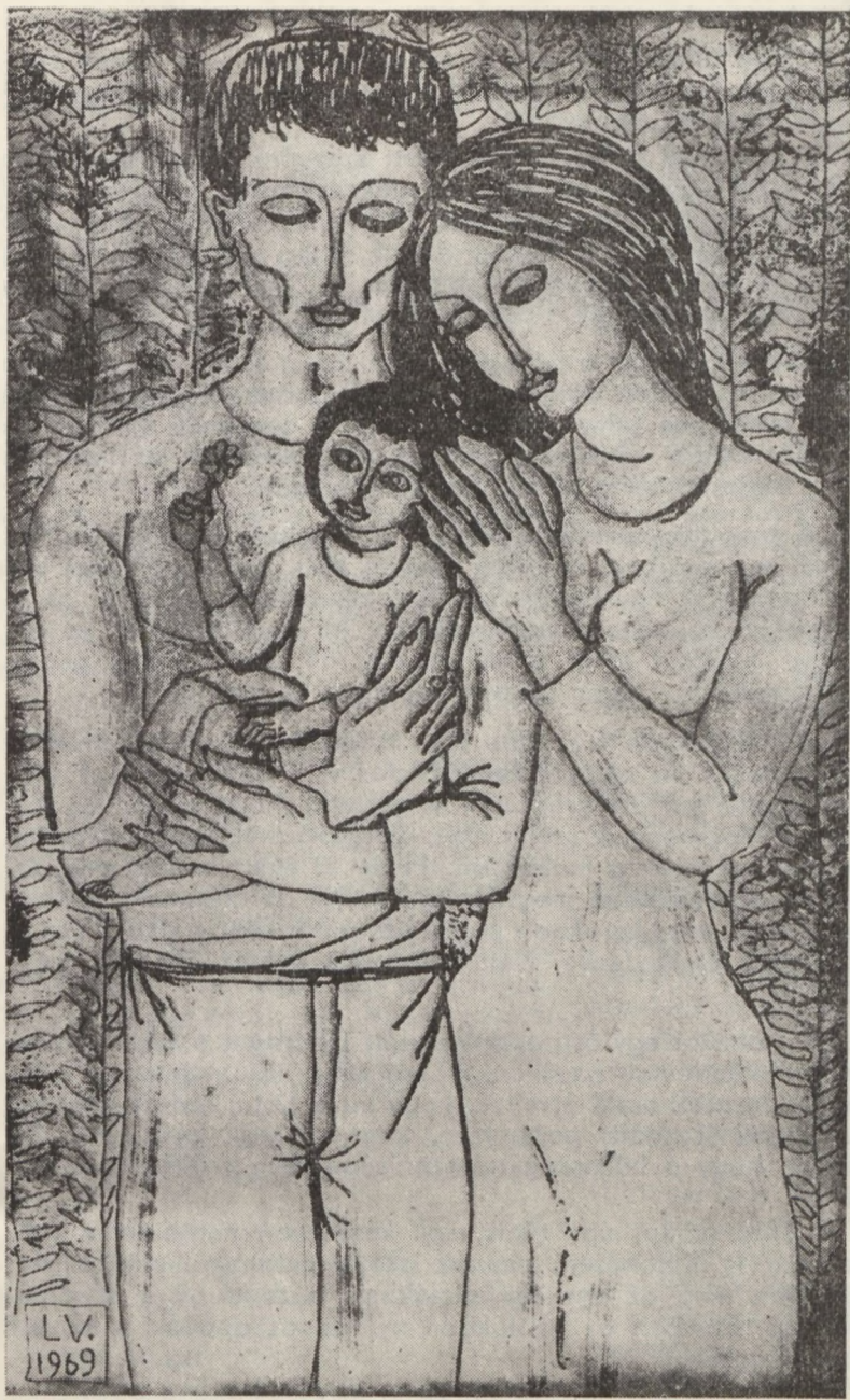
LÖRINCZ VITUS: CSALAD

zül 1971-ben 419, 1972-ben 619 kérte a művi terhességmegszakítást. Bár az összes abortuszok száma csökkenő tendenciát mutat – 1971-ről 72-re 7,2 százalékkal csökkent –, a hajadonok egyre nagyobb számban lépnek az abortusz bizottság elé.