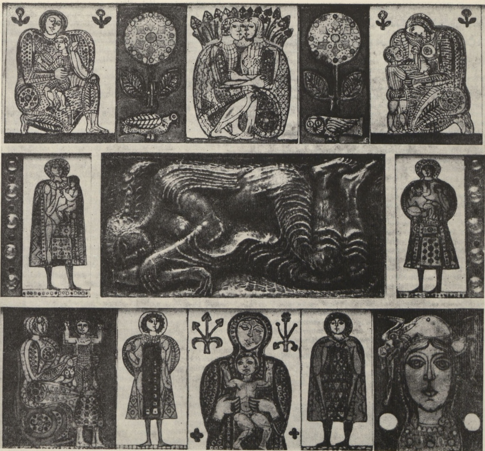
STEFANIAI EDIT: FIAM

rítési díja. A családi pótlék – pénzügyi korlátok miatt – azonban a gyermekekre fordított kiadásoknak csak kis hányadát jelenti. Vizsgálati adatok szerint egy kétgyermekes, átlagos keresetű családban az egy főre jutó jövedelem alig egy tizedét teszi ki az egy gyermek után fizetett családi pótlék. Nógrád megyében 1972. évben családi pótlék címén 57.3 millió forintot fizettek ki, 2 0/0-kal többet, mint öt évvel korábban.