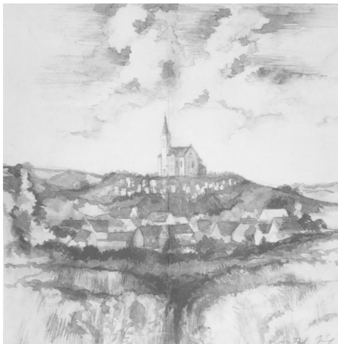
Antal József: Karancság (papír, diófafác)