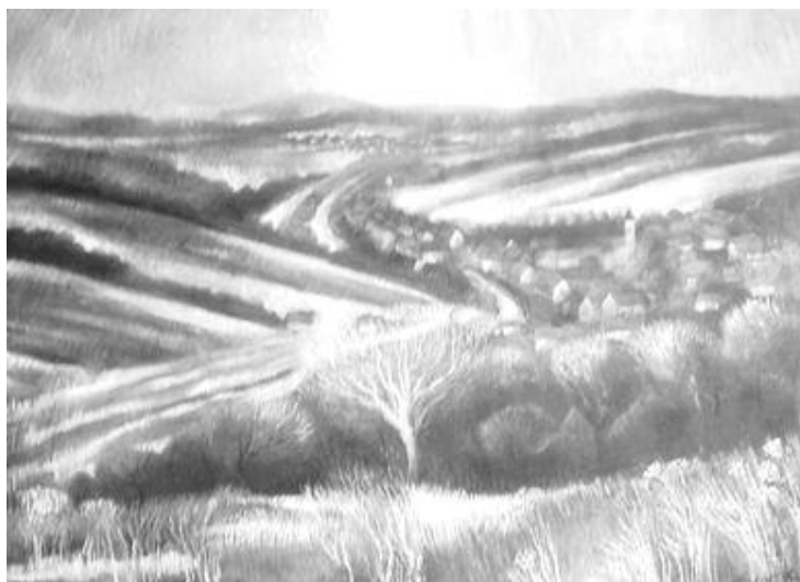
Antal József: Tél Palócföldön (papír, pasztell)