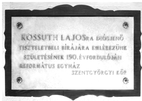
A Kossuth-emléktábla a templom bejáratánál

Nekünk, kései utódoknak az a feladatunk, hogy büszkén viselve az egész falunkat ért megtiszteltetést, méltók legyünk Kossuth szellemi örökségéhez. A Szentgyörgyi Kör kezdeményezésére születésének 190. évfordulóján egy emléktábla került a református templom falára. Az említett ereklyét a megtalálás óta a páncélszekrényben őrzik. A felújított toronyban pedig egy új feljegyzés vár arra, hogy egyszer majd tanúságul szolgáljon az utókornak.