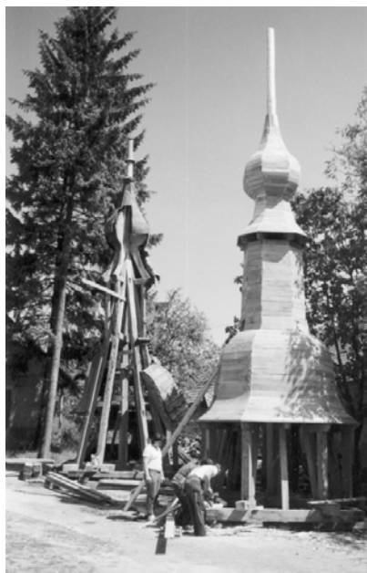
A régi és az új toronysisak

Nekünk, kései utódoknak az a feladatunk, hogy büszkén viselve az egész falunkat ért megtiszteltetést, méltók legyünk Kossuth szellemi örökségéhez. A Szentgyörgyi Kör kezdeményezésére születésének 190. évfordulóján egy emléktábla került a református templom falára. Az említett ereklyét a megtalálás óta a páncélszekrényben őrzik. A felújított toronyban pedig egy új feljegyzés vár arra, hogy egyszer majd tanúságul szolgáljon az utókornak.