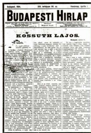
Feljegyzés a torony építéséről és a Kossuth halálhírét hozó újság

A Budapesti Hírlap 1894. április 1-jei száma teljes terjedelmében Kossuth Lajossal foglalkozik. A feljegyzés a felújítás adatait, s a református egyház Diósjenőn hivatalban lévő tisztségviselőit sorolja fel, majd egy jókívánsággal él az utókor felé: „Emlékül az Utókornak. Áldás és békeesség pedig az Olvasónak! ... Ezen új torony daczoljon az idő viharainál szemben. Védje meg az ég ura, mind kívül, mind bel ellenség fegyverei, és minden elemi csapások ellen. Boldog és Számos éntizedeken átt ékeskedjék e' mi diósjenői ev. ref. Egyházunknak méltó díszére, és fényes Csillagával is intse az utókort, hasonló példás Keresztyéni buzgóság teljesítésére, a' mindenkori egyetértés, béke és Szeretet Szíves gyakorlására, Megváltó Urunk a' Jézus Krisztus nevében!”