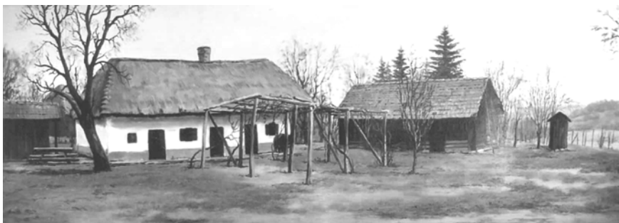
Bihari Publ Levente: Órségi házak (olaj-farost, 30 x 80,06 cm)

Zoli bácsi, nyugodj békében, mi pedig olvassuk inkább a meséidet, merüljünk el egy álomvilágban, ahol a korona még a királyhoz tartozott és nem a vírushoz.