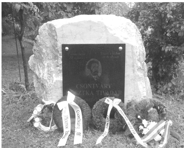
Emléktábla a gácsi patika előtt

A padlásán maradt további képek sorsáról Csontváry életművének egyik feldolgozója, Mezei Ottó gácsi látogatásakor Ruzsinszky Gyula számolt be. „...ballottam, hogy fest, de a képeit csak akkor láttam, amikor beköltöztünk ide, ebbe a házba. Az egész padlás tele volt velük. ... Rég volt ez már, kérem. Elégettem őket. ... koszosak, porosak is voltak azok. Egy darabig jöttek ide valami losonci kereskedő-félék és egyikért-másikért itt hagytak ilyen bekeretezett szentképeket, de aztán már azokkal is tele lett a ház. A feleségem meg azt mondta, hogy elege van a nagy jövés-menésből, és akkor lebordtuk a képeket az udvarra és meggyújtottuk őket. Kellott a hely a padlásán, na! Mert sok kép volt ott kérem. Emlékszem, órákig égett a tűz, pedig azok jól égtek, mert jól kiszáradt fából meg vászonzól volt mind.” 37