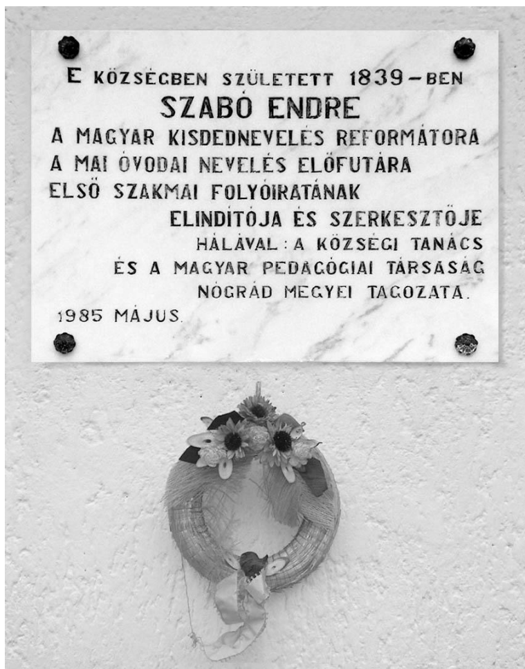
Szabó Endre emléktáblája Nagyorosziban