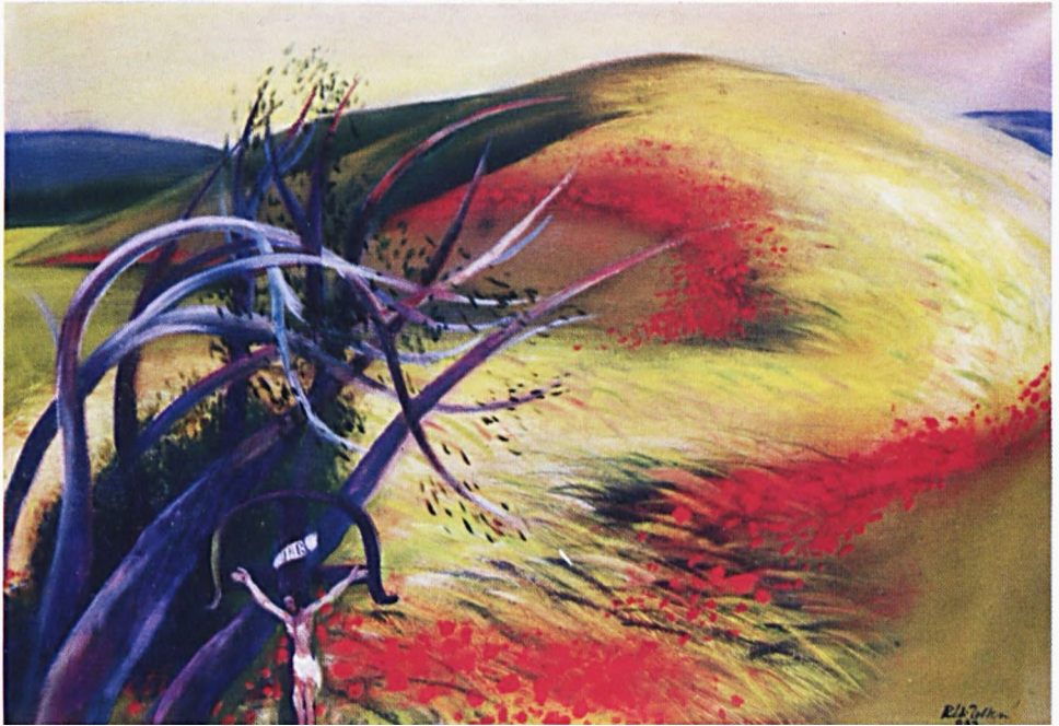
Réti Zoltán: Búza – pipacs – fészület (olaj)