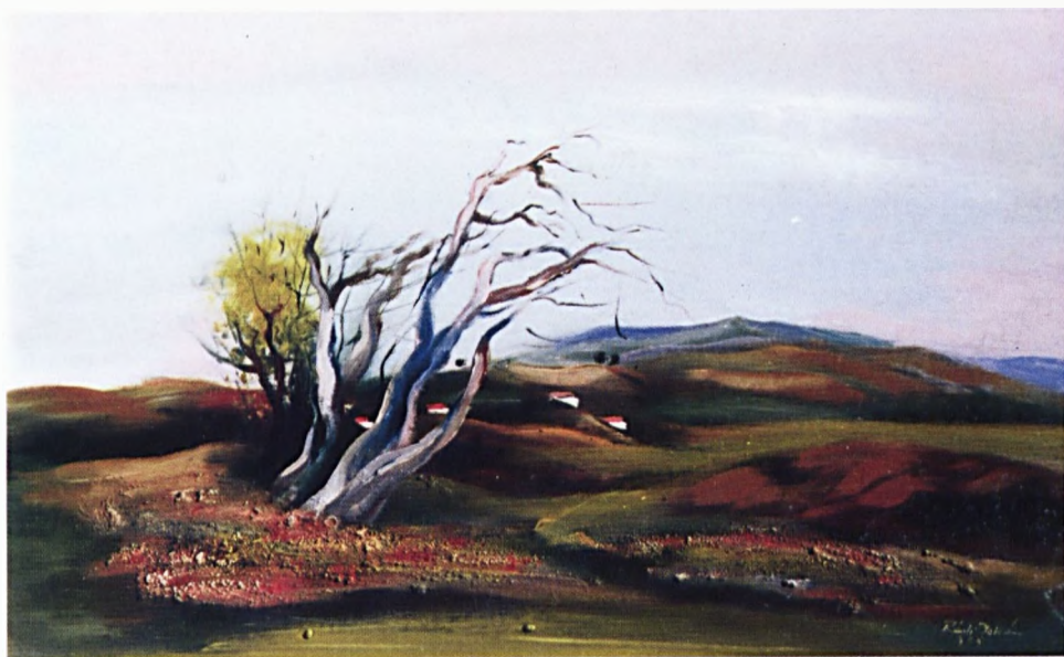
Réti Zoltán : Nógrádi dombok (olaj)