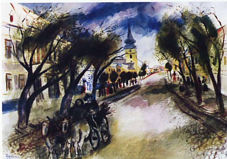
Réti Zoltán : Gyarmati főutca régen (akvarell)