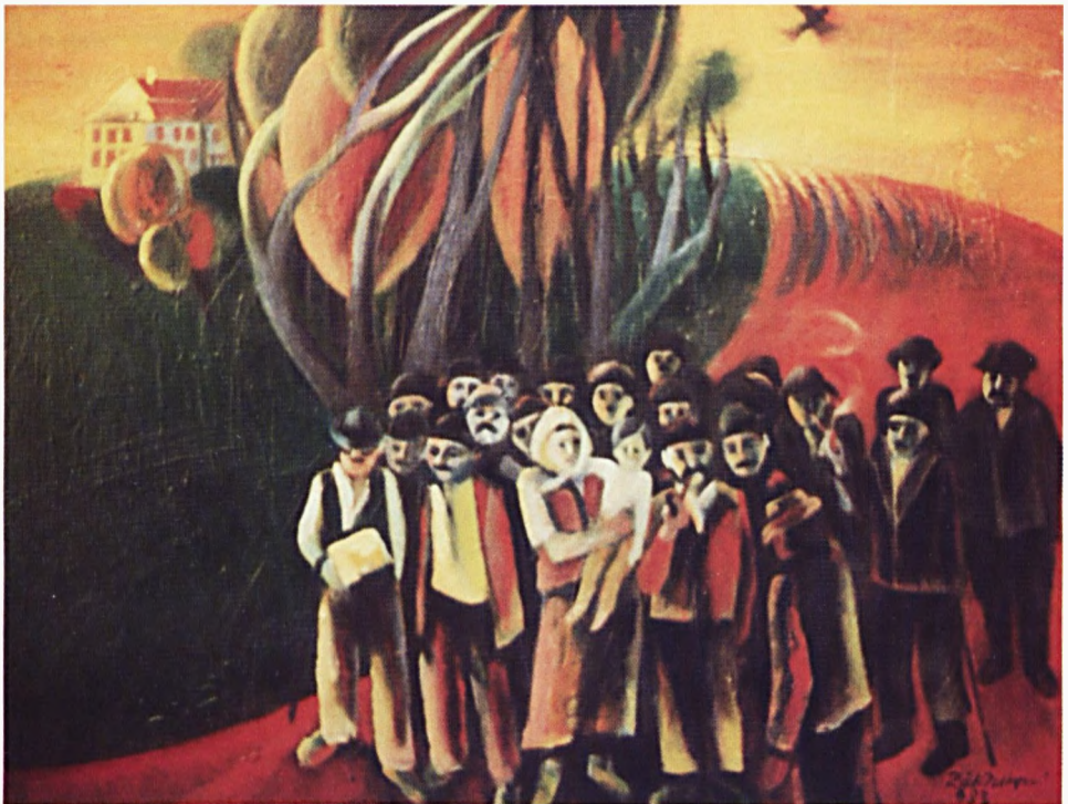
Réti Zoltán: Nógrádi ballada (olaj)