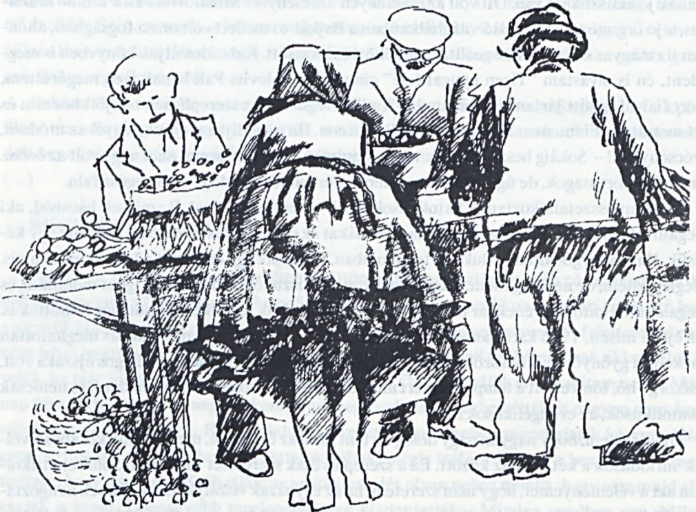
Réti Zoltán : Piacon (tus)