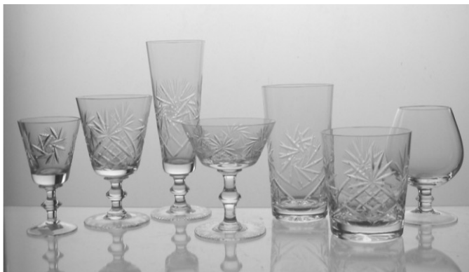
Az egyik leismertebb asztali készlet

Kül- és belkereskedelmet bonyolító cégek információit felhasználva alakították termékszerkezetüket. A kézi gyártás fejlesztése munkaerő hiányában korlátozottá vált. Jelentős piaci növekedés a lámpabúra, csillár-üveg, a vékony falú pohár és kehely, a préselt poharak, korsók, a festett áruk gépi gyártásával volt elérhető. Évente több mint háromezer termék szerepelt a gyártáslistán, amiből 2300 csiszolt, festett, sima fehér, színkombinációs minőségi öblösüveg, díszműáru volt.