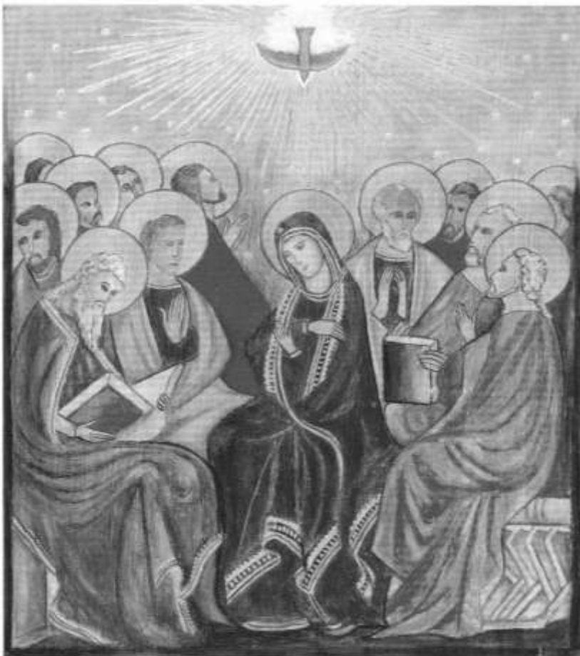
Veres József: Pentecosté

hatjuk – annyi művészeti iskola volt, ahány város egy-egy országban, Bizáncban viszont a teokratikus állam legszigorúbb ellenőrzése alatt állt az egész szellemi élet. A császár katonai győzelmeit is úgy kellett feltüntetni, mint az isteni eleve elrendelés megvalósulását. „Így a dicsőség római eszményképe – amint olvashatjuk a téma egyik legjobb ismerője, Viktor Lazarev orosz-szovjet művészettörténész a Bizánci festészet című könyvében – észrevétlenül önmaga tagadásává: a keresztény alázat eszméjévé alakult át... A pátriárkák nem engedték meg a dogmák szabad értelmezését, még a szertartásoktól való eltéréseket sem tűrték...” Ebből következik az ikonfestészet szigorú szabályokba merevítése, örökké való kötöttsége.