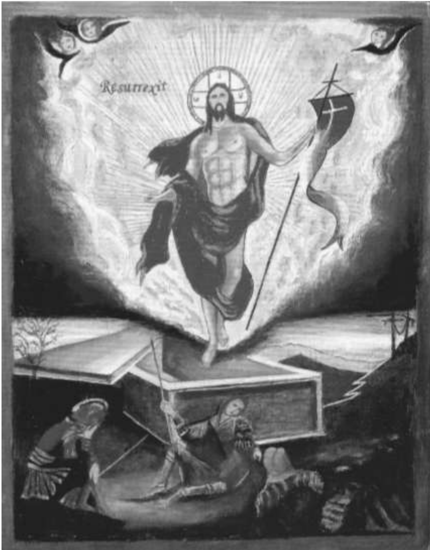
Veres József: Resurrexit