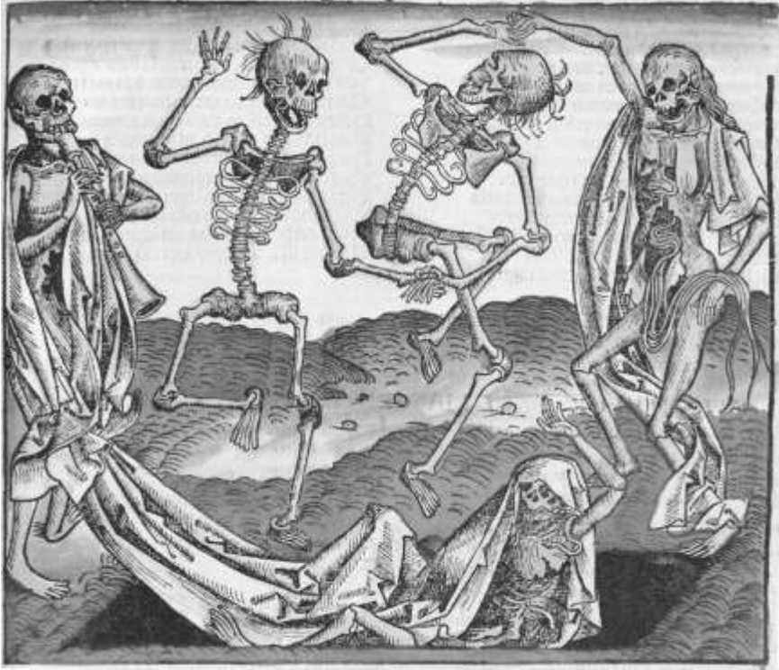
Haláltánc- ( dans macabre -) ábrázolás Michael Wohlgemut fametszetén Hartmann Schedel Világkrónikájában , 1493 (Forrás: Horányi–Magyar 2007, 63.)

Az éhínséggel együtt jártak a különböző betegségek, köztük az Európát 1346–1352 között elérő fekete halál; ennek első hullámát a becslések szerint a kontinens lakosságának 30%-a (mintegy 30 millió ember) nem élte túl. 15 Ez a járvány már a csökkent ellenálló képességű, betegségekől megtizedelt, éhezéstől legyengült lakosságot sújtotta; csak ezzel magyarázható, hogy ilyen mértékű pusztítást tudott végezni. Ráadásul gyakran más kórokozókkal együtt lépett fel, amely tovább fokozta a halálozási rátát. A feltárt járványtemetők tömegsírjai alapján is azonos időben bekövetkezett nagyarányú pusztulással számolhatunk. 16