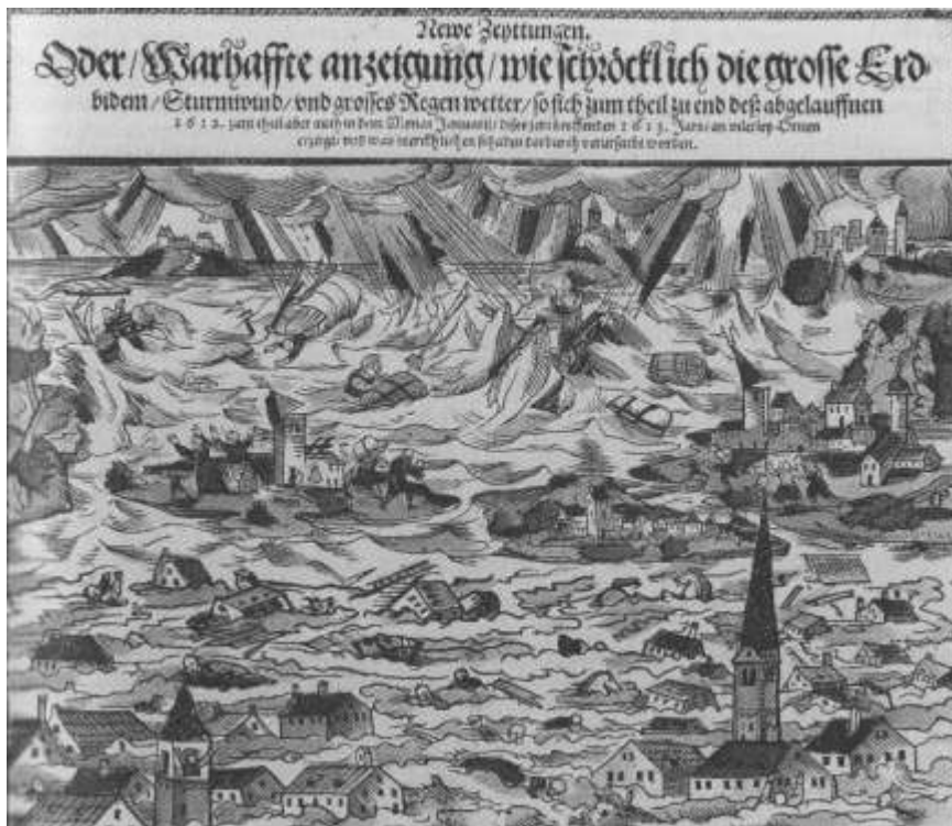
Az 1612–1613. évi thüringiai vízözön (fajetszet, forrás: Bebringer 2010, 131. 22. ábra)

vizek indultak meg. Az árhullámok – amellet, hogy hosszú időre megváltoztatták a táj arculatát – jelentékeny termőterületeket tettek tönkre, ahol megsemmisült a gabona, drágulás és éhínség lépett fel.