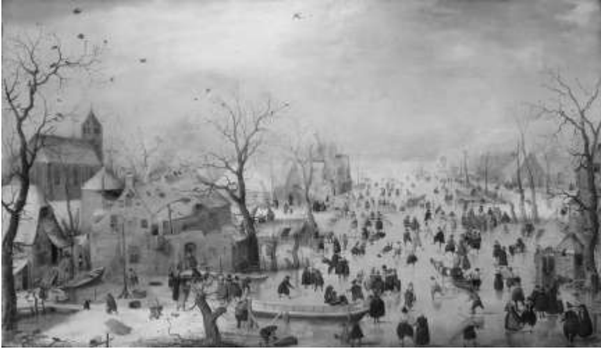
Hendrick Avercamp: Téli tájkép (1608 körül, Amszterdam, Rijksmuseum)

hullámokkal (pl. 1317–1318-ban, amikor a tél novembertől húsvétig tartott, sőt egyes területeken még júniusban is havazott) együtt járt a folyók és tavak gyakori, extrém mértékű, hosszú ideig tartó befagyása.