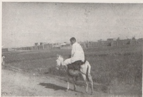
A sivatag „csónakja”