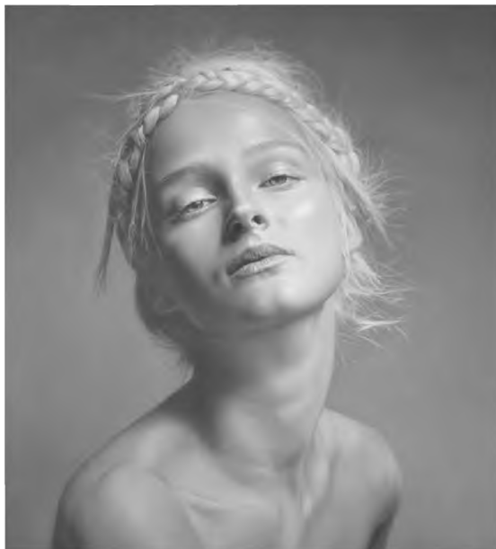
Kovács Péter Garp: Carmen

A kiállítás címadó műve tulajdonképpen egy triptichon középképe, amely első pillantásra egy bájos, már-már banális jelenetet tár elénk. Az alkotáson fiatal lány tart kezében egy aranyos, bundás nyuszt, balra az állatka ismétlődik felnagyítva, jobbra a lány arcát látjuk közelről, s azzal szembesülünk, hogy a fiatal nő nem a nyuszt nézi, hanem minket figyel, különös, zavarba ejtő, merev tekintettel. Vajon mi törékenyebb a képen? A lány figurája vagy a bájos jelenet és a szinte merev tekintet és figura közti egyensúly?