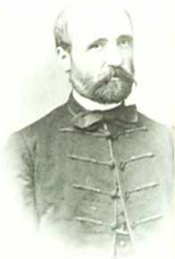
Bérczy Károly (1821-1867) portréja és Szép az élet... című kéziratos verse 1844-ből